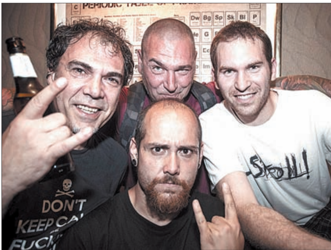
Memento Mori HC acaparon cinco premios, entre ellos un bolo en la Festa Major