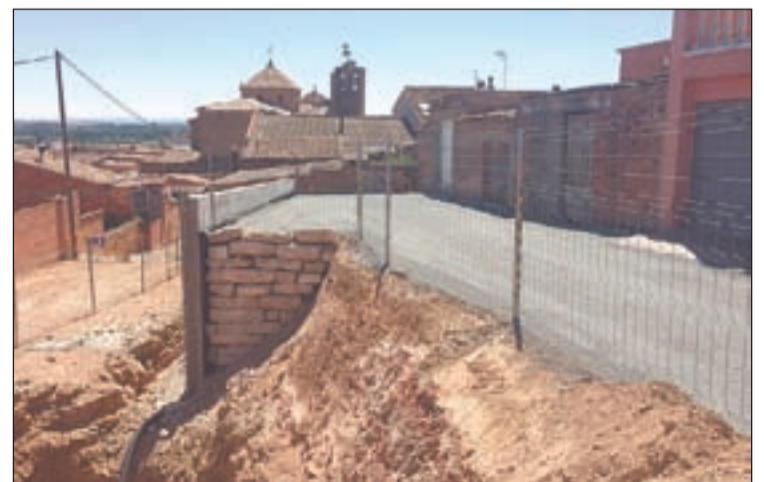
L'obra es fa per evitar les esllavissades

jectiu bàsic del camp de treball és el de garantir el trànsit de persones pels camins amb comoditat i seguretat i alhora sensibilitzar els participants del camp de treball.