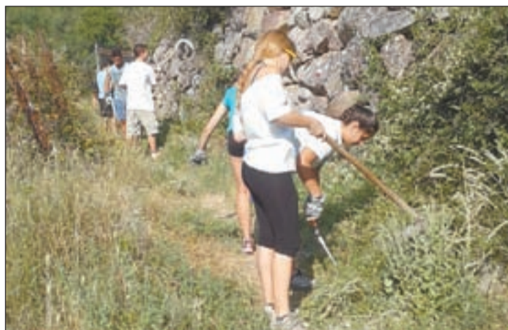
Joves treballant per recuperar els camins

tant, necessita aquesta ajuda". L'objectiu del pla, va dir, ha de ser "readaptar" la producció a les millors varietats i les millors zones per aconseguir "el potencial de qualitat que tant desitgem". És per això que es va sumar a la petició que el dimecres feia el sindicat Unió de Pagesos per tal que l'administració estudiï un nou pla de reconversió que pugui donar una "empenta" als pagesos.