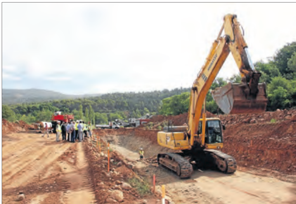
El reg de la Conca de Tremp es va desencallar el 2012, però només va implicar una petita part de l'obra.

construir en aquesta fase que connecti la canonada principal del pont de Peramola fins a l'estació de bombatge. La segona part consisteix a dotar l'estació de bombatge de quinze grups d'electrobombes.