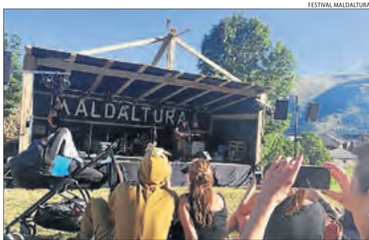
El festival Maldaltura, amb un escenari als afores de Llessui.

D'altra banda, també al Pallars Sobirà, la quarta edició del Festival Maldaltura de música independent, a Llessui el 14 i 15 de juliol, ha anunciat la banda lleidatana Renaldo & Clara entre les primeres confirmacions d'artistes. Els acompanyaran el grup de Collbató de dark folk