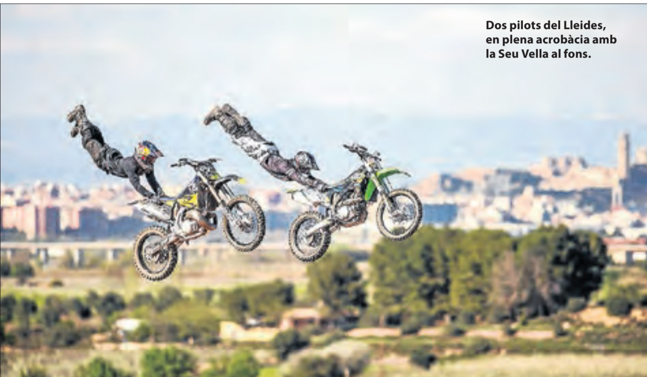
Dos pilots del Lleides, en plena acrobàcia amb la Seu Vella al fons.

Un jove de 25 anys va resultar ferit greu a l'abril al caure a la Noguera Pallaresa al tenir un accident quan feia pònting a Esterri. A pesar d'aquest succés, la seguretat és primordial per a les empreses de turisme actiu.