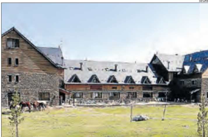
L'estació de Port Ainé, on se celebrarà el campionat.

RIALP | L'associació ecologista Depana ha sol·licitat a la conselleria de Territori i Sostenibilitat que insti a canviar la ubicació del Campionat d'Espanya de Compak Sporting (tir al plat) que se celebrarà a l'estació de Port Ainé, a Rialp, del 16 al 18 de juny, per les greus repercussions en l'hàbitat del gall fer. Segons l'entitat, la zona és una àrea on es té constància de poblacions estables de gall fer i les proves es portaran a terme just en el període reproductor, entre els mesos de març i juliol, la qual cosa suposa una amenaça per a una espècie en perill, segons el catàleg d'espècies amenaçades a la Península. Depana assegura que la població de gall fer al Parc Natural de l'Alt Pirineu i Aran es va xifrar l'any 2005 en uns cent