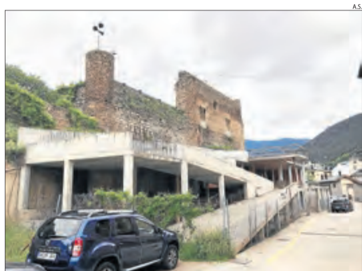
Estat actual de les obres de la biblioteca comarcal.

TREMP | L'assemblea de la plataforma contra l'autopista elèctrica a Tremp es va reunir divendres per posar en comú la situació del projecte de recreixement de la línia de Foradada a la Pobla de Segur que promou REE. L'objectiu és organitzar accions de lluita social i col·lectiva per aturar l'obra. L'acte va comptar amb l'assistència d'una vintena de persones. D'aquesta forma, respon a l'acord d'impacte ambiental del projecte d'augment de la capacitat de transport de la línia elèctrica de 220 kV de Foradada a la Pobla de Segur. La plataforma critica que el Govern doni llum verda a l'impacte, quan Territori i Sostenibilitat considera que hi ha determinats aspectes que encara no estan ben definits.