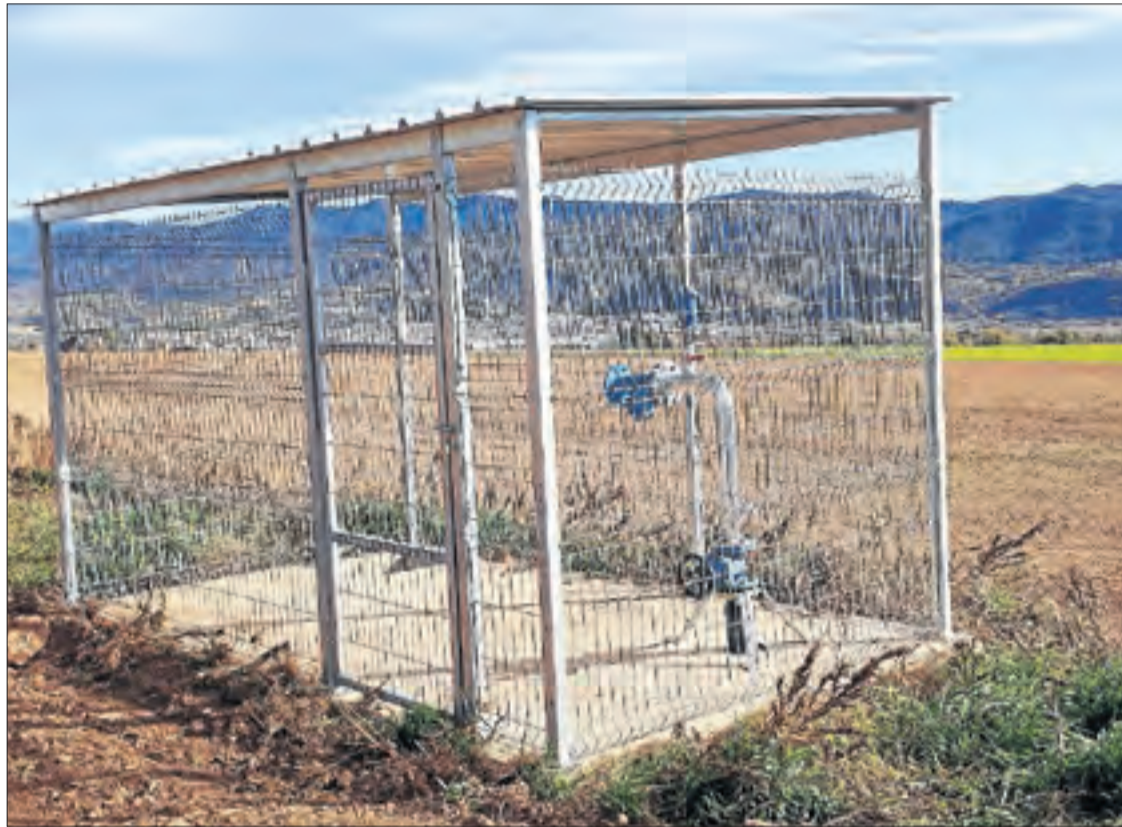
A Peramola sí que hi ha construïda la xarxa secundària (a la imatge), que va fer la Generalitat.

Els primers treballs s'havien de prolongar durant deu mesos en una primera fase, per construir una canonada d'1,5 quilòmetres, que també s'ha de