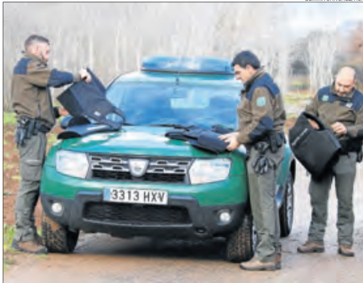
Els rurals van patrullar amb armilles dies després del doble crim.

Els sindicats assenyalen que, malgrat les promeses polítiques, aquests agents continuen treballant en les mateixes condicions i continuen "exposats als mateixos riscos". I remarquen que ni tan sols a Catalunya s'han produït canvis, ja que la comissió creada arran d'Aspa per establir mesures de seguretat encara no ha donat els seus fruits. En aquest sentit, les formacions sindicals insisteixen que el cos mediambiental ha patit múltiples agressions i