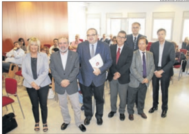
Reñé amb alguns dels ponents a les jornades tècniques.

Va insistir en el fet que Lleida està integrada per molts petits pobles que moltes vegades depenen dels ajuts de la Diputació davant de la tardança de les subvencions del Govern i l'escassetat de diners per part de l'Estat. Al llarg de tot el matí, experts en aquesta matèria van definir