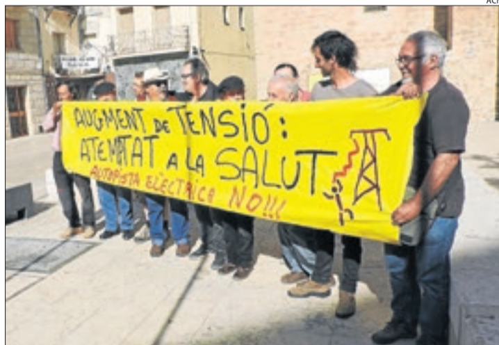
Manifestació de dimecres davant de l'ajuntament de Tremp.

D'altra banda, en el ple del Parlament de dimecres, el con-