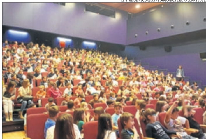
CENTRE DE RECURSOS PEDAGÒGICS DEL PALLARS JUSSÀ

Un miler d'alumnes dels nou centres de Primària i Secundària del Pallars Jussà han participat en un cicle de teatre en anglès. Una activitat anual que permet treballar les habilitats lingüístiques a partir de la posada en escena de l'obra i del material didàctic que l'acompanya. El cicle s'ha dut a terme a La Lira de Tremp i al Centre Cívic de la Poble de Segur.