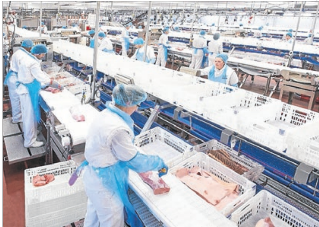
Imatge d'una sala d'espejament de BonÀrea Agrupa a Guissona.

Pel que fa a l'anomenat excedent brut d'explotació, en el qual s'inclouen des d'ingressos empresarials fins a rendes, el Pallars Sobirà és on suposen més volum d'ingressos, amb un 31,8%, mentre que el Segrià