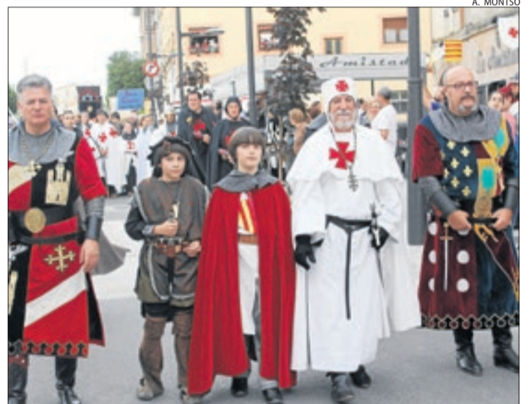
L'esdeveniment se centra en la figura del nen rei Jaume I, al segle XIII.

històric, la desfilada passa per davant de la catedral, i el sopar i concert de dissabte es traslladen a un envelat. Capítol a part mereix el mercat medieval, que creix fins a reunir noranta parades d'artesanía i alimentació. I s'elaboraran productes en directe.