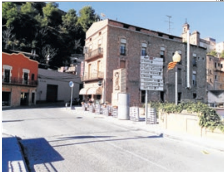
Imatge del pont de Sant Miquel a Balaguer.

El RACC proposa millorar la il·luminació i l'estat de les voreres i de les parades de transport públic. A més, recomana reduir l'amplada dels carrils, una actuació que alhora contribuiria a reduir la velocitat dels vehicles que circulen per aquesta via.