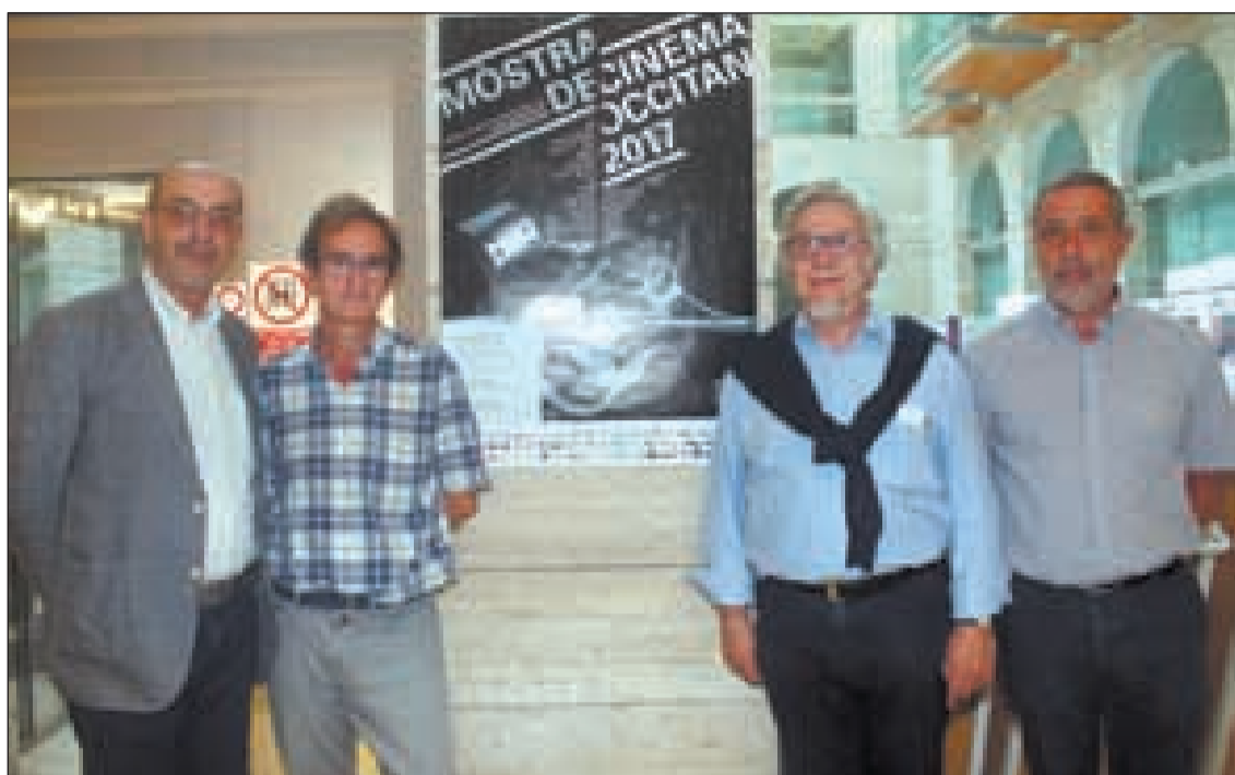
El documental 'Lo sol poder es que de dire' va inaugurar la mostra