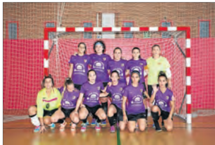
El sènior femení del Cervera Segarra va guanyar la Copa Lleida.