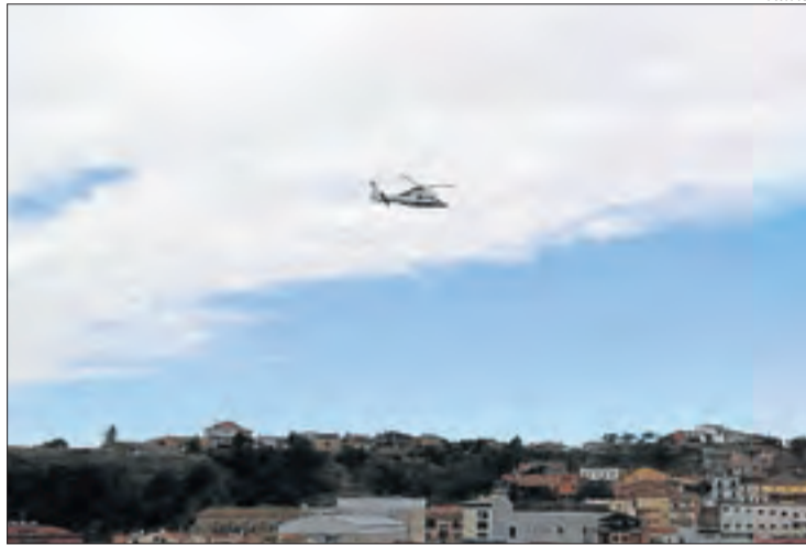
Un helicòpter de la Guàrdia Civil sobrevolant Balaguer.