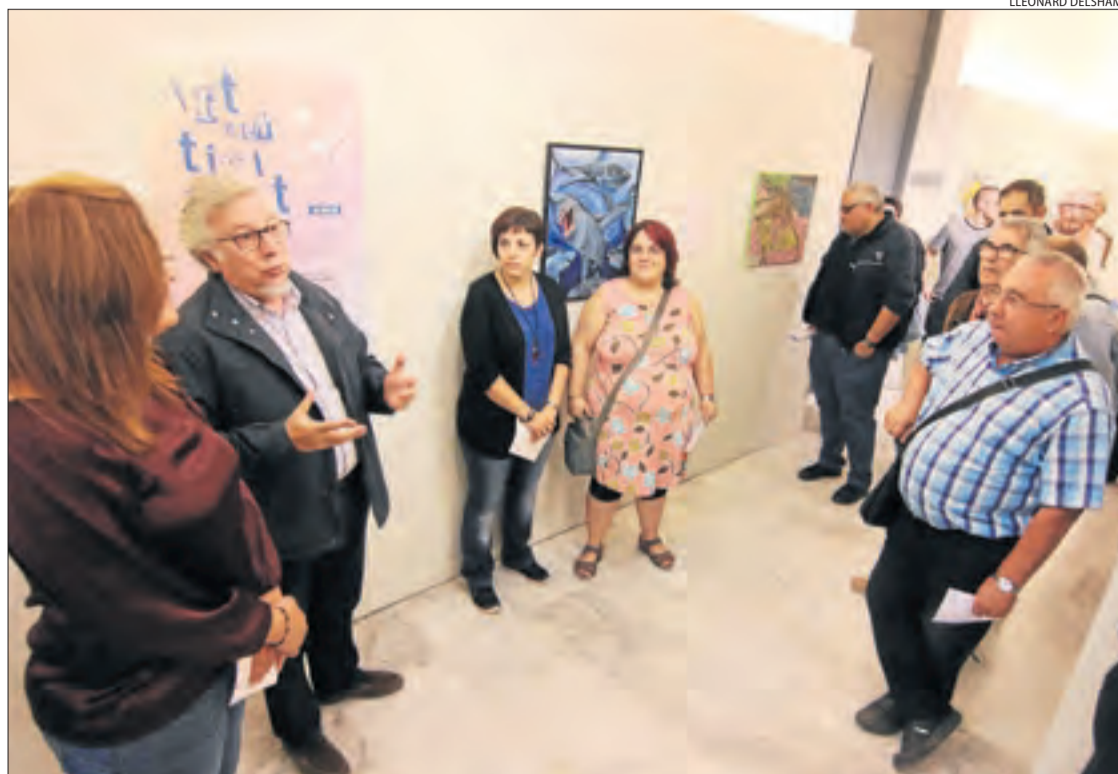
Un moment ahir de la inauguració de la mostra als serveis territorials de Cultura a Lleida.