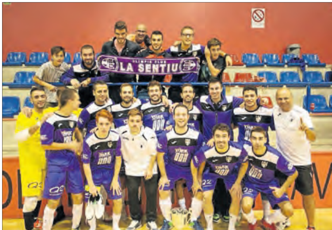
La Sentiu posa amb el trofeu de la Copa Lleida que van guanyar diumenge al Linyola de Segona B.