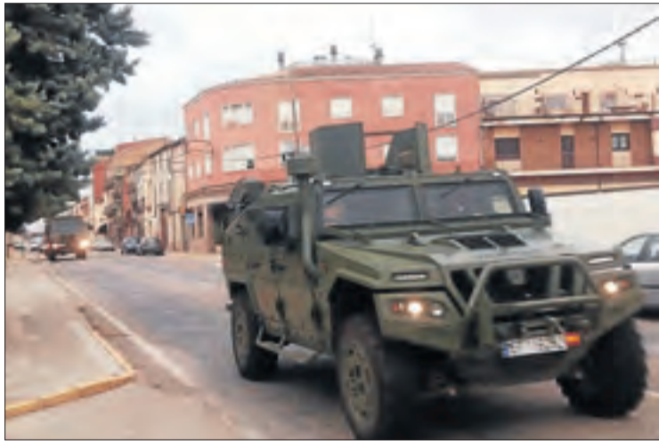
El comboi militar circulant per la Fuliola.

Un comboi militar circula pel centre de la Fuliola || D'altra banda, un helicòpter de la Guàrdia Civil sobrevola Balaguer, Lleida, Tàrraga, la Seu, Solsona i Tremp