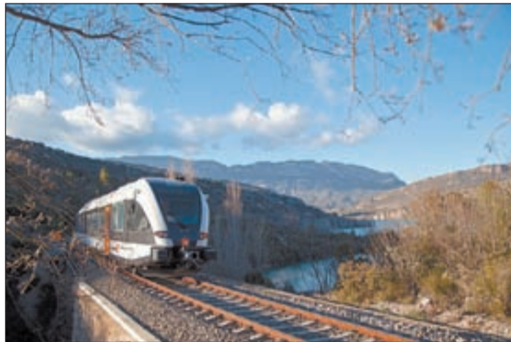
La línia disposa de dos trens nous de trinca

Aquests nous horaris seran possibles gràcies a la incorporació d'algunes estacions al sistema de parades facultatives, sota demanda de l'usuari. Així, Alcoletge, Sant Llorenç de Montgai, Àger