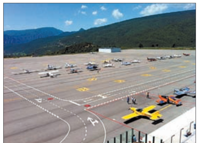
Imatge d'arxiu de l'aeroport d'Andorra-la Seu

d'un 535%. En termes globals, les operacions registrades a la infraestructura han estat 3.642 en tot el 2017, 56 més que al 2016, que es va tancar amb 3.586. L'increment es deu, entre d'altres, a l'augment de l'activitat d'aviació corporativa que desenvolupen les escoles de vol. L'aeroport, que es va posar en funcionament fa tres anys, està a l'espera de rebre la certificació d'AESA.