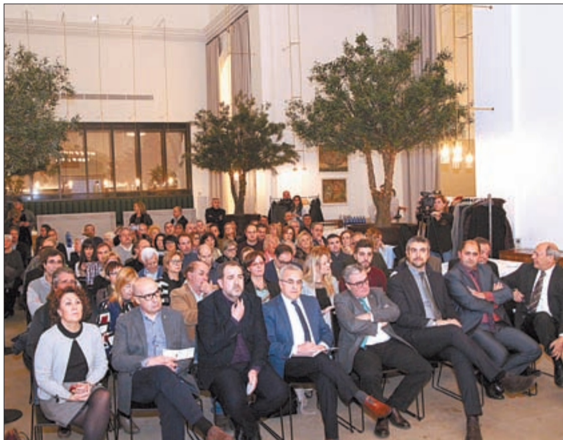
L'edició d'enguany de la Fira va ser presentada ahir al Parador Nacional de Lleida

Aquest diumenge de les deu del matí a les vuit vespre, la sala Sant Domènec de la Seu d'Urgell acollirà una jornada extraordinària de vendes amb descomptes sota el lema Shopping Rebaixes-Vine per passar un diumenge de rebaixes amb 20 establiments comercials.