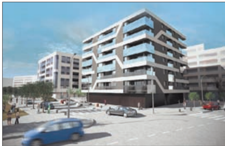
FOTO: / Imatge virtual d'un edifici que es construirà a la ciutat de Lleida

El preu de l'habitatge nou ha pujat un 9% a Catalunya durant el 2017, segons dades de l'Informe de Tendències del Sector Immobiliari de la Societat de Taxació. En el cas de Lleida, registra el valor mitjà més baix a Catalunya a nivell de capital de demarcació, d'1.315 euros/m 2 , i un increment moderat de l'1,4%, que és el major a nivell de demarcació. En aquest cas, es dona la paradoxa que, tot i que Lleida capital registra el major increment del preu, són altres municipis els que registren els preus més alts, al contrari del que succeeix a la resta de demarcacions catalanes. Concretament, les xifres mitjanes més altes es localitzen a Vielha (2.122 euros/m 2 ) i Sort (1.466 euros/m 2 ), mentre que Balaguer (986 euros/m 2 ) i Tremp (1.162 euros/m 2 ) són els que registren els valors mitjans més baixos. De fet, Balaguer és el municipi de Catalunya amb el preu més baix