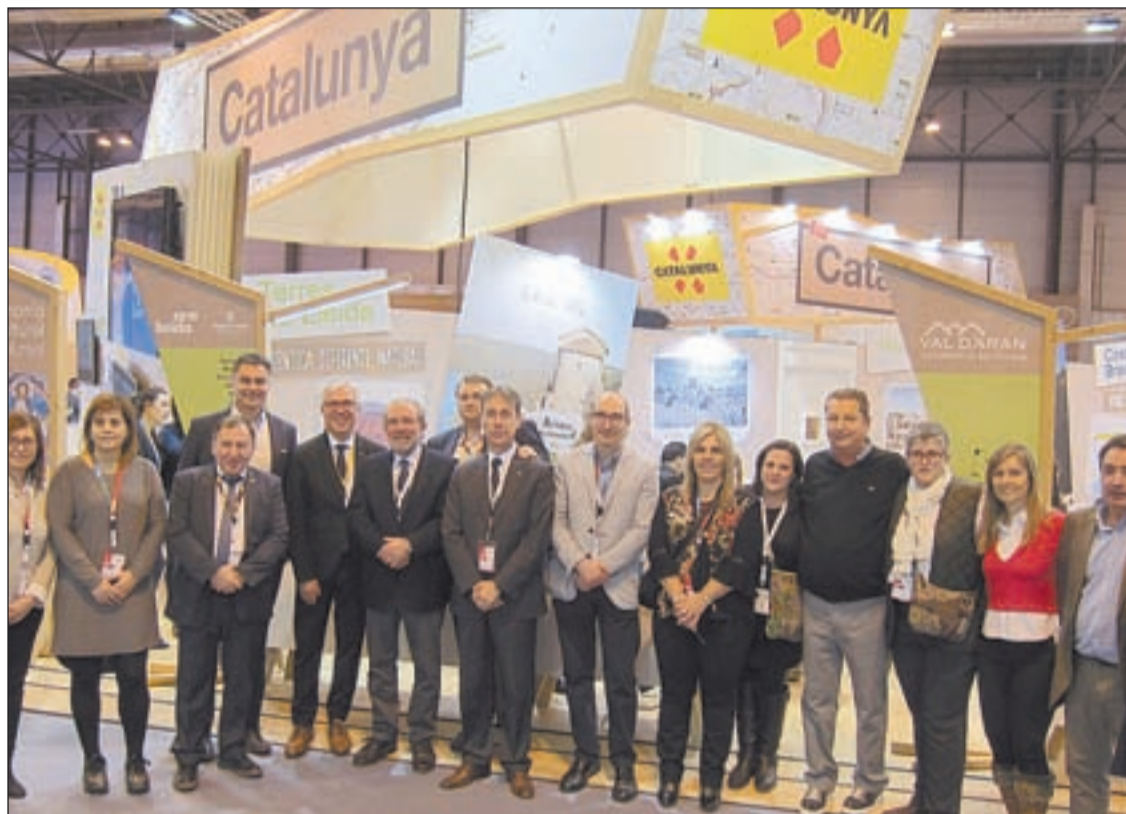
Els representants de la Diputació de Lleida, ahir a la inauguració de Fitur a Madrid

Altres propostes estan vinculades amb el Fruiturisme i la floració dels arbres a la zona del Baix Segre, a més d'altres productes impulsats pel Patronat de Turis-