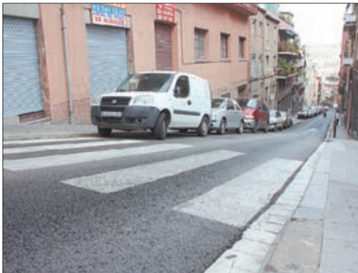
La velocitat permesa dins del municipi és de 50 km/h

van detectar al llarg de la jornada només seran multats aquells conductors que superaven per més de 20 km/h la velocitat permesa. Per tant, els que conduïen sobrepasant els 70 km/h, que són 240 conductors. D'aquests, 200 viatjaven a una velocitat d'entre 70 i 80 km/h, 30 conductors ho feien