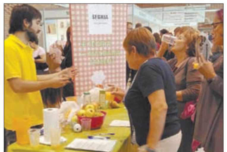
Durant un taller sobre el malbaratament alimentari

Els propers tallers són el 20 de gener als municipis de els Alalmús, al poliesportiu de 11 a 14 h, i a Puigverd de Lleida, de 17 h