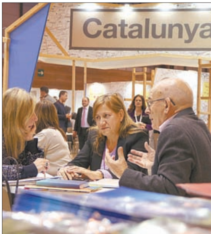
Fitur és una fira de referència en el món del turisme

El president de la Diputació també es va referir a l'oferta enoturística de les comarques de Lleida "com un nou atractiu turístic" gràcies al maridatge de la gastronomia i l'enologia, que permet al visitant fer un passeig per la gastronomia, la cultura i la geografia lleidatanes i conèixer els principals atractius paisatgístics de cada zona seguint el fil conductor dels cellers del territori".