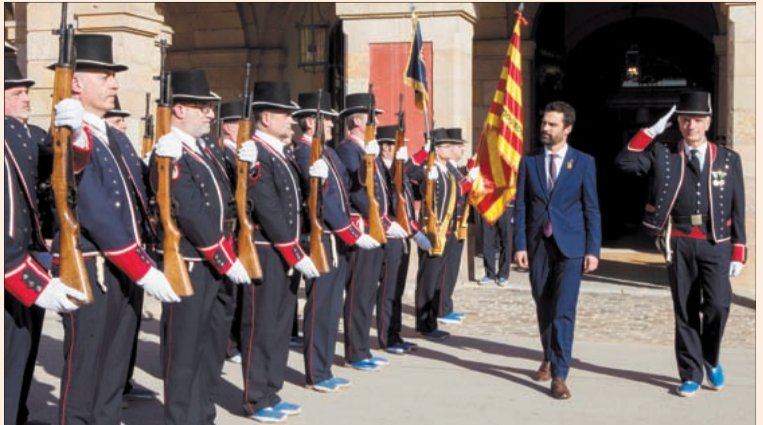
El flamante president del Parlament, Roger Torrent, pasó revista a los Mossos de gala al finalizar la sesión constitutiva

Sijena y la juez envían al director de Patrimoni ante Fiscalía