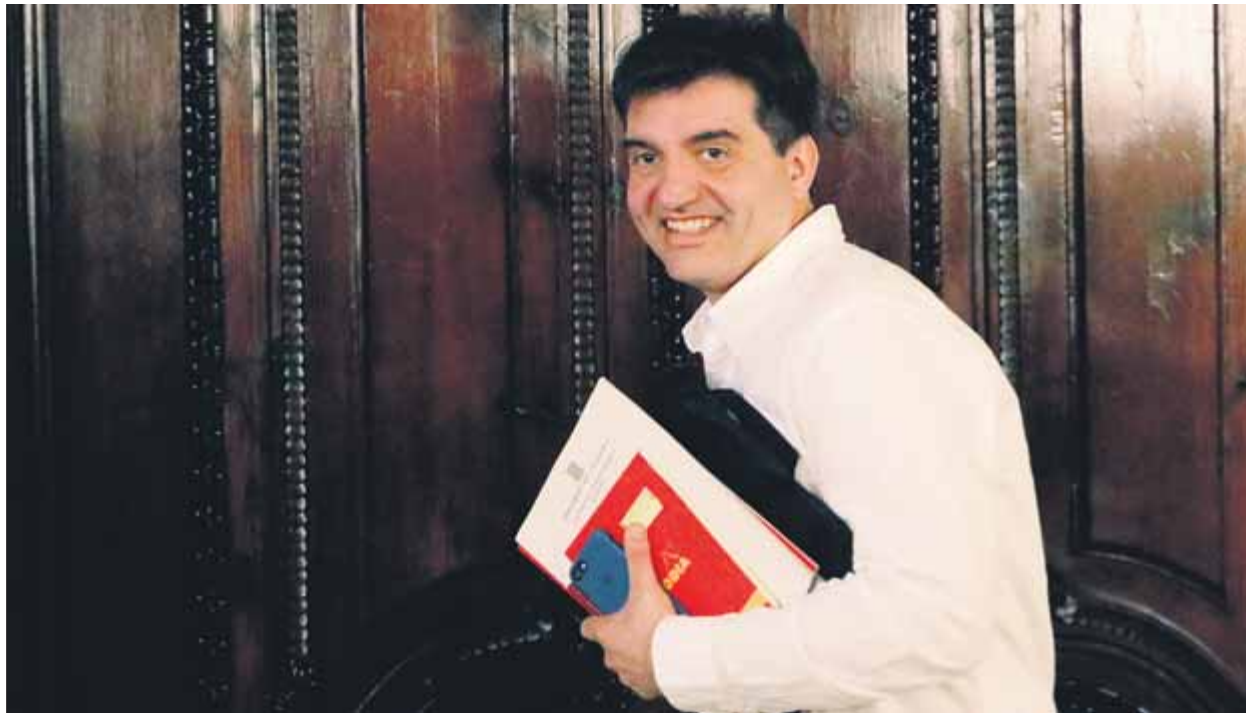
El portaveu d'ERC, Sergi Sabrià, al Parlament la setmana passada, quan van començar les converses formals amb JxCat

Segons el portaveu, caldrà trobar una solució per a la presidència de la Generalitat i la del Parlament –Carme Forcadell encara no ha decidit si aspira a repetir– “al mateix temps i de manera discreta”. En la mateixa línia, fonts de JxCat a la tarda asseguraven que mantenen “contacte permanent” amb ERC i la CUP, “a Barcelona i a Brussel·les”, i que les converses seguiran en els pròxims dies per elegir la Mesa i investir Puigdemont. Així, instaven el govern de l'Estat a