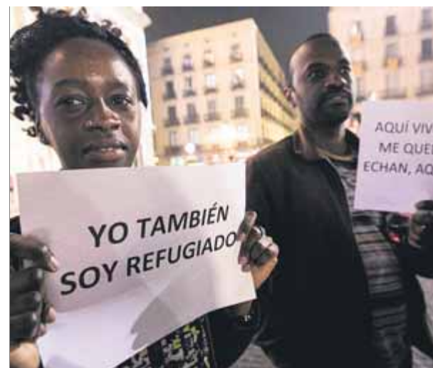
Protesta en favor dels immigrants, a Barcelona ■ A. SALAMÉ

Per demarcacions, Barcelona, amb 211 denúncies relacionades amb els delictes d'odi, se situa al capdavant, seguida per Madrid, amb 171 casos. Un dels motius és que a la fiscalia de Barcelona hi ha el servei de delictes d'odi i discriminació, encapçalat pel fiscal Miguel Ángel Aguilar, pioner a tot l'Estat a perseguir-ho i a assolir condemnes pel delicte de lesió de la dignitat de les