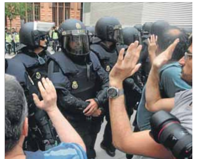
Antiavalots de la Policia Nacional desplegats en un institut de Tarragona durant el referèndum de l'1-O

cions” del ministeri a Catalunya pel referèndum, Inarritu li demana informació sobre l'operació policial de mesos. En canvi, el PSOE limita l'explicació a l'actuació específica dels cossos i forces de seguretat de l'Estat l'1 d'octubre a Catalunya, en què hi va haver un miler de ferits per càrregues policials. ■