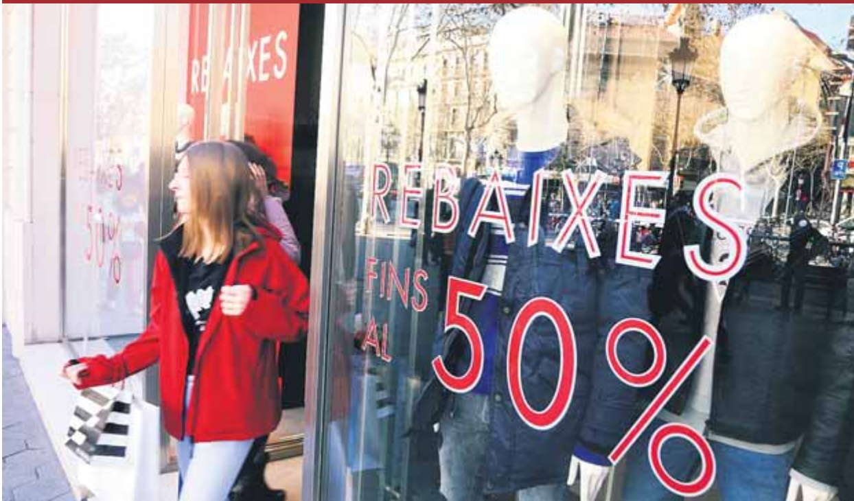
Una clienta abandona una de les botigues que ahir ja anunciaven les rebaixes al centre de Barcelona