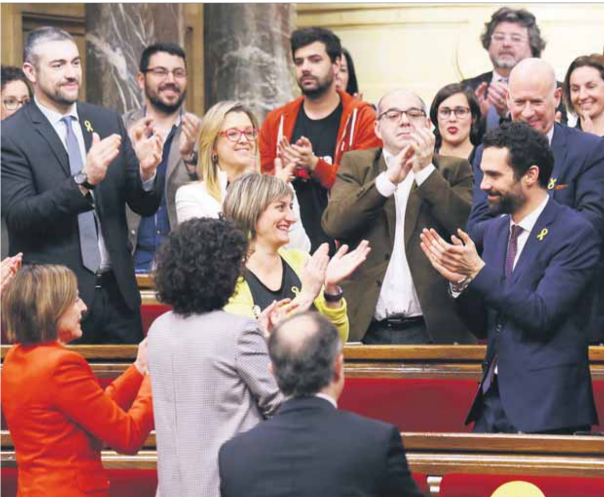
Roger Torrent és aplaudit pels diputats d'ERC i JxCat en ser escollit president del Parlament

INICI • Roger Torrent, elegit president del Parlament en una sessió marcada per l'absència dels diputats exiliats i presos