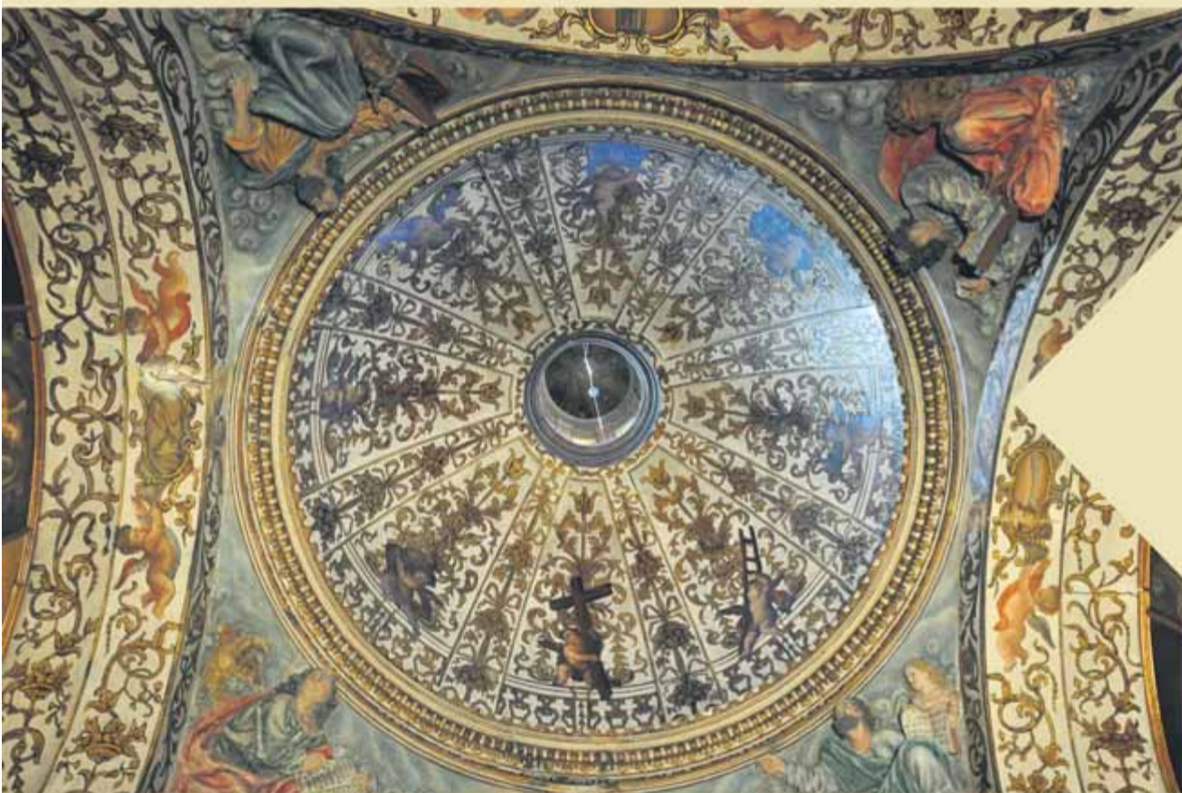
La Capella del Sant Crist destaca per les pintures murals i a l'oli de l'època barroca

Capella del Sant Crist Cal Cadernal, casa pairal de la família Nin. Per finalitzar la visita tast de vi i oli de la cooperativa