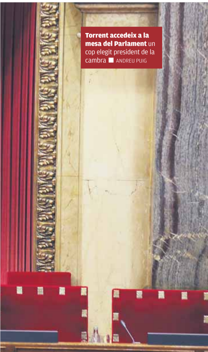
Torrent accedeix a la mesa del Parlament un cop elegit president de la cambra