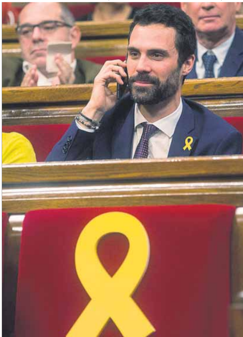
Torrent parlant per telèfon amb Puigdemont. Al costat, felicitat per Forcadell. A sota, Elsa Artadi celebrant la inauguració de la legislatura