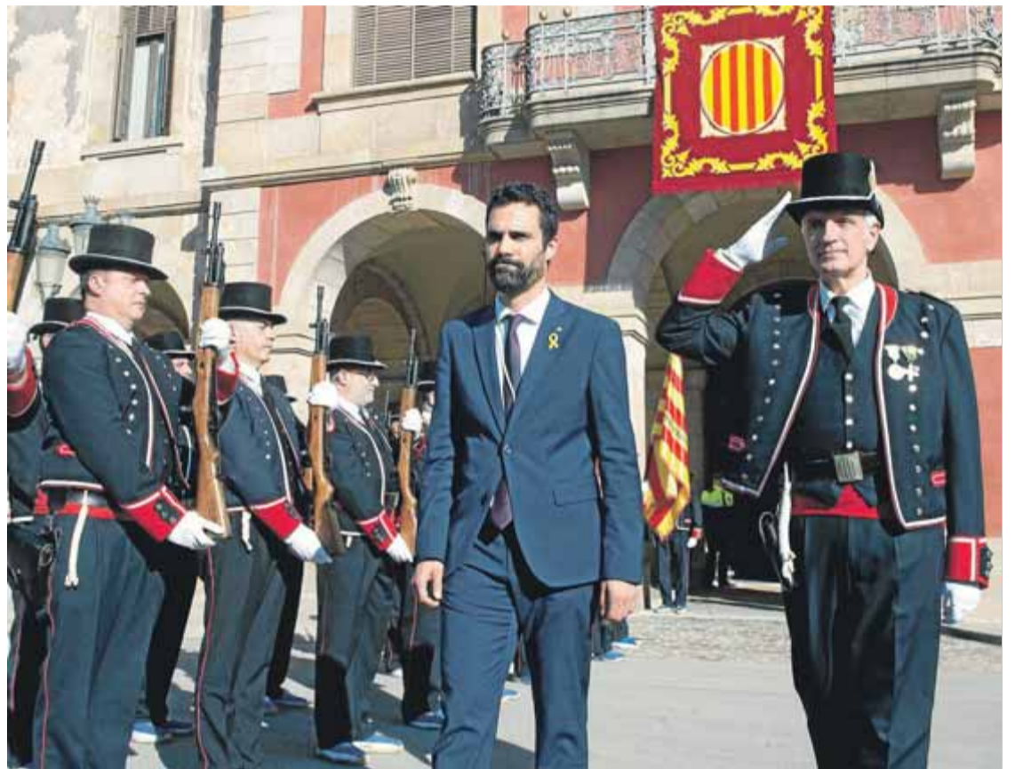
La guàrdia d'honor dels Mossos rebent el nou president, Roger Torrent

Ens correspon restituir, enfortir també i preservar la sobirania del Parlament. No només per una obligació històrica, de continuïtat