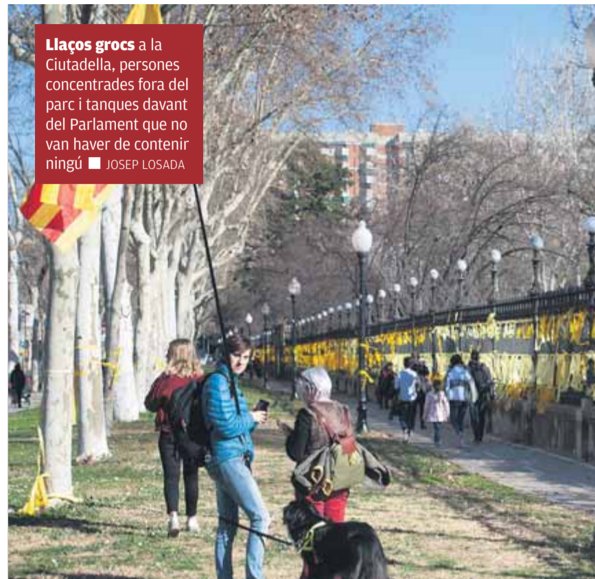
Llaços grocs a la Ciutadella, persones concentrades fora del parc i tanques davant del Parlament que no van haver de contenir ningú

El groc és el color que domina en la concentració de partidaris de la independència que s'han citat a la part baixa del passeig de Lluís Companys. En són un