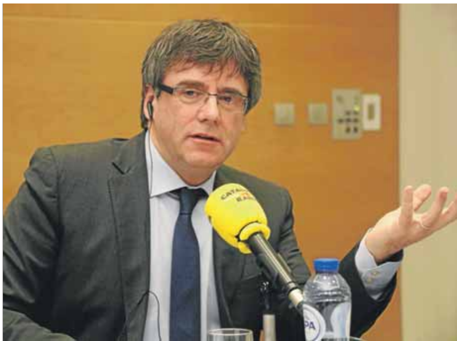
El president de la Generalitat, Carles Puigdemont, entrevistat des de Brussel·les

Segons la seva opinió, el reglament de la cambra no impedeix que pugui ser investit des de Brussel·les, ja sigui de manera telemàtica o per delegació i, per tant, no hi hauria d'haver cap problema. La Moncloa, però, ja ha assegurat que no ho permetrà i és possible que el rei tampoc signi la investidura. “No té cap dret a subvertir el mandat legal”, va afirmar. Puigdemont va recordar que el missatge que els catalans van donar el 21-D, amb la victòria de l'independen-