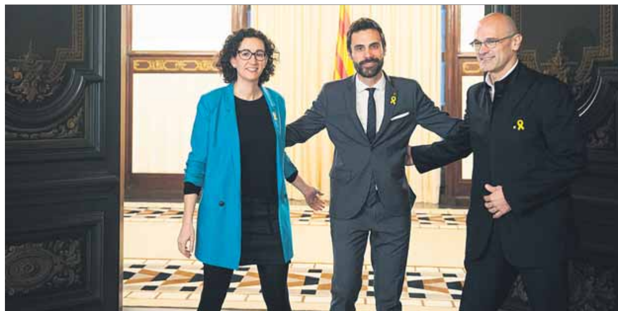
El president del Parlament, Roger Torrent, amb els diputats d'ERC Marta Rovira i Raül Romeva