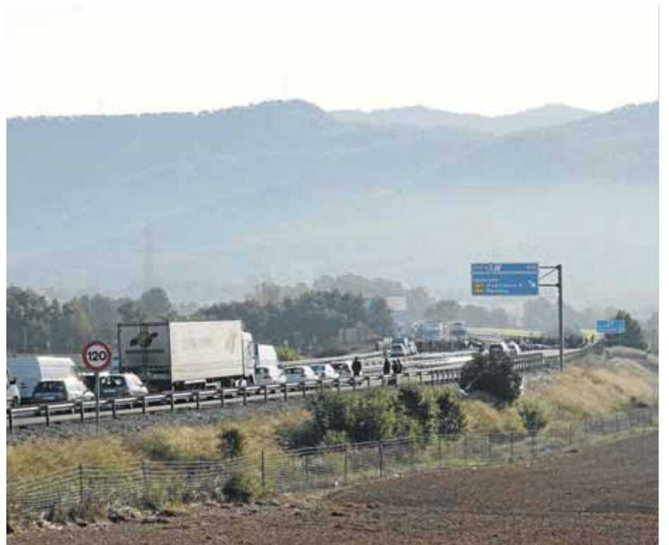
Les cues que hi va haver a l'A-2 a l'altura d'Òdena per la protesta del 8-N

El Comitè de Defensa de la República (CDR) d'Igualada, la Conca d'Òdena i el Bruc va assegurar ahir a través d'un comunicat a Twitter que, tot i que encara desconeixen “amb