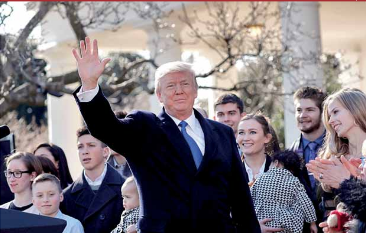
El president Trump després del seu discurs d'ahir a Washington