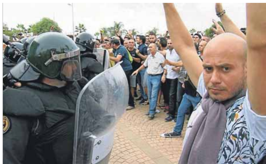
Antiavalots a la Ràpita davant dels votants amb els braços enlaire

El jutjat d'Amposta també ha reclamat informació sobre el dispositiu policial de l'1-O, a més de les instruccions que es van donar als agents de la Guàrdia Civil que hi van participar. De les 84 persones que van resultar feri-