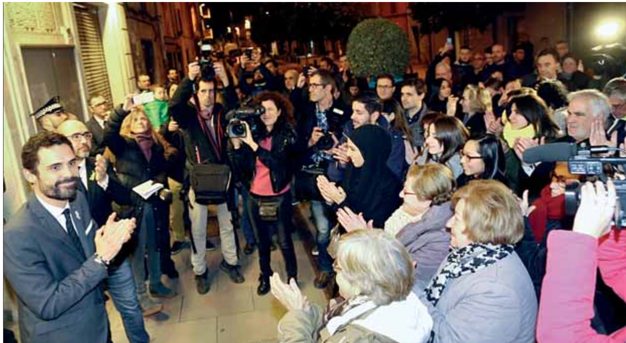
El president del Parlament quan sortia del consistori de Sarrià de Ter, rebut amb aplaudiments pels sarrianeus

ser per recordar la seva vida política municipal. Una vida que va començar fa divuit anys, quan tot just tenia dinou anys, com a regidor del municipi. Va assegurar que vol portar al Parlament "el mateix clima de respecte i diàleg que tenim a Sarrià".