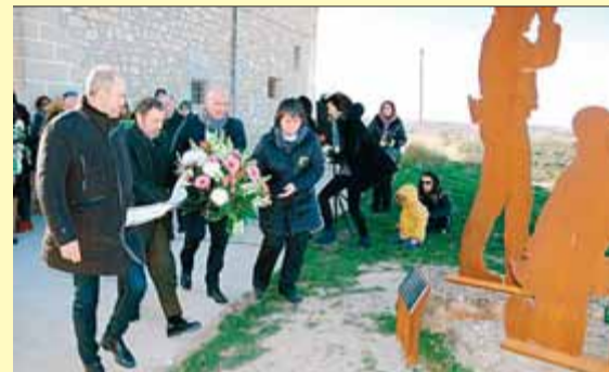
Càrrecs d’Agricultura, en l’homenatge