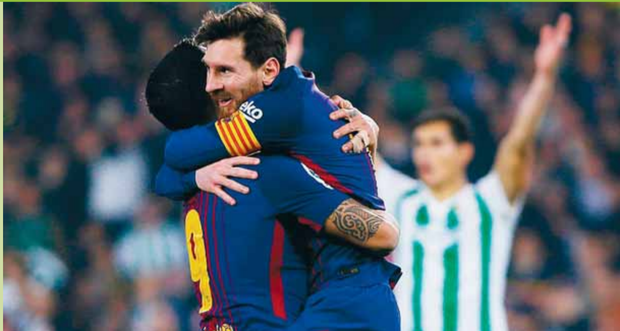
Messi i Suárez celebren un dels gols d’anit. Entre els dos en van fer quatre