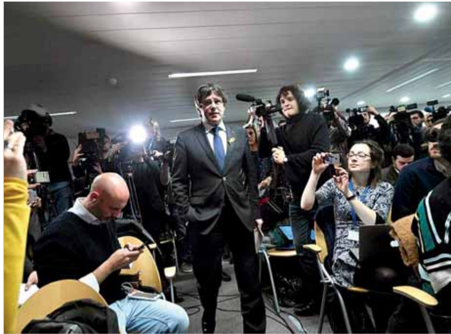
Carles Puigdemont, en una roda de premsa a Brussel·les l'endemà de les eleccions

L'advocat de Puigdemont, Jaume Alonso-Cue-