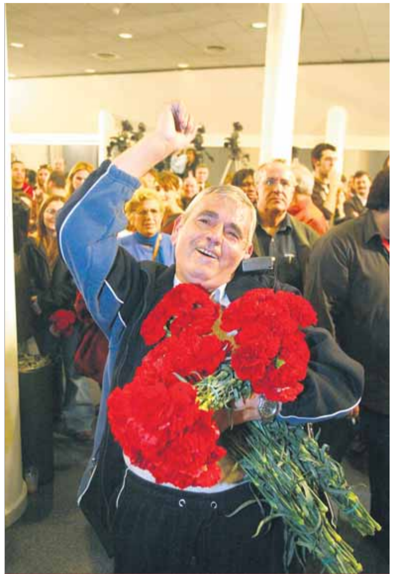
La seu de Nicaragua, el míting del 1976 que apuntava al congrés constituent, el relleu de Maragall per Montilla i un militant celebrant la victòria de Zapatero del 2004