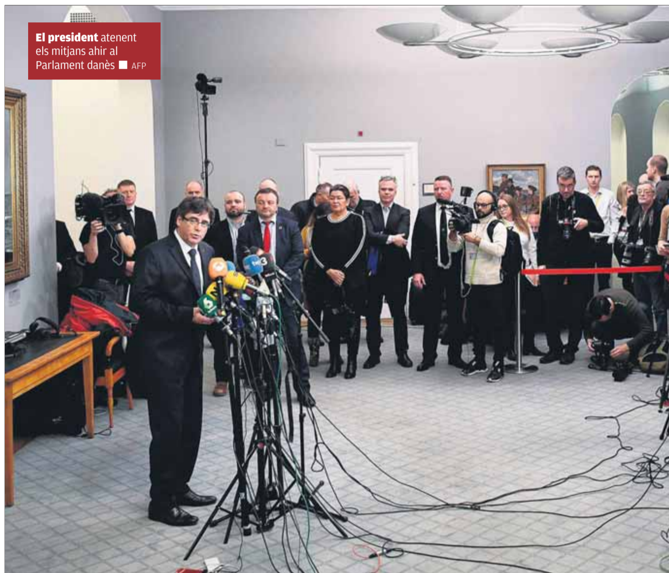
El president atenent els mitjans ahir al Parlament danès

Pel que fa la reunió amb nous diputats danesos de cinc grups diferents, Puig-