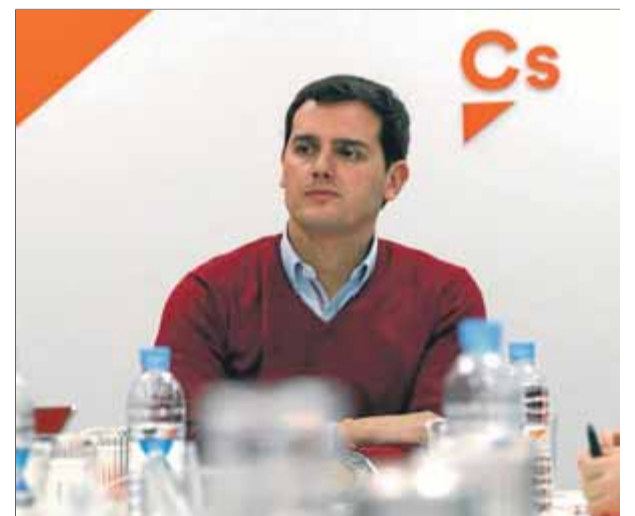
Albert Rivera, líder de Ciutadans, vol que el Congrés obri una comissió d’investigació pels atemptats del 17-A

Si bé Ciutadans situa el focus en les preteses alertes haurien pogut rebre els Mossos d’Esquadra, Rivera va descobrir un aliat inesperat, ERC, que té la intenció de votar-hi a favor si la comissió d’investigació serveix per indagar en el lligam del CNI amb el seu confident i imam de Ri-poll. ■