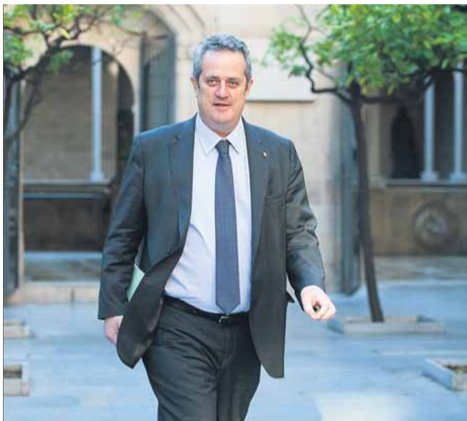
Joaquim Forn, al Palau de la Generalitat, el 24 d'octubre passat

La decisió arribava hores després que la fiscalia del Suprem informés que s'oposarà a concedir la llibertat provisional a Forn i al diputat i expresident de l'ANC, Jordi Sánchez, sol·licitada pels seus advocats fa dues setmanes. En un escair comunicat, la fiscalia raona que "cal mantenir la presó provisional" de tots dos perquè cal veure durant la instrucció "si persisteixen els indicis racionals que els investigats van cometre els fets delictius i els motius suficients que van justificar aquesta mesura cautelar". A més, hi afegeix, com marca el Tribunal Europeu de Drets Humans, els imputats tenen dret "a ser jutjats en un termini raonable" i a ser posats en llibertat quan ho