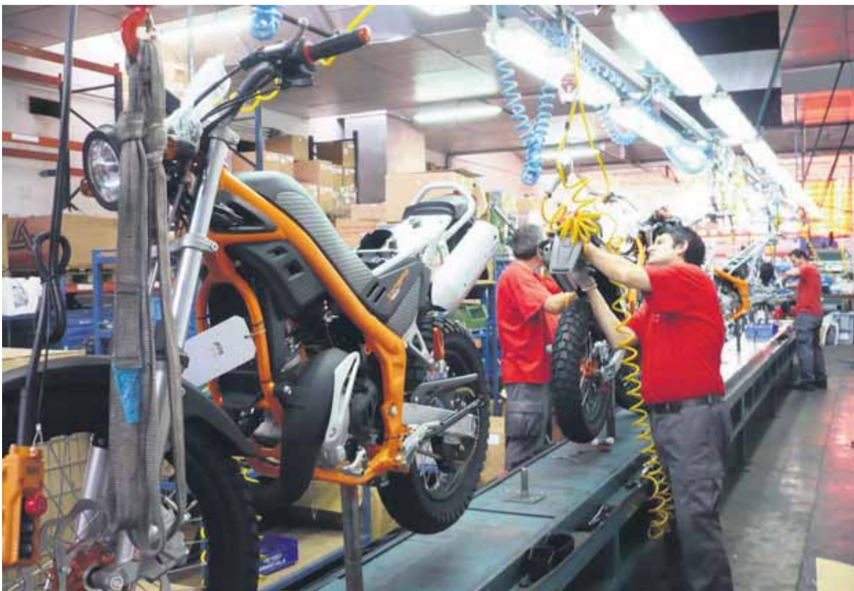
Un 57% de les pimes industrials van augmentar les seves exportacions l'any passat