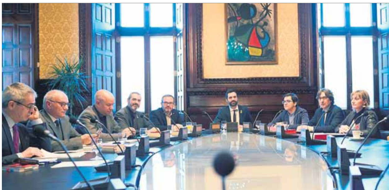
Reunió de la mesa del Parlament, que ahir havia de tractar la delegació de vot dels electes a Brussel·les