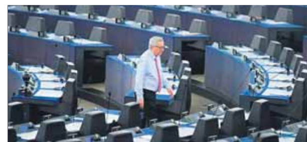
El Parlament Europeu ha rebutjat el debat sobre Catalunya. A la foto, el president de la CE, Jean-Claude Juncker