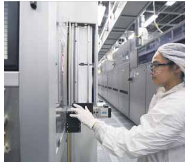
La indústria catalana ha continuat creixent el 2017

En el segon bloc tenim els profetes de l'apocalipsi, que han emprès una campanya amb intencionalitat política. Són instàncies amb pretensions de seriositat (Foment del