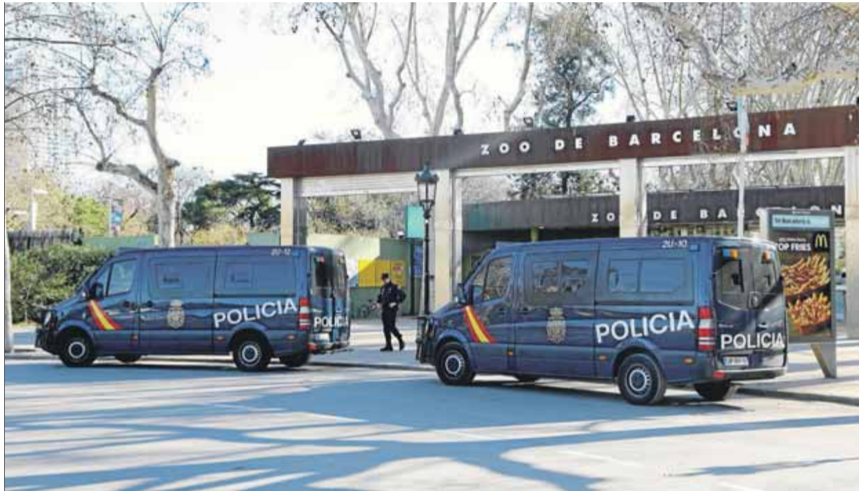
Furgonetes de la Policia Nacional vigilen a tothora l’entrada al Parlament des de fa dies ■ ANDREU PUIG

L’Estat espanyol ja viu sota un estricte control fronterer derivat del nivell quatre –sobre cinc– de l’alerta antiterrorista, que va ser ratificat i reforçat a l’agost després dels atemptats de la Rambla i Cambrils. Entrevistat a Antena 3, però, Zoido va confessar que Interior i el govern es-