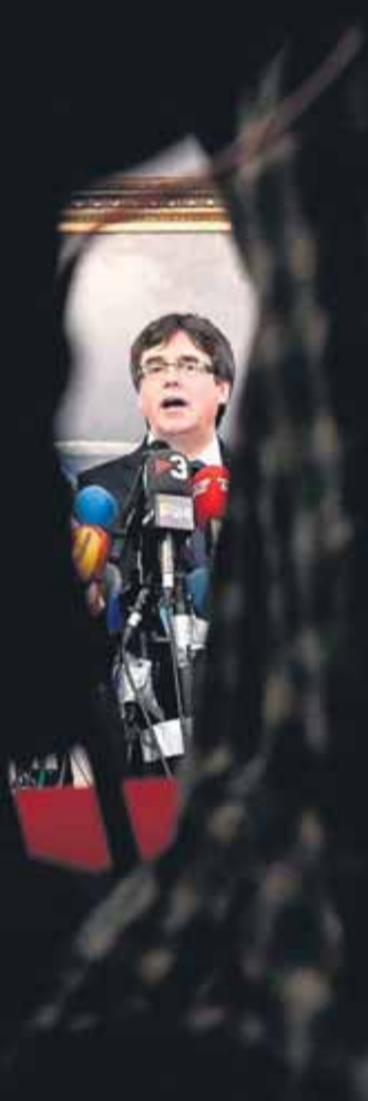
El president Puigdemont atén la premsa després de reunir-se amb diversos diputats danesos

OPERACIÓ PUIGDEMONT • Zoido revela un dispositiu policial per evitar el retorn del president “en ultralleuger, en vaixell o al maleter d’un cotxe” PAS • Puigdemont es planteja assistir al ple d’investidura si es garanteix que no serà detingut