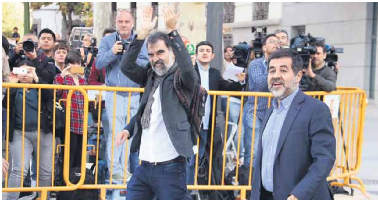
Jordi Sánchez i Jordi Cuixart, el dia que van anar a declarar a l'Audiència Nacional

Al marge d'aquesta circumstància, Llarena també ha pres la decisió de deixar l'exmajor del cos de Mossos d'Esquadra, Josep Lluís Trapero, en mans de la jutgessa Carmen Lamela a l'Audiència Nacional.