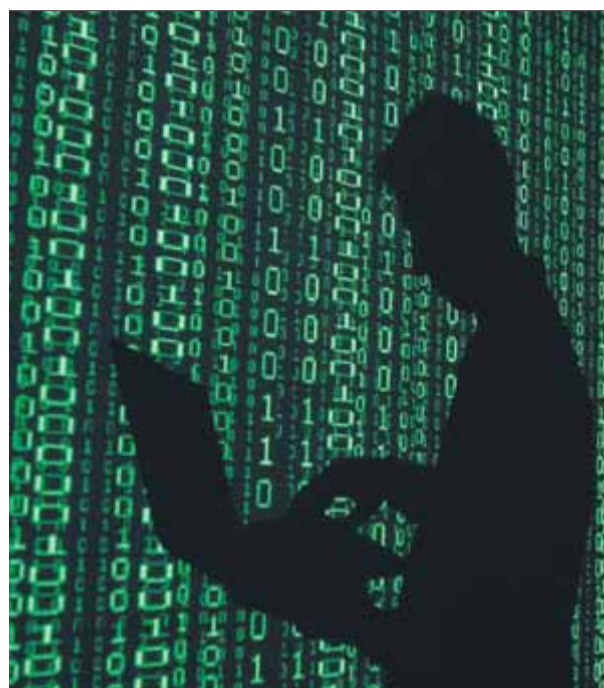
La creació d’infraestructures digitals de la mà de la ciutadania serà una de les línies del nou govern

ons d’engegar la maquinària per començar a recórrer el camí cap a la república al núvol, que requeriria la complicitat i la participació de la ciutadania per prosperar. ▣