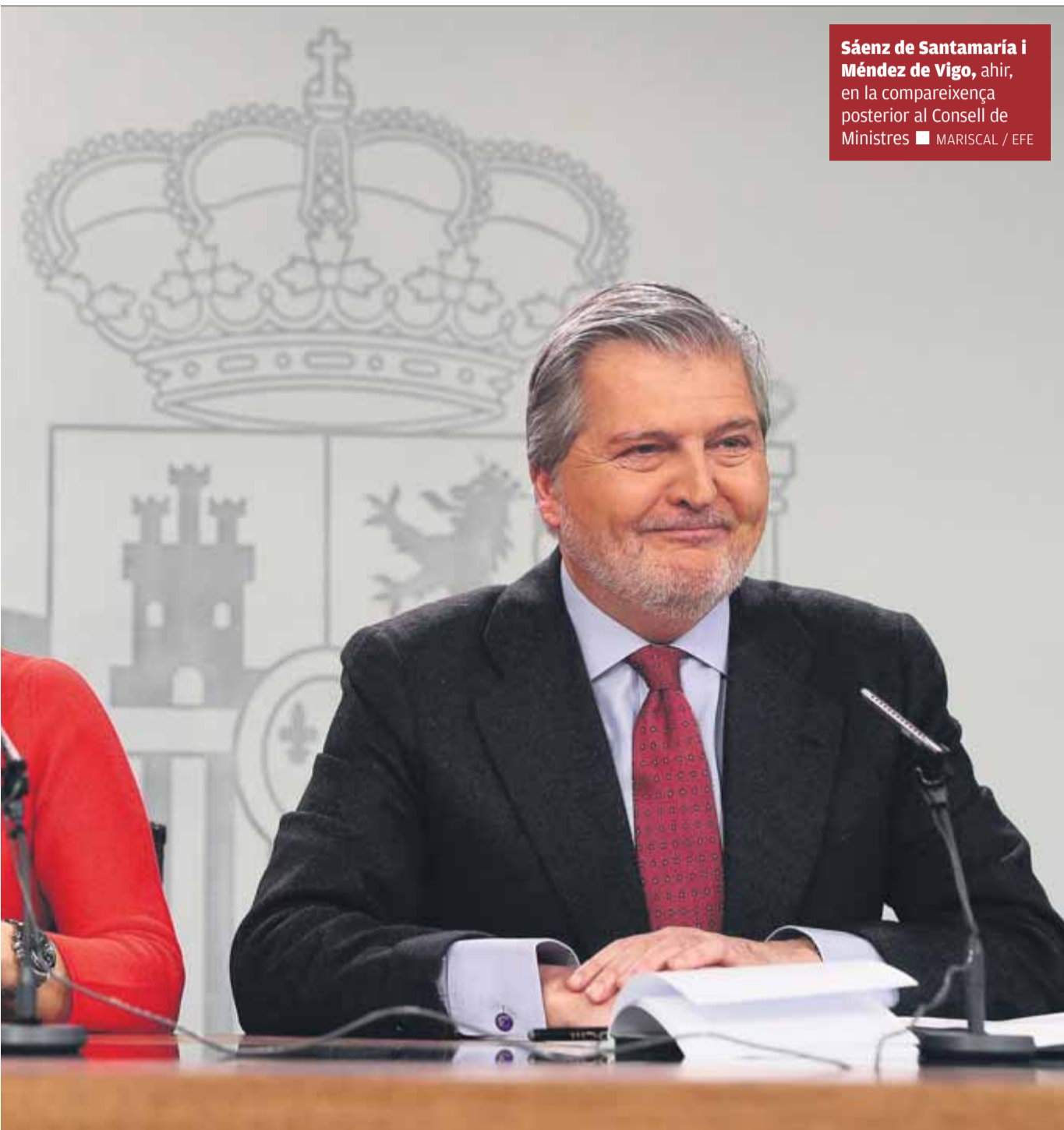
Sáenz de Santamaría i Méndez de Vigo, ahir, en la compareixença posterior al Consell de Ministres