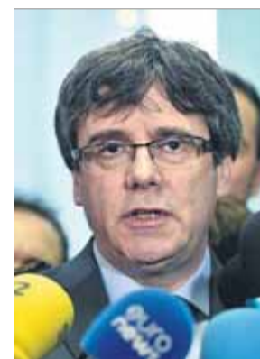
Puigdemont, atenent els mitjans a Dinamarca

D'altra banda, el 3 de desembre, quan ja s'havia decretat presó provisional per al vicepresident Jun-