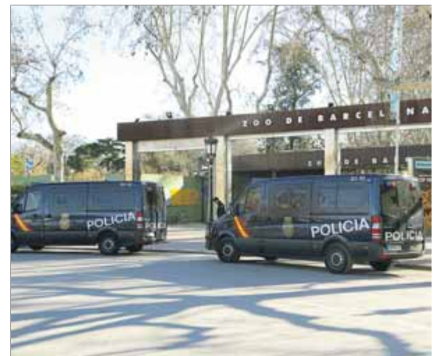
Furgonetes de la Policia Nacional dilluns passat davant del zoològic ■ ANDREU PUIG

un centre esportiu. Arran d'aquesta situació, Torrent demana a Zoido que expliqui urgentment les causes d'aquesta operació i que garanteixi que els agents no pertorbaran el "normal funcionament" de la institució. El ministre va assegurar ahir que quan rebí la missiva la contestarà immediatament. ■