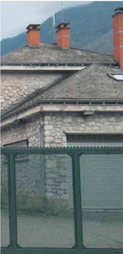
A dalt, un agent de la policia espanyola escorcolla el maleter d'un vehicle. A baix, el punt fronterer de Pont de Rei, a la Val d'Aran, en desús des dels acords de lliure circulació de la Unió Europea. Tot i això, la Guàrdia Civil va muntar dijous un control uns centenars de metres més enllà, a l'entrada del poble de Les.

baix polític i social. Al llarg dels 250 km entre la Val d'Aran i el cap de Creus hi ha infinitat de passos en terrenys escarpats, molt poc habitats, de vigilància difícil, i amb tres estats implicats (l'espanyol, el francès i l'andorrà). Amb la dictadura de Primo de Rivera, Francesc Macià va intentar una invasió militar amb dues columnes d'Estat Català des de Prats de Molló a través del coll d'Ares i Sant Llorenç de Cerdans. Amb l'esclat de la Guerra Civil espanyola, l'any