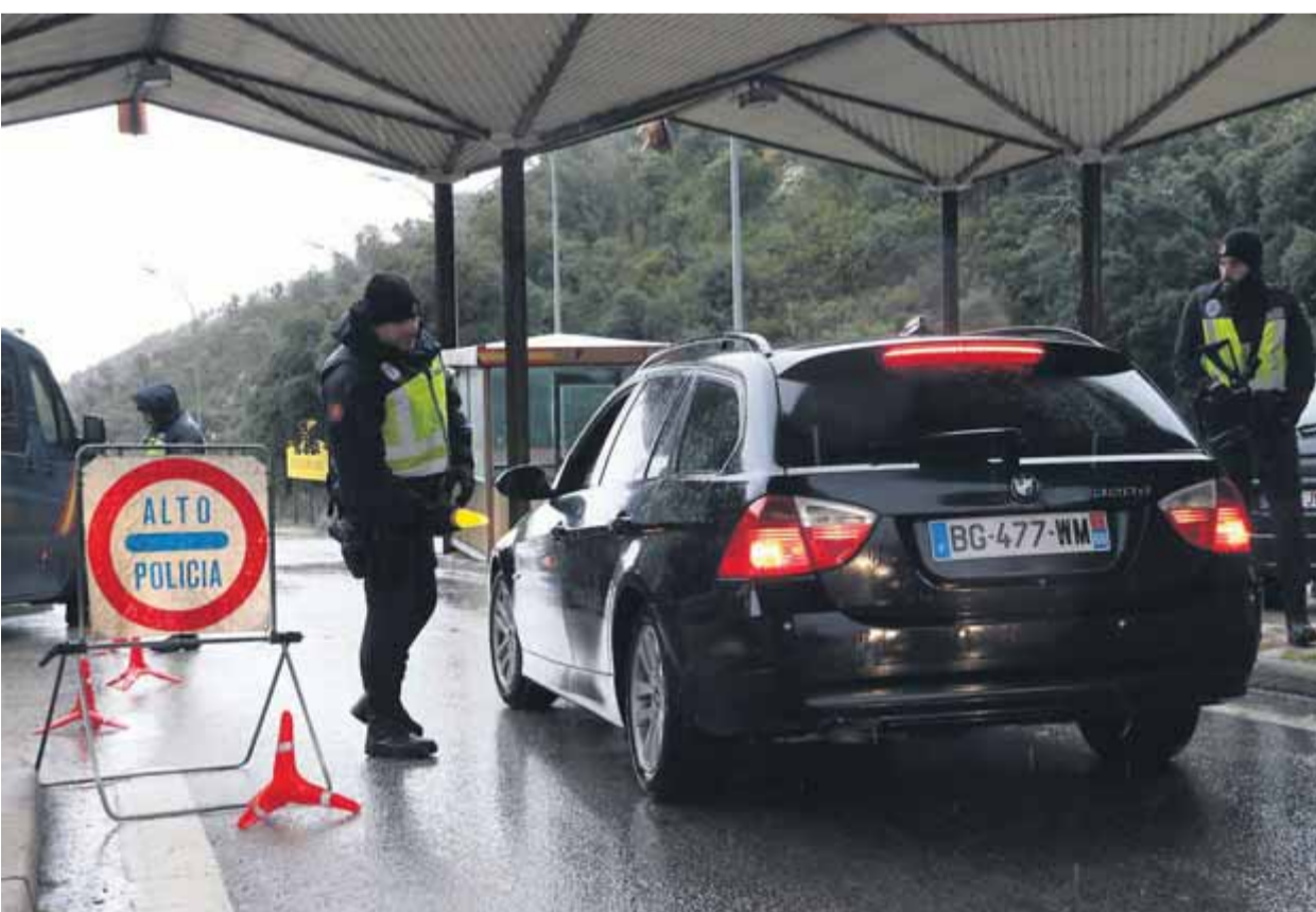
Efectius de la policia espanyola aturant un vehicle al punt de control establert al Pertús

LLARG • Després de 6 hores de debat, els magistrats fan cas del Consell d'Estat però avalen les intencions del govern espanyol