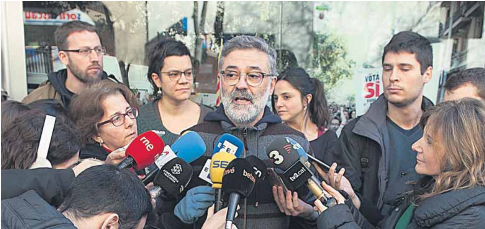
La CUP va celebrar ahir el consell polític, juntament amb el Grup d'Acció Parlamentària, per decidir sobre la investidura de Puigdemont ■ JOSEP LOSADA

Defensa que la figura del president és la que millor representa el xoc amb l'Estat, però no aclareix si votarà a favor de la investidura ■ Condiciona el seu vot afirmatiu a l'assoliment d'acords programàtics