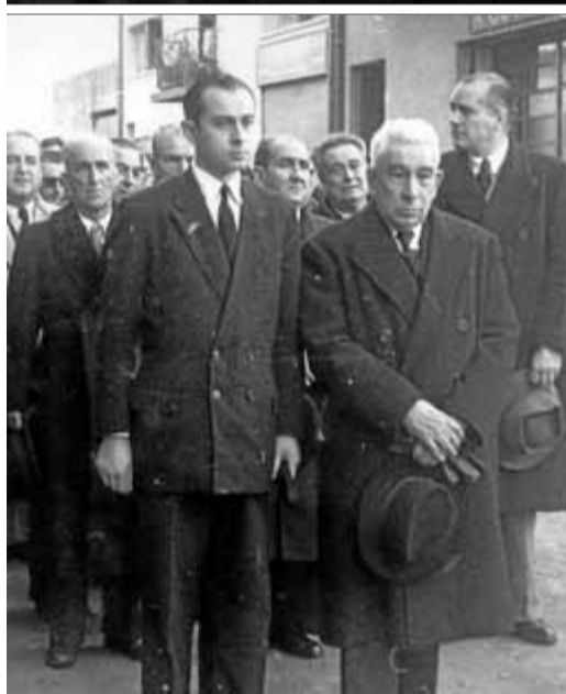
A dalt a l'esquerra, Enric Prat de la Riba. Al costat, Companys empresonat pels fets d'Octubre. A sota, Irla, a l'exili, i, darrere seu, Tarradellas. I Mas, durant el judici del 9-N