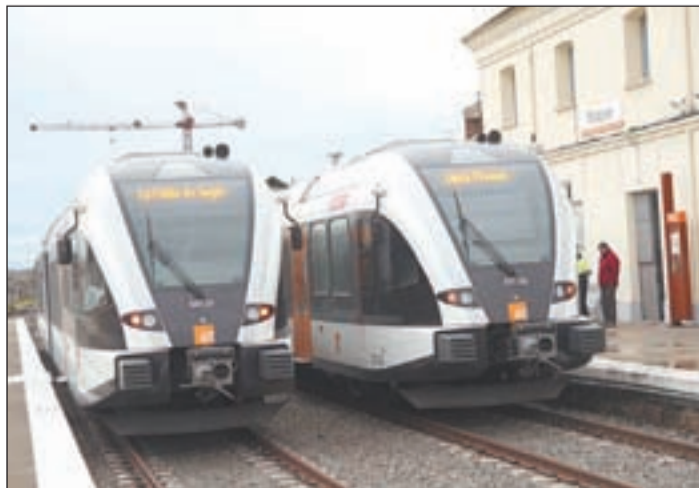
Imatge dels dos trens que presten servei a la línia

El gener d'enguany van entrar en vigor nous horaris a la línia de la Pobla per optimitzar encara més les connexions amb els trens Avant, que enllacen Lleida amb Barcelona. Aquests nous horaris permeten reduir fins a 8 minuts el temps de viatge entre les estacions de la Pobla de Segur i Lleida.