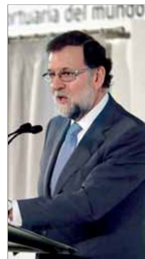
Rajoy, ahir en un acte a Elx

L'associació recorda que l'informe anual de la UE ha assenyalat l'Estat com el tercer país on un percentatge més elevat de persones creuen que la justícia no és independent