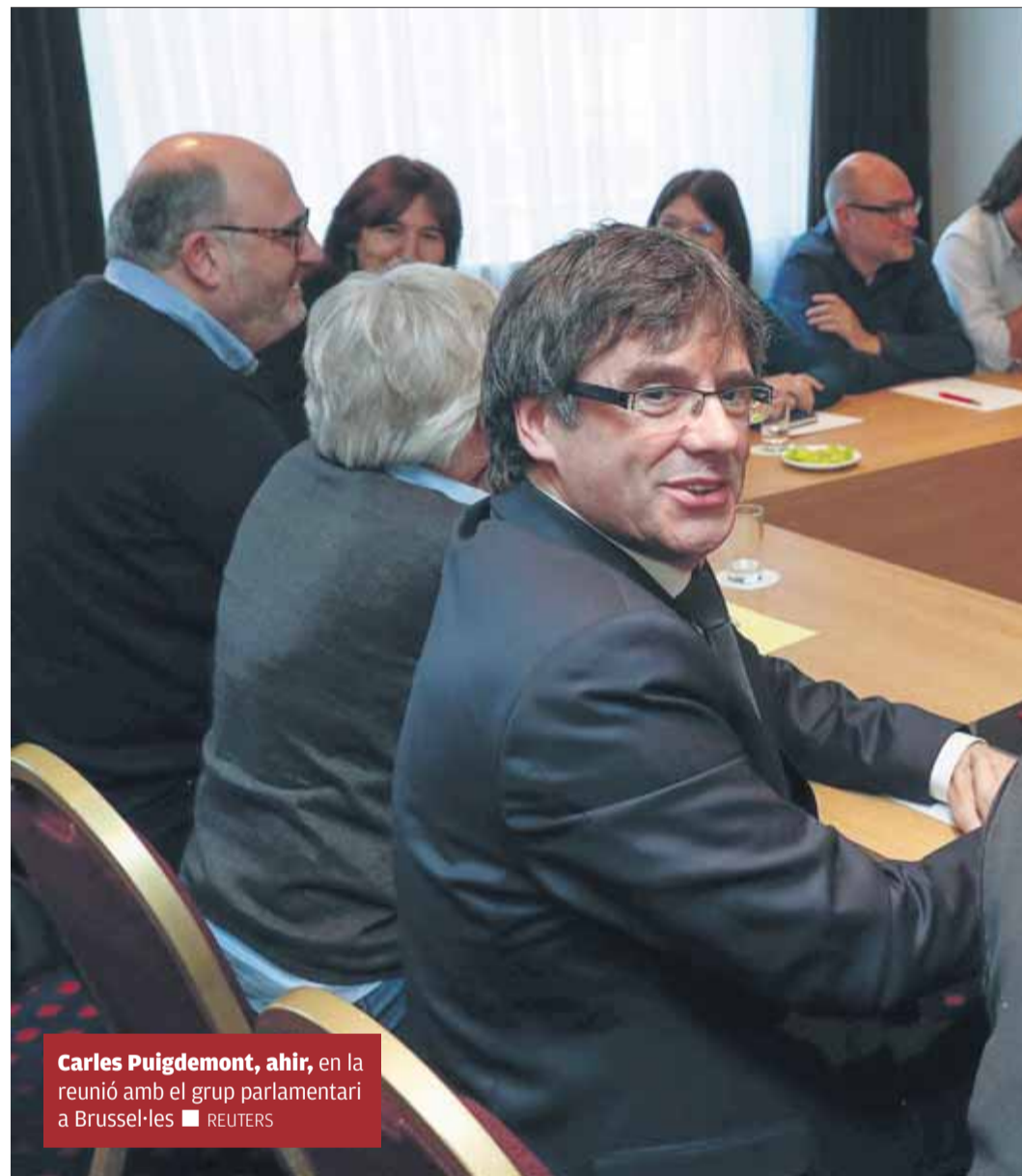
Carles Puigdemont, ahir, en la reunió amb el grup parlamentari a Brussel·les

“Estem avançant cap a l'acord”, va indicar unes hores abans Eduard Pujol,