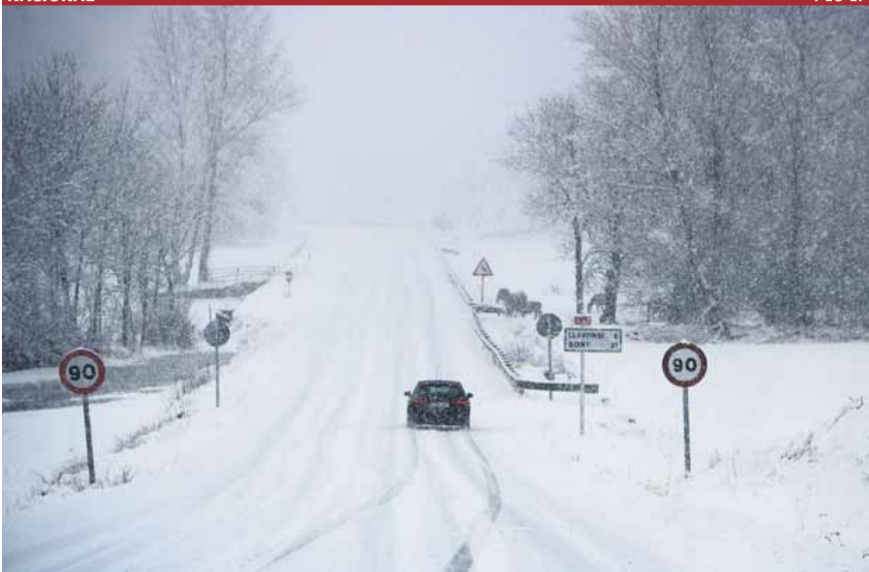
Un cotxe circulant per la C-13, a l'altura d'Escaló, al Pallars Sobirà, ahir al matí