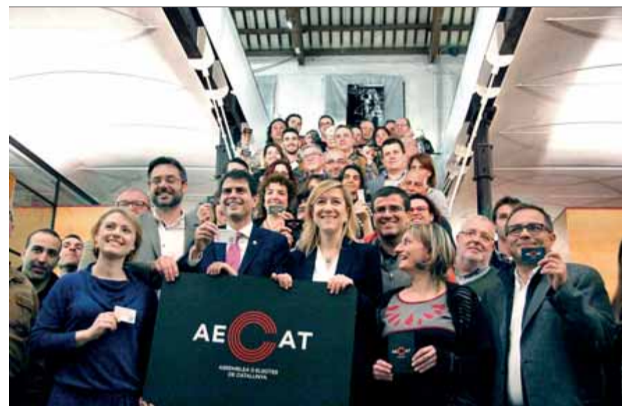
Membres de l'Aecat mostrant el carnet d'adherit el març passat a Igualada

AECAT • Pren cos la primera missió de l'assemblea de càrrecs elegits: desllorigar la investidura INSCRITS • El fòrum acumula més de 4.000 adhesions de regidors i diputats