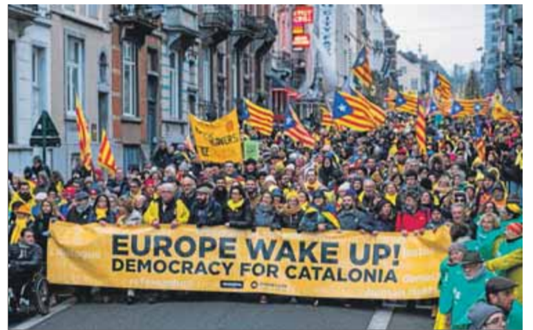
Puigdemont i els quatre consellers que són a l'exili. A la foto de dalt, la primera roda de premsa que va fer el govern legítim a Bèlgica, i, a sota, la manifestació