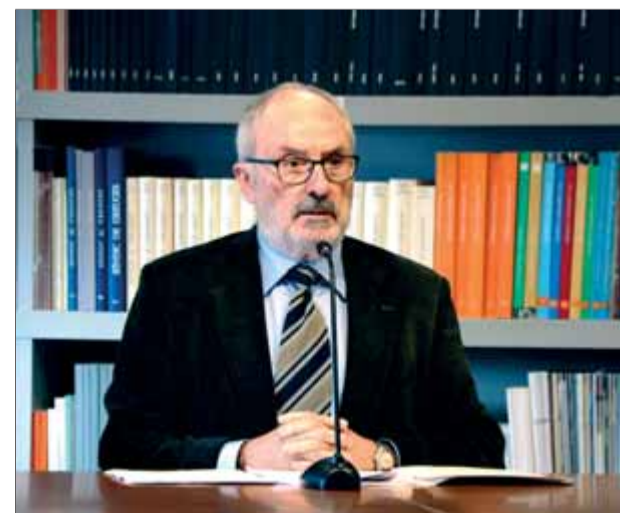
El síndic de greuges, Rafael Ribó, ha rebut milers de peticions per dur el TC al tribunal de Drets Humans

A través d'un comunicat, Ribó va aclarir ahir que només el president i les altres persones que creuen tenir lesionats els seus drets estan legitimats per demanar empara al TEDH. ■