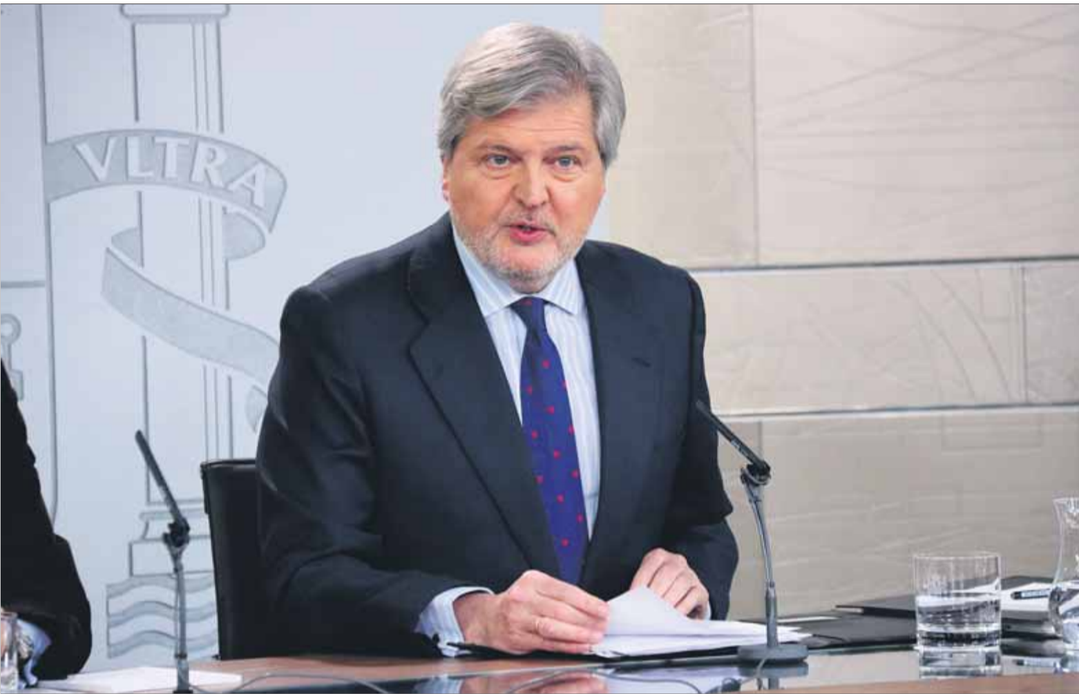
Méndez de Vigo compareixia ahir, després del Consell de Ministres, presentant-se a si mateix com a ministre d'Educació i conseller alhora