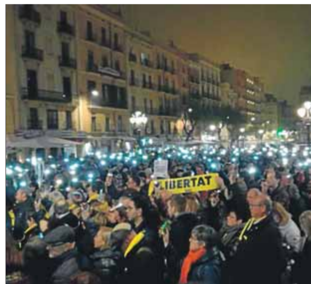
A dalt, imatges de les concentracions a Lleida i Girona, i, a baix, de Vic, Mataró i Tarragona ahir al vespre