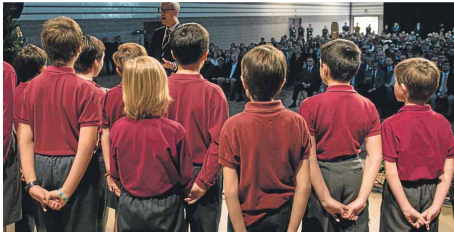
Acte de celebració del cinquantè aniversari de l'escola Bell-lloc del Pla, un centre de l'Opus Dei a Girona