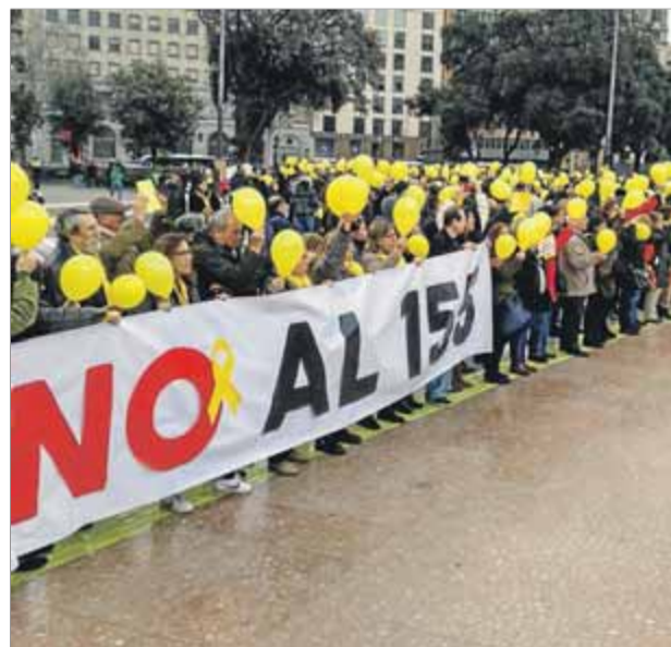
Dues imatges de la manifestació de Barcelona, i una concentració de funcionaris contra el 155

polítiques que tinguin “sentit d’estat”, deixin enrere les “diferències” i arribin a un acord per a la investidura i per recuperar les institucions catalanes. Una petició que va ser molt aplaudida i acompanyada de crits a favor de la “unitat”, dirigits als representants polítics que hi havia a l’escenari –la màxima autoritat era el president del Parlament, Roger