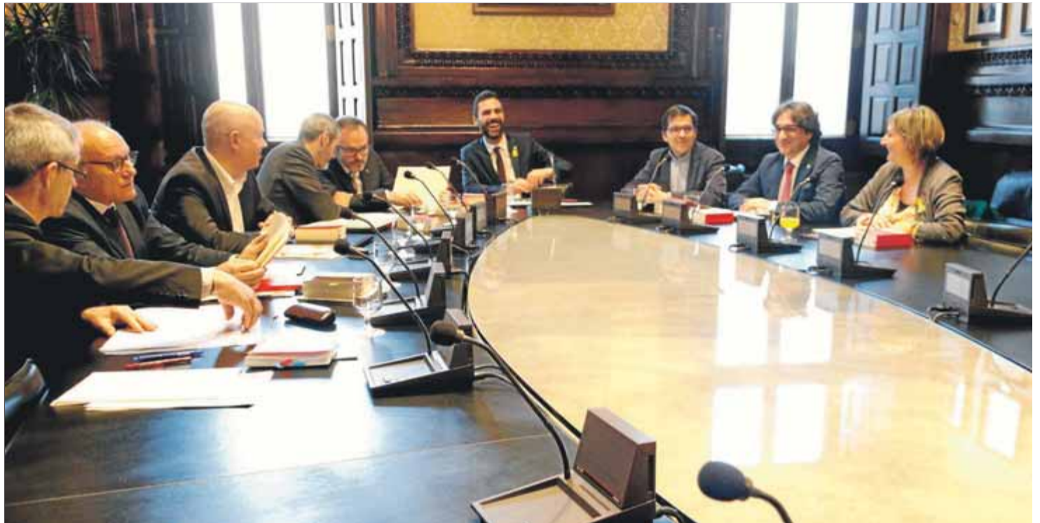
Membres de la mesa del Parlament reunits amb els lletrats de la cambra, el 30 de gener passat

Fa dues setmanes el PSC va presentar una proposta a la mesa del Parlament per tal de posar fil a l'agulla i facilitar la feina dels diputats per constituir com a mínim les comissions que no es dediquen a redactar lleis ni aquelles que tenen un control directe sobre el govern. L'acord per posar-les en marxa va ser unànime, però va durar poc ja que els grups discrepen del nombre de diputats que hauria de constituir cada comissió i que en la majoria dels casos ha de ser proporcional al percentatge d'escons que cada grup disposa en el ple de la cambra fruit del resultat del 21-D. Però depèn del nombre total de diputats amb què s'acabi constituint cada