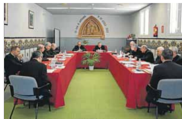
Els bisbes catalans es van reunir ahir a Tiana

■ Els bisbes catalans consensuen un comunicat en què diuen que el problema a Catalunya és polític ■ Legitimen moralment l'opció independentista