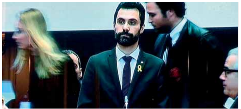
Diversos juristes van plantar divendres el president Torrent per les seves crítiques

■ L'òrgan judicial l'acusa d'"atac frontal" a la convivència, i el president reitera que continuarà defensant els presos i exiliats ■ JxCat i Drets demanen dimissions a l'ICAB