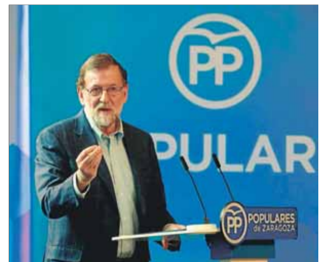
Mariano Rajoy, durant la seva intervenció a Saragossa ahir en una convenció del PP sobre família i conciliació

del PP el que ha aplicat l'article 155 davant dels que "atempten" contra la unitat de l'Estat i la "sobirania nacional". Rajoy també va refermar que vol reformar el sistema de finançament de les comunitats, per a la qual cosa va demanar al PSOE, que amb el PP controla la majoria, s'assegui a negociar-lo. ■