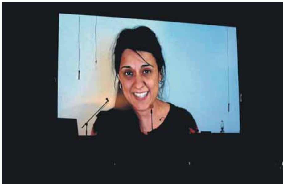
Anna Gabriel, projectada en una pantalla a l'Espai Cultural la Fàbrica Vella, en el moment en què retransmetia una imatge des de Suïssa

Sallent respon, va assegurar que "la campanya repressiva de l'Estat espanyol és un procés clarament polític que afecta desenes de càrrecs públics, però també activistes i membres de la comunitat educativa per haver defensat i cridat a l'exercici del dret a l'autodeterminació i l'expressió de les idees que hi estan vinculades".