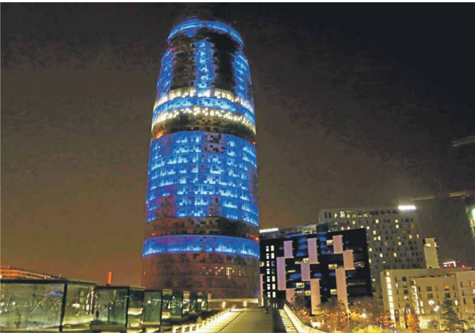
La torre Agbar il·luminada per donar la benvinguda al Mobile World Congress ■ ANDREU PUIG