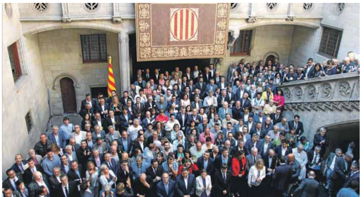
Els alcaldes van respondre a la causa oberta per la fiscalia amb un acte al Palau de la Generalitat el 16 de setembre