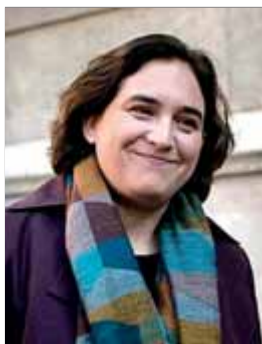
Ada Colau en una imatge d'ahir a Barcelona

Les institucions se sumen a la protesta popular contra el rei espanyol abans del Mobile