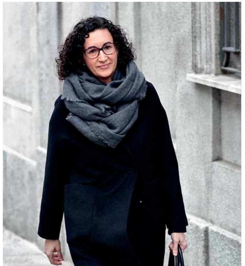
Marta Rovira, dimarts a la seva arribada per declarar al Tribunal Suprem

Tot i que està pràcticament tancat el repartiment de carteres amb JxCat, en les converses no s'ha parlat de noms, i ara cada partit sondejarà els seus propis candidats. En el cas republicà, i pendent