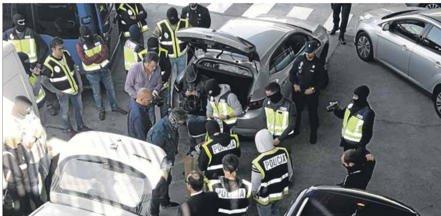
La policia espanyola intercepta tres cotxes dels Mossos a la incineradora de Sant Adrià, el 26 d'octubre passat

"Bona tarda Diego, t'envio un llistat amb els 185 centres de votació que el cos dels Mossos ha pogut tancar fins ara", escriu el comissari, que afegeix: "La idea que s'està donant als mitjans de comunicació sobre la petició d'ajuda que us hem sol·licitat a partir de les 9.11 h, vull insistir que aquesta estava marcada, tal com vam acordar, és a dir