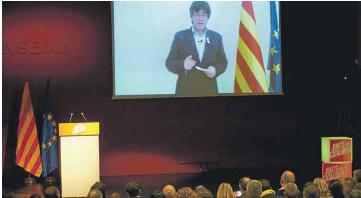
El president Puigdemont, durant la seva intervenció d'ahir en l'acte de Vilafranca