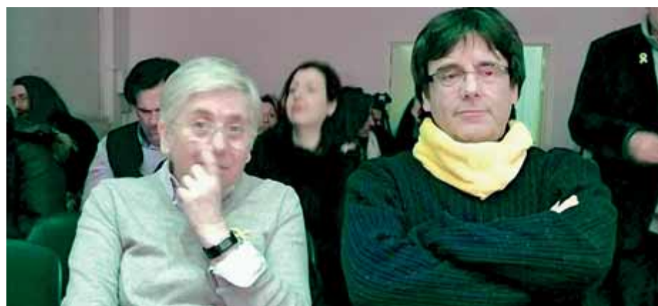
Ponsatí i Puigdemont, en el darrer acte públic a Brussel·les: el concert de Roger Mas

Ponsatí va explicar ahir a VilaWeb que abans de prendre la decisió de tornar a Escòcia va presentar la renúncia del seu càrrec al president, que la hi va acceptar. La decisió de l'exconsellera, l'ha pres per raons “personals i pràctiques” i ha acordat amb Puigdemont de continuar treballant pel procés d'independència des del Regne Unit. “Continuaré treballant per la República des d'aquí”, va dir ahir.