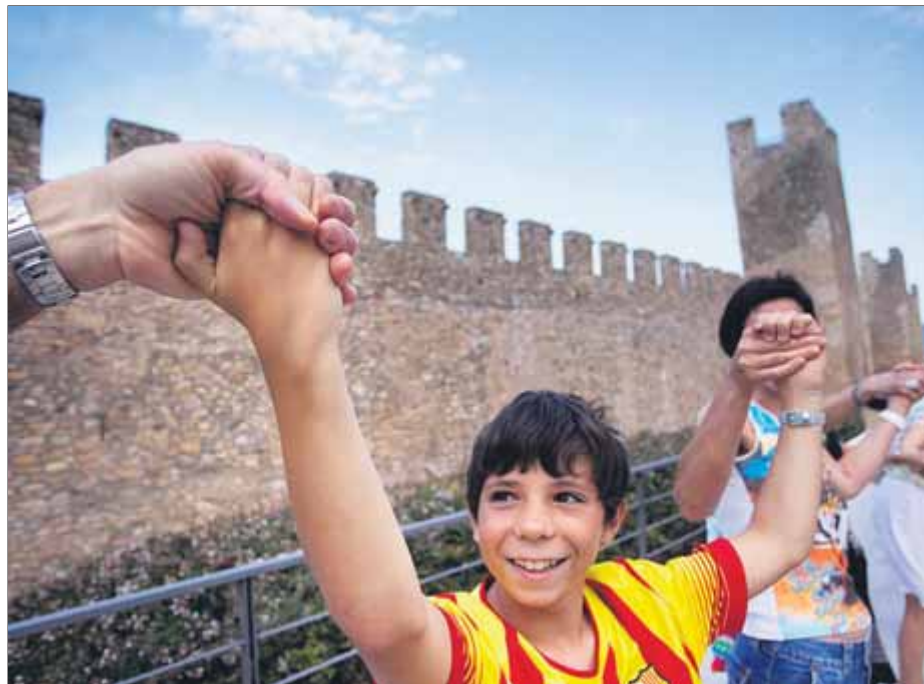
Unes 1.500 persones van fer una cadena humana envoltant la muralla, en un acte organitzat per l'Assemblea Nacional Catalana, l'any 2013.