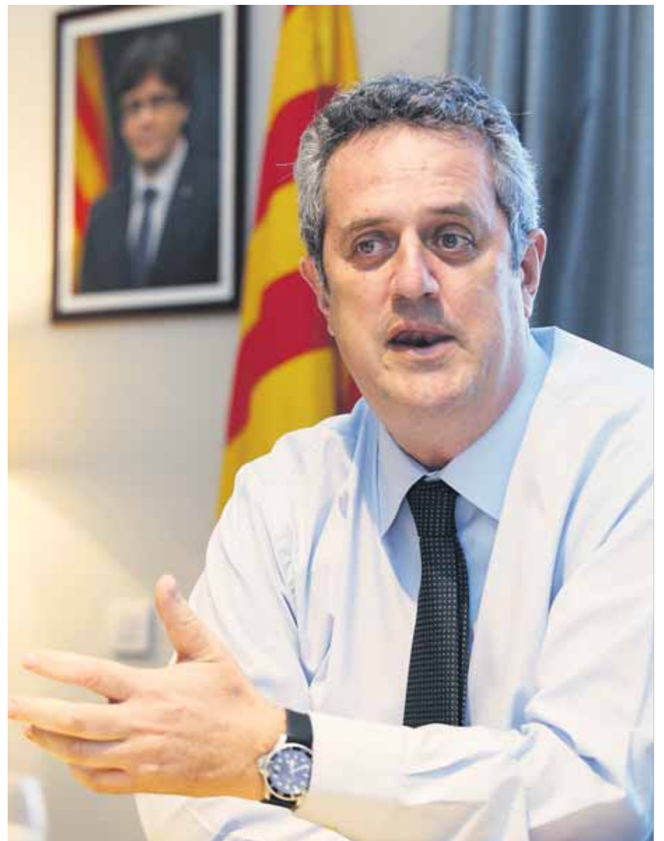
Joaquim Forn en assumir el càrrec de conseller d'Interior, el juliol passat ■ ANDREU PUIG

Així, l'alt tribunal recorda al vicepresident Junqueras que també ha de te-