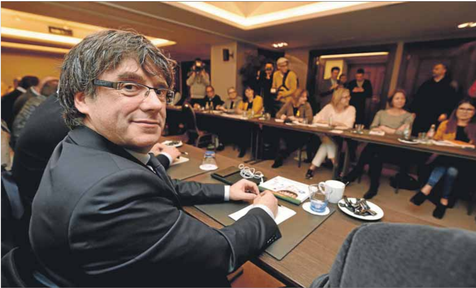
Carles Puigdemont, dimecres, en la reunió que hi van mantenir els diputats del grup parlamentari de Junts per Catalunya

■ La fiscalia espanyola vol que Interior avalui amb el govern helvètic la possibilitat d'arrestar el president amb motiu del viatge a Ginebra ■ El ministeri públic canvia de parer amb relació a l'ordre europea