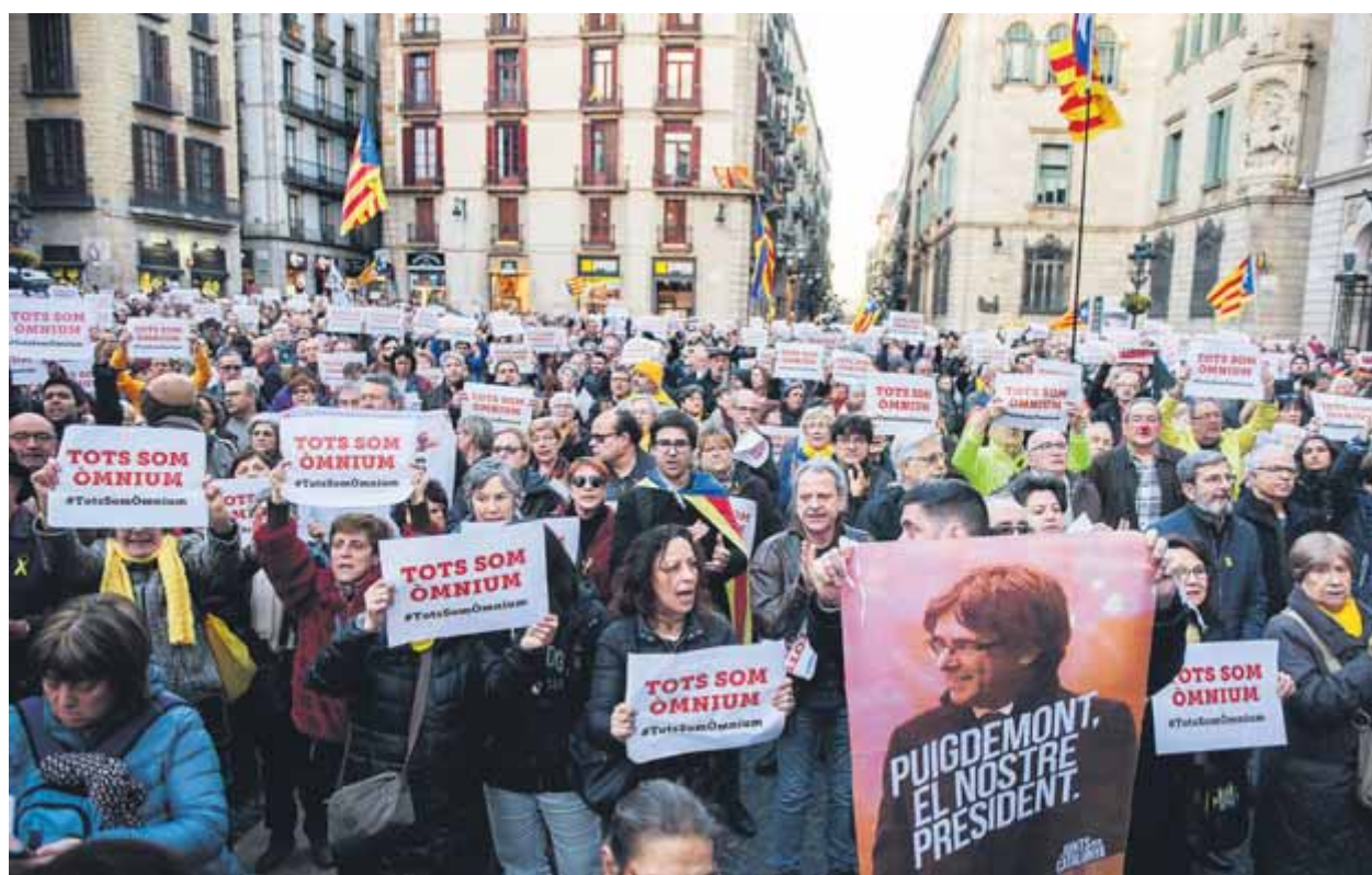
La protesta pels nous escorcolls, ahir al vespre a la plaça de Sant Jaume

PAUSA • JxCat vol esperar dies abans de descartar Sánchez i ERC no afluixa, però la setmana vinent la situació es podria desbloquejar