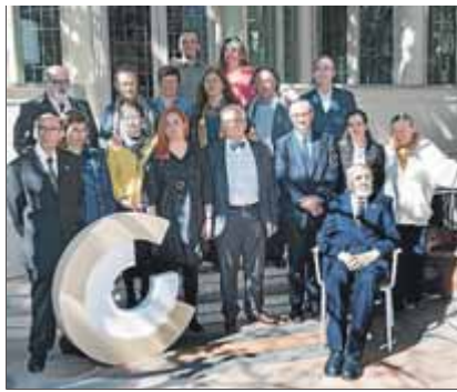
Els premiats, ahir a Barcelona

La Fundació Pau Casals, la festa de Gràcia i el Centre de Titelles de Lleida, també guardonats