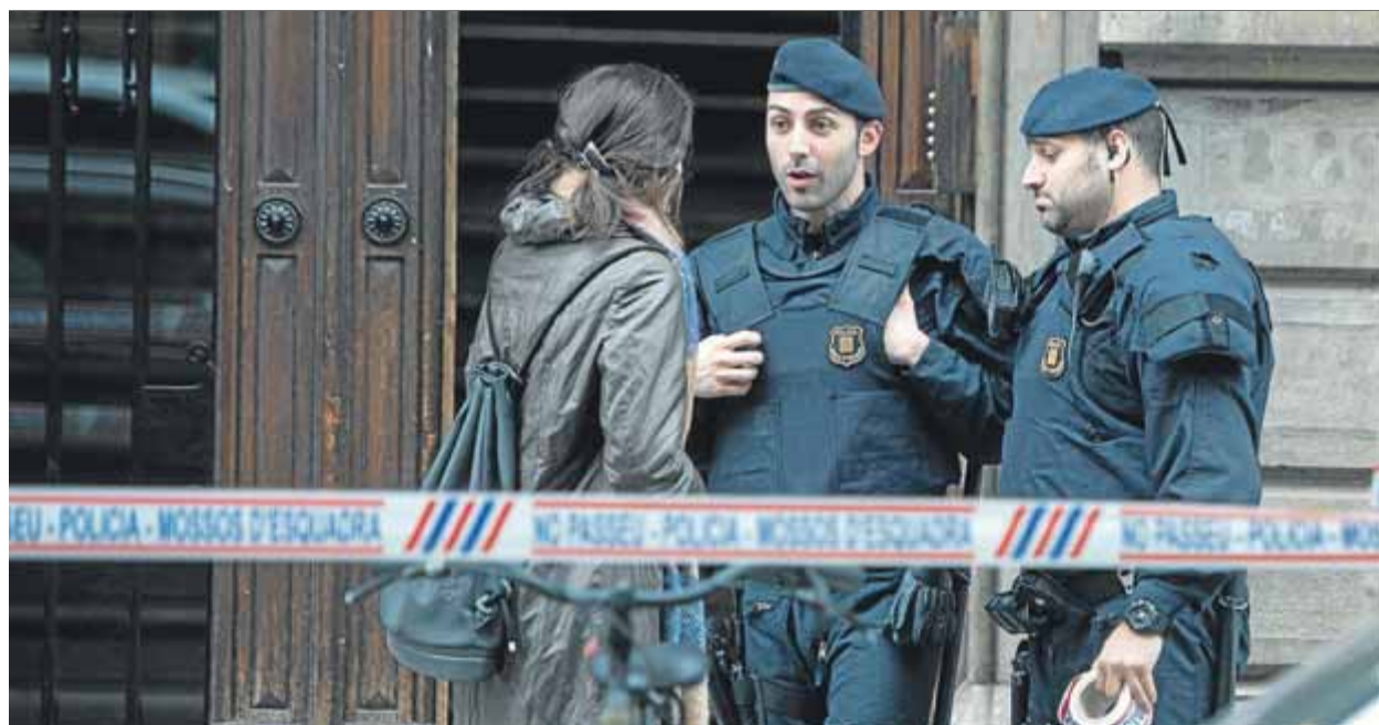
Els Mossos van ser els encarregats del cordó policial davant la seu durant l'escorcoll d'ahir de la Guàrdia Civil.