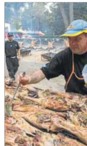
La carn de corder és un dels motors econòmics de la comarca.

El Consell del Corder del Pallars Jussà promou la Gran costellada del corder del Pallars aquest cap de setmana a les barbacoes de la comarca. Amb la idea d'incentivar el consum de carn de corder, un dels motors econòmics de la comarca, l'Ajuntament de Tremp ha posat en marxa una iniciativa per animar la gent del Pallars a recuperar les tradicionals costellades a l'aire lliure. ■