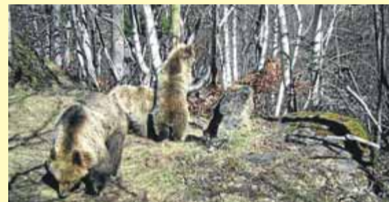
Dos cadells d'os, en una imatge de l'abril ■ DTS