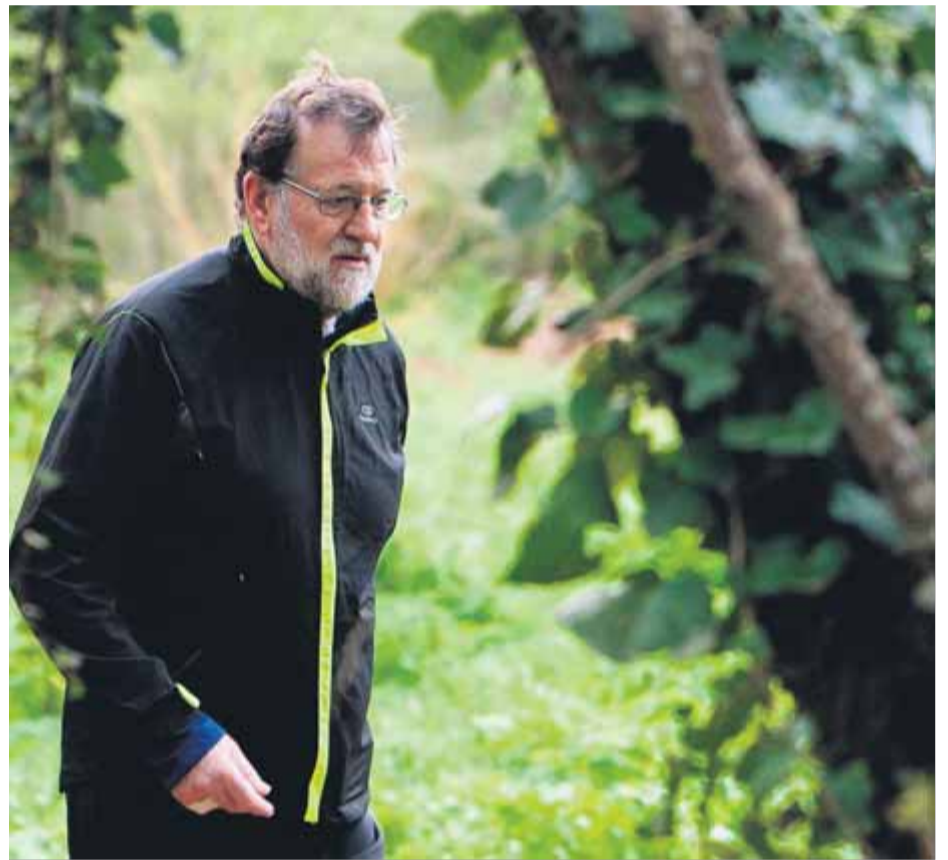
Rajoy recorrent la 'Ruta da Pedra e da Auga' (Galícia) aquests dies de vacances

El guió de Rajoy amb Catalunya basat en el que ell anomena un "retorn a la normalitat" incloïa una investitura efectiva al febrer que li desbrossés el camí per negociar amb el PNB –el sí de Ciutadans el va donar per descomptat des del principi– el sí base al pressupost del 2018. El Consell de Ministres va aprovar divendres una anomalia: presentar els comptes del 2018 quan ja fa tres mesos que viu amb el pressupost del 2017 prorrogat i sabent que no els tindrà en vigor fins al maig o el juny. La primera prova de foc per al govern de Rajoy arribarà l'última setmana d'abril, quan el Congrés debatrà i votarà les esmenes a la totalitat que reclamen la devolució del pressupost, i aleshores necessita sumar al sí de Cs el vot afirmatiu del PNB, que ja ha dit que