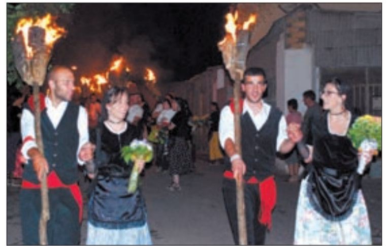
Imatge de la festa de les falles a la Pobla

Des de la junta destaquen que "a partir d'ara, a les falles de la Pobla de Segur, tant homes com dones podran exercir el rol que més els convingui, sense alterar l'estructura de la festa, que demana que les parelles estiguin formades per una persona vestida de fallaire i una de pubilla".