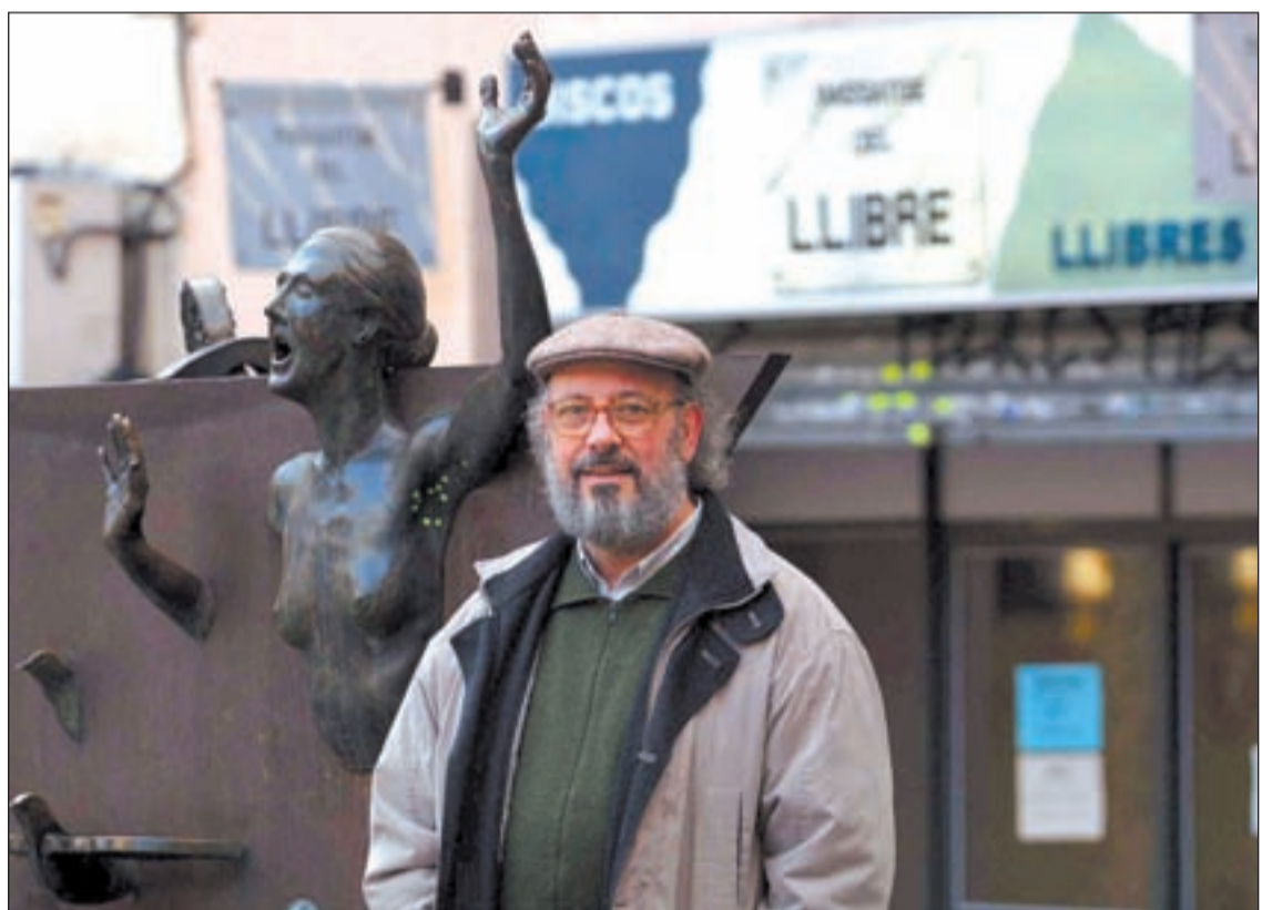
'Camí de Sirga' és l'obra més coneguda de l'escriptor Jesús Moncada