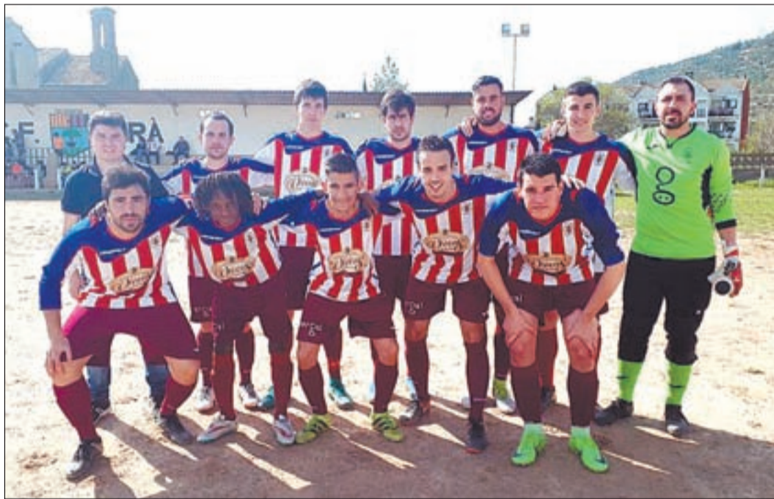
La plantilla del Agramunt certifica un ascenso histórico a cuatro jornadas del final