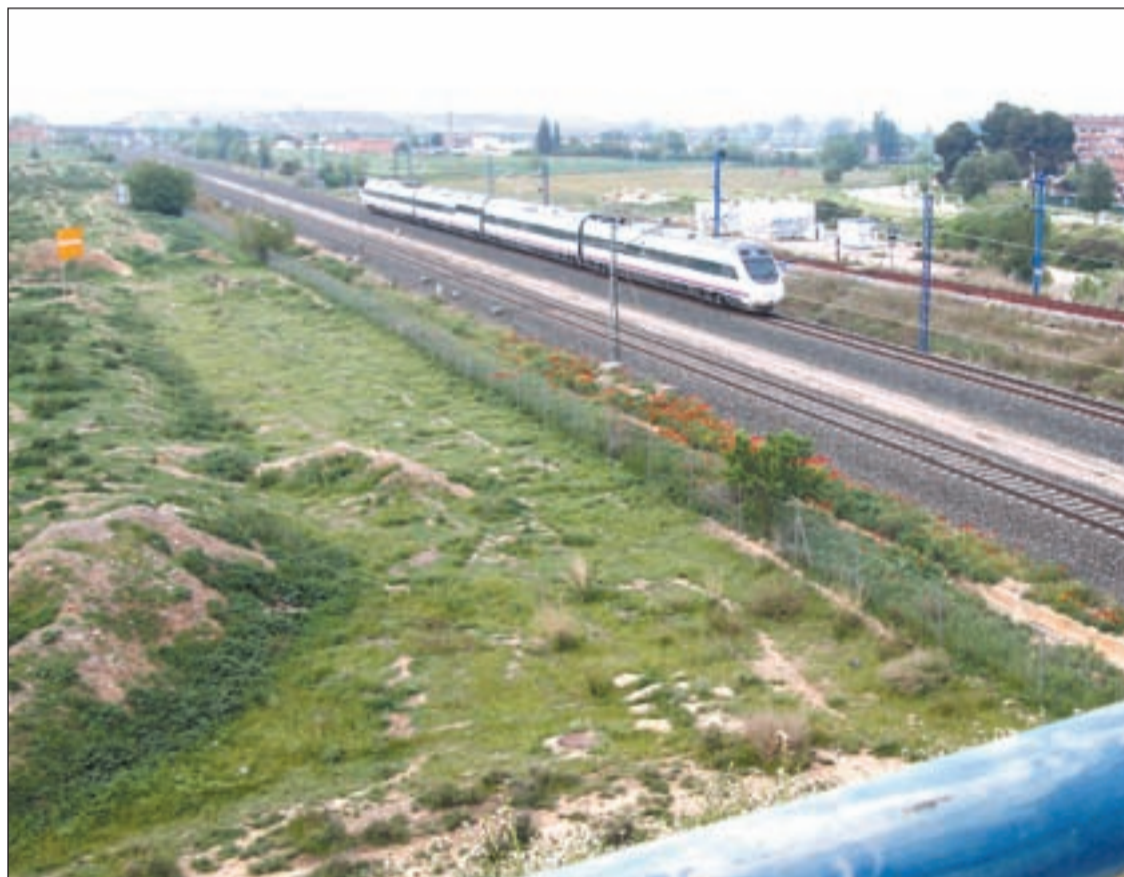
La estación de Torre Salses se ubicaría en esta zona junto a la Bordeta

El nuevo POUM, que el Ayuntamiento de Lleida aprobó inicialmente esta semana, establece los criterios de crecimiento de la ciudad en los próximos 15 años. Un de sus apartados se refiere a la movilidad y, entre las novedades más destacadas, llama la atención la propuesta que se refiere a la red ferroviaria. El nuevo planteamiento prevé cuatro nuevas estaciones "que puedan usar los trenes de cercanías existentes y que permitan nuevas conexiones con el transporte público de alta capacidad". En concreto, se refiere a las estaciones futuras de Onze de Setembre, Torre Salses, polígono El Segre y polígono El Segre-Camí dels Frares, que se sumarían a las ya existentes: la central de Pirineus-Lleida y la del Pla de Vilanoveta (para mercancías). Según el plano que adjunta el POUM, el apeadero de Onze de Setembre tendría que ser soterrado y se ubicaría en el cruce entre la avenida del mismo nombre y Rovira Roure (carretera de Huesca). Mientras, la estación de Torre Salses estaría localizada entre la Bordeta y la urbanización abandonada que enlaza con Magraners, junto a la línea férrea de Tarragona. Como se recordará, la Paeria tiene como objetivo habilitar en esta zona un complejo comercial y cientos de viviendas, de manera que ayudaría a facilitar el acceso a los vecinos o a los compradores. En cuanto a las estaciones del polígono, especialmen-