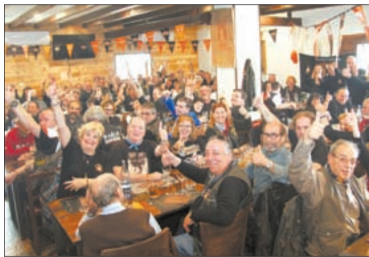
Los moteros cerraron los actos con una comida

El Lleida Chapter celebró durante este fin de semana su noveno Encuentro de moteros, en el que consiguió reunir a un centenar de participantes. Ayer, día de la clausura, los moteros realizaron una ruta por las calles de la ciudad de Lleida y, ya en el mediodía, comieron todos juntos en el restaurante Gran Astoria.