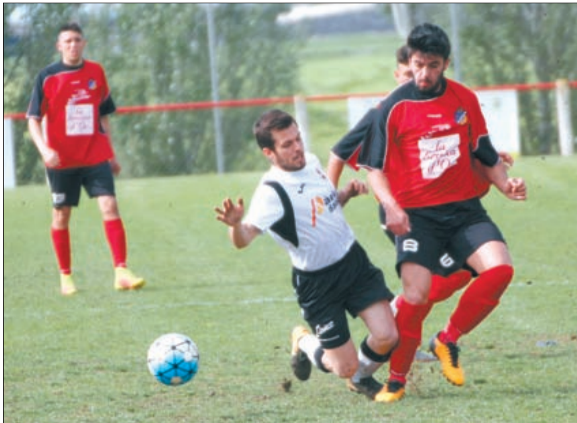
El Tremp certificó su descenso de categoría con una derrota en Vallfogona de Balaguer

El Tremp pierde en Vallfogona y desciende a Tercera Catalana