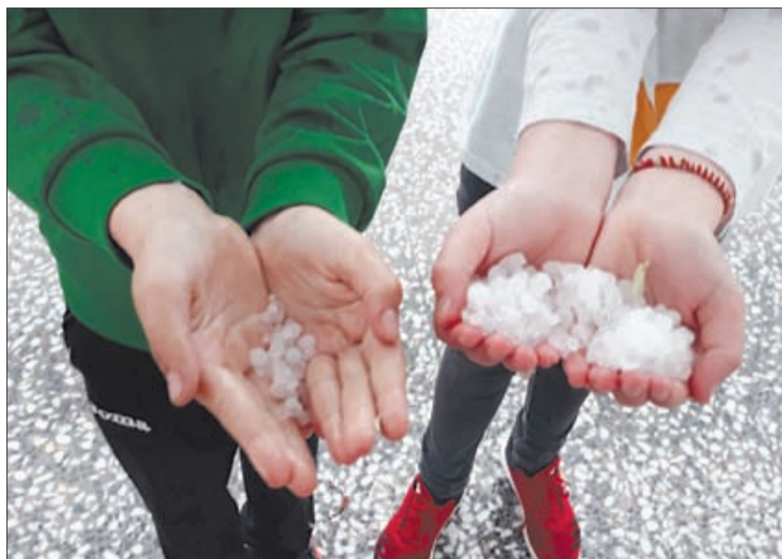
Dos veïns de l'Horta de Lleida mostren la pedra que va caure sobre els camps. Era del tamany d'un cigró. En les fotos inferiors, una nectarina afectada per impactes a Albatàrrec i imatge del Port de la Bonaigua ahir.

ment a les produccions de pera, préssec, nectarina i paraguaians, ja que són els fruits que ja han quatllat.