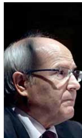
Montilla va abandonar el ple del Senat el 27-O per no avalar el 155 ■ ORIOL DURAN

El reglament del PSOE a les Corts preveu una sanció de 200 a 600 euros per