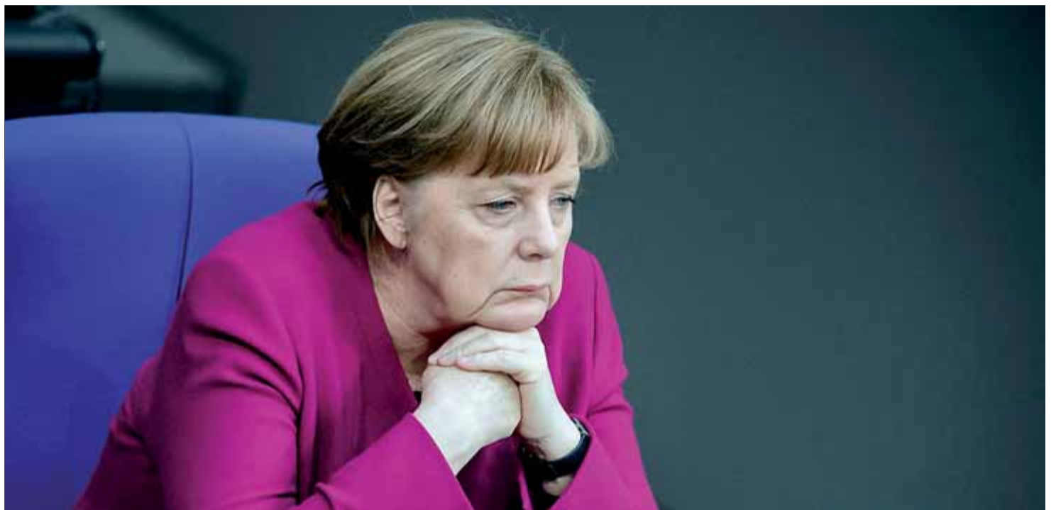
La cancellera alemanya, Angela Merkel, en el darrer debat parlamentari al Bundestag, abans de les vacances