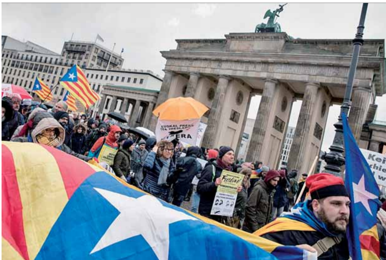
Alguns dels manifestants en l'emblemàtic indret de Berlín

PAS • ERC planteja formar govern abans de Sant Jordi i creu que JxCat no proposarà el president