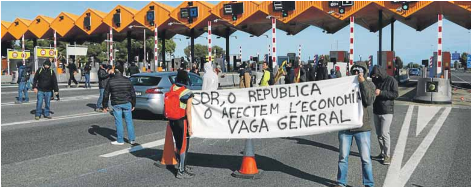
Acció de protesta d'un grup d'activistes dels CDR al peatge de l'AP-7, a l'altura del Vendrell, on les barreres van estar aixecades durant més d'una hora

■ Els Comitès de Defensa de la República desmunten tanques en peatges de l'AP-7, en "la primera acció directa de desobediència civil massiva" ■ Reclamen la llibertat dels presos polítics