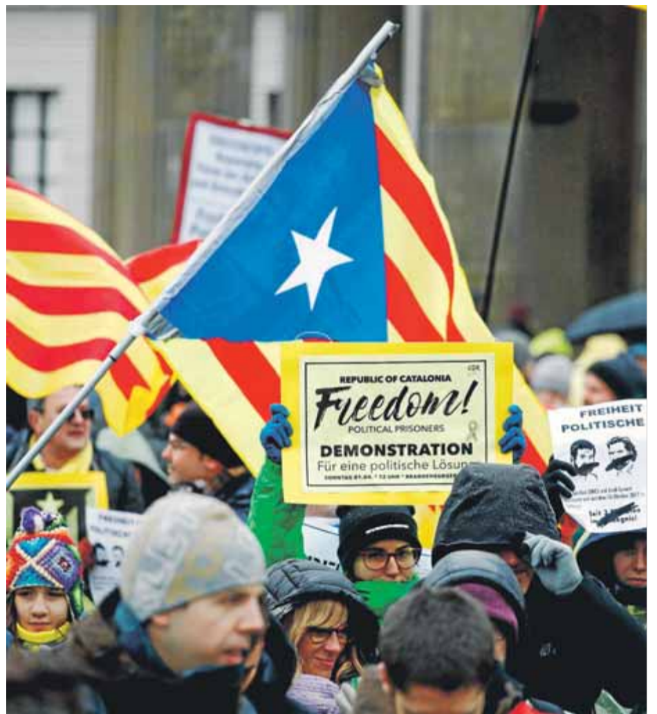
La manifestació per la llibertat dels presos, ahir a Berlín

Pel que fa a la investidura de Puigdemont, l’ex-president Artur Mas advertia ahir en una entrevista a RAC1 que, en la situació actual, comportaria conseqüències penals per a més gent, un risc que demana valorar si “val la pena” tenint en compte els dirigents empresonats, els que són fora del país i els que tenen processos judicials oberts. Mas defensa que Puigdemont té tota la legitimitat, però hi afegeix que “a vegades la legitimitat no s’imposa a curt termini”. Per això, demana “rearmar forces, constància i molta intel·ligència política” per capgirar a mitjà termini una situació que creu que no es podrà resoldre “ni en sis dies ni en sis mesos”. ■