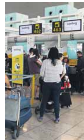
Els taulells de facturació de Vueling, ahir al matí a l'aeroport del Prat

La primera jornada de vaga de pilots de Vueling va obligar a cancel·lar ahir un total de 122 vols, el 14% del dispositiu programat per l'aerolínia, que va recol·locar amb antelació la majoria dels passatgers en altres vols, la qual cosa va evitar incidències destacades, com ara cues, se-