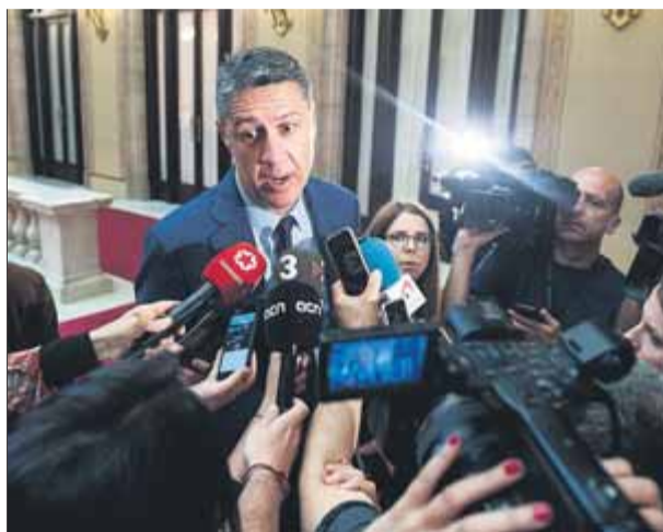
Xavier García Albiol, ahir al Parlament

La policia espanyola va detenir ahir a Torroella de Montgrí un veí de 36 anys per haver assetjat i insultat a través de les xarxes socials el president del PPC Xavier García Albiol. Segons la policia, des del mes d'octubre l'arrestat havia sotmès el líder popular a una "persecució virtual" enviant-li missatges cada dos o tres dies. Els textos, diu la policia, contenien frases "de caràcter injuriós, amb to humiliant" i alguns eren "amenaçadors". El mateix García Albiol va denunciar els fets, que ha portat a terme el jutjat central d'instruc-