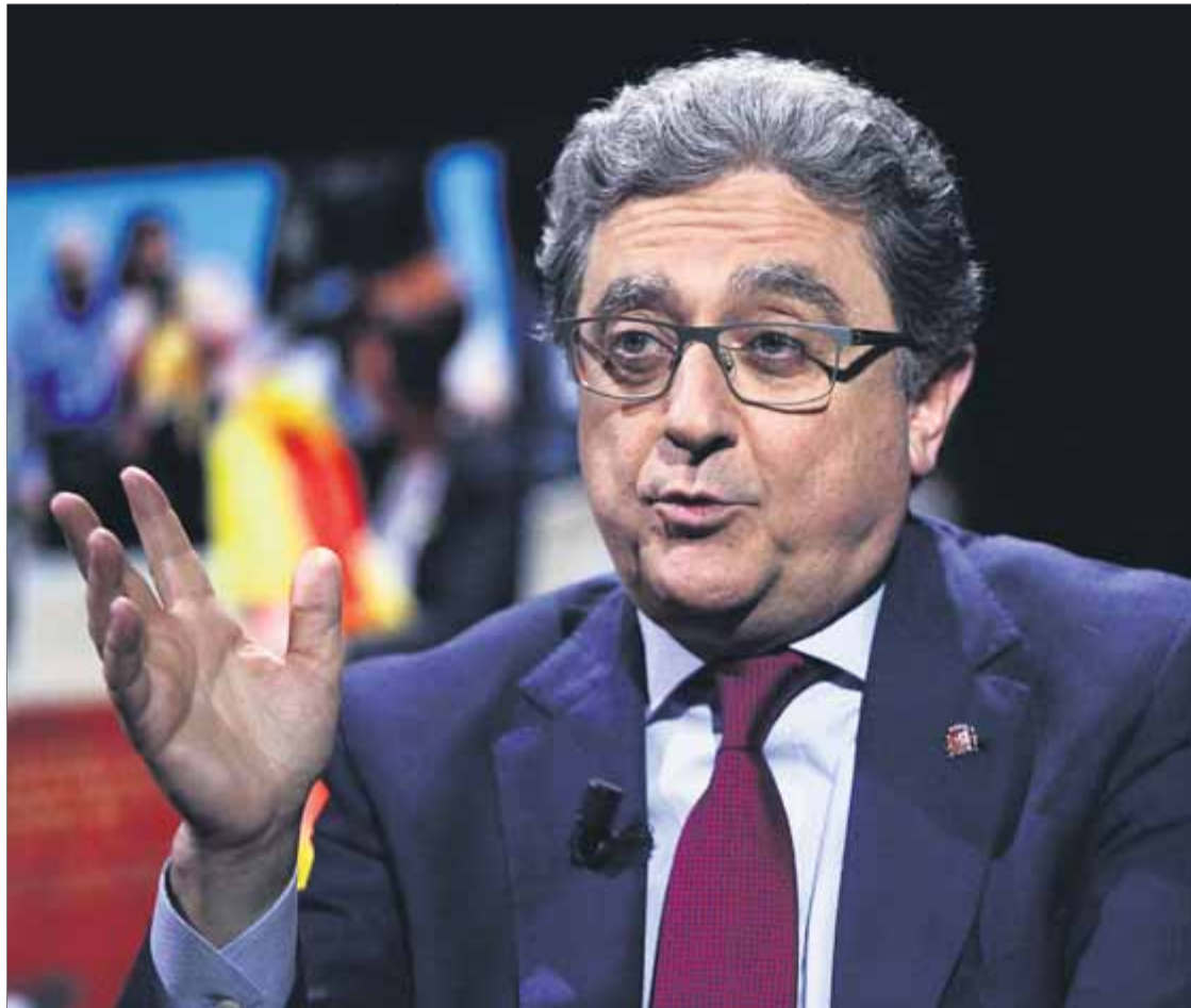
El delegat del govern espanyol a Catalunya, durant una de les respostes a l'entrevista

No m'agrada. És una situació que em fa pensar en les seves famílies. Fa patir. Per ells i per les seves famílies. I alguns d'ells els conec molt, hi he tingut converses llargues. Hem discrepat, però també hem sigut capaços d'arribar a acords. Amb Josep Rull, que com jo és de Terrassa, havíem tingut llargues converses. O amb Turull, o amb Forn... Són persones que coneixes i que humanament fa patir. Només hi ha una cosa que a mi em permet suportar aquesta situació i és que tots i cadascun d'ells van prendre decisions d'acord amb la seva manera de pensar sabent que aquestes decisions