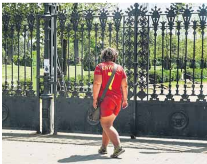
Un dels accessos a la Ciutadella tancats ahir

Sota els efectes del 155, s'han convocat set plens. El primer va ser el de constitució, el