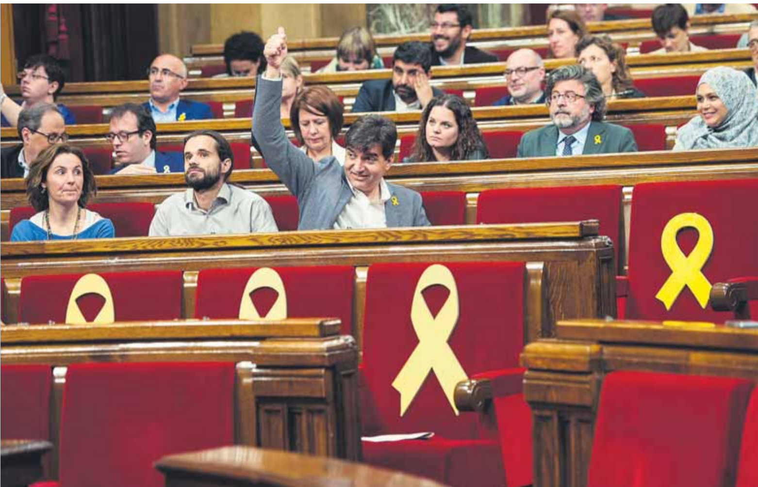
Sergi Sabrià va votar ahir per primer cop en nom de Comín, a més de Junqueras i Romeva. Elsa Artadi ho fa per Puigdemont, Sánchez, Turull i Rull