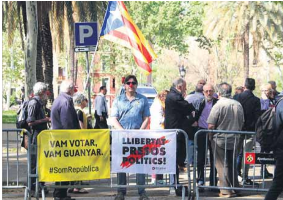
Concentració en suport a la Intersindical-CSC a les portes del TSJC a Barcelona, ahir

L'advocat de la defensa, Carles Hurtado, va admetre que "tota vaga general