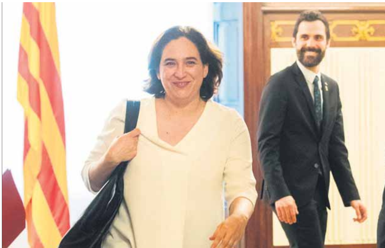
Colau i Torrent, en sortir de la reunió, ahir al despatx d'audiències del Parlament

Roger Torrent va anunciar, després dels nous empresonaments de Jordi Turull, Raül Romeva, Dolors Bassa, Josep Rull i Carme Forcadell i l'exili de Marta Rovira, la constitució d'un front ampli "en defensa de la democràcia i dels drets fonamentals". El president del Parlament es va reunir ahir amb l'alcaldeessa de Barcelona i líder de Catalunya en Comú-Podem, Ada Colau, a qui va traslladar la voluntat de treballar en la construcció d'aquesta aliança transversal més enllà d'opcions polítiques, "sobretot en el sentit de desjudicialitzar la política perquè el diàleg sobre la relació entre Catalunya i Espanya es pugui tornar a portar a la negociació", va explicar la dirigent dels comuns en sortir de la trobada al despatx d'audiències de la cambra després de tres quarts d'hora de conversa. "Aquests objectius els compartim", va afirmar. L'alcaldeessa va adreçar a Torrent la urgència de començar a recuperar la "normalitat institucional" i de lluitar contra la judicialització de la política i va apostar per la formació d'un govern com més aviat millor amb una presiden-