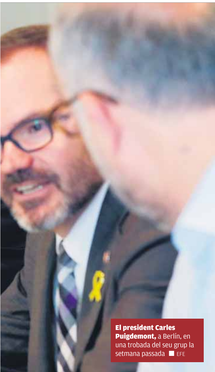
El president Carles Puigdemont, a Berlín, en una trobada del seu grup la setmana passada