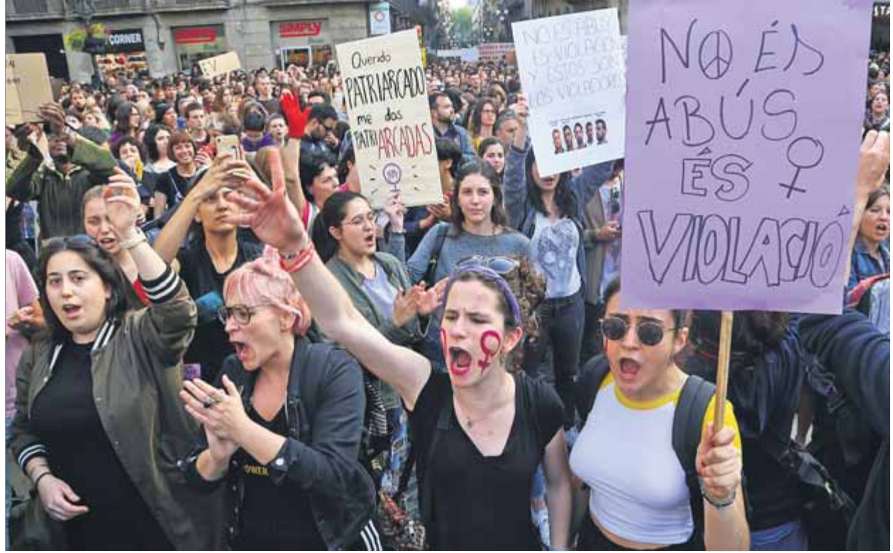
La plaça Sant Jaume de Barcelona va quedar petita per tantes persones que protestaven per la sentència ■ JUANMA RAMOS