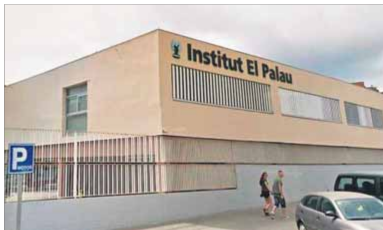
Instal·lacions de l'institut de Sant Andreu de la Barca ■ EPA

La reacció dels pares d'alguns alumnes davant el que entenen que és un acte de llibertat d'expressió va ser culpabilitzar i denunciar alguns professors pel delictes d'incitació a l'odi. Els primers professors acusats van repetir reiteradament davant la resta de companys que en cap cas no s'havia fet res que es pogués qualificar en aquests termes. La lli-