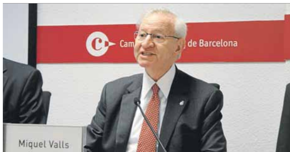
Miquel Valls, president de la Cambra de Comerç de Barcelona, ahir ■ ACN

■ Estima que l'economia catalana creixerà un 3,1% el 2018, quatre dècimes més del que deia a l'hivern ■ Totes les cambres catalanes demanen la formació del govern