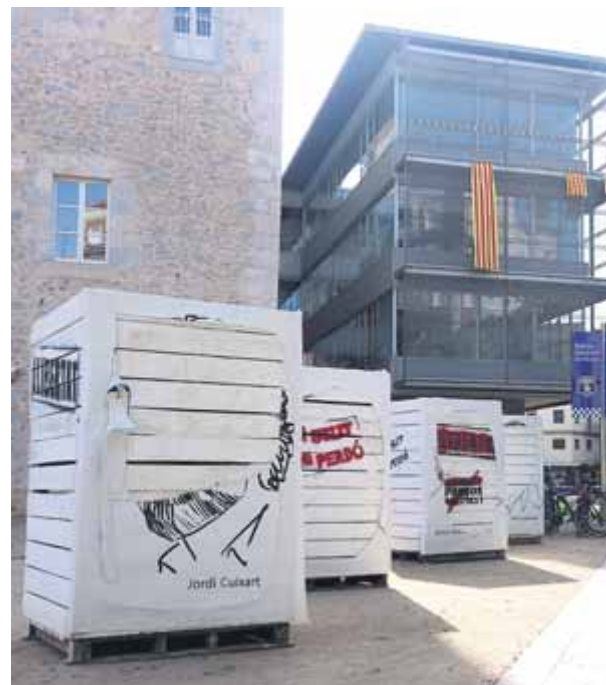
Desperfectes en els retrats dels líders independentistes

L'ANC havia col·locat nou estructures de fusta recobertes amb lones on hi havia els retrats dels Jordis i dels membres del govern català empresonats i els que han hagut de marxar a l'estranger. Van crear aquests tòtems uns veïns de Lladó per denunciar que hi hagi presos polítics al país i exiliats. Dimecres a la matinada, un grup d'encaputxats —format per unes vuit persones— es va dedicar a malmetre aquestes escultures . Portaven passamuntanyes i motxilles, i van tallar amb cúters les lones amb els diferents retrats dels líders