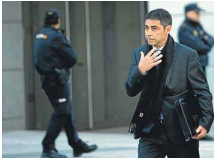
Josep Lluís Trapero, anant a l'Audiencia Nacional

Quan a la policia se'ns acaben els arguments, les habilitats professionals i les personals, sovint