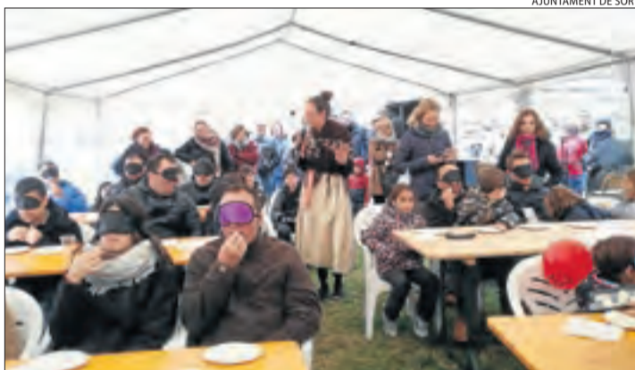
Tast a cegues durant la Mostra de Formatges.

| LLEIDA | Sort va posar fi ahir a la vuitena Mostra de Formatges Artesans de Catalunya després de rebre uns tres mil visitants des de divendres passat. El recinte del parc del Riuet va reunir vint-i-set artesans del sector de tot el territori català i a les seues parades es podien trobar vuitanta varietats de formatges de vaca, ovella, cabra i búfala. El certamen va incorporar aquest any com a novetat un estand dedicat a promocionar la llet de cabra autòctona catalana i els formatges elaborats a partir d'aquesta. També hi va haver espais dedicats a uns altres dos productes locals: els vins del Cellar del Batlliu i la cervesa Ctretze.