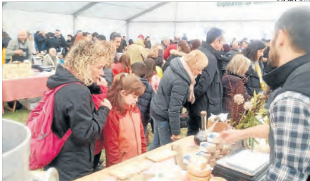
La Mostra de Formatges va rebre una alta afluència de públic des de divendres passat.