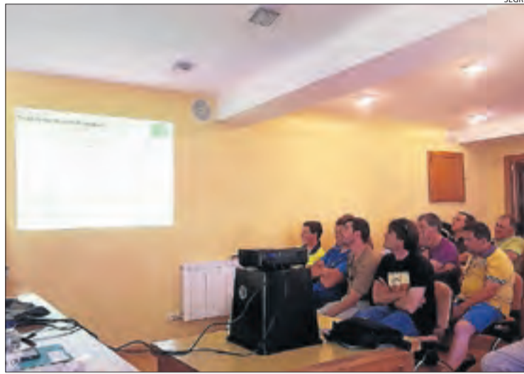
Imatge d'arxiu d'una reunió sobre el camp de golf de Bossòst.