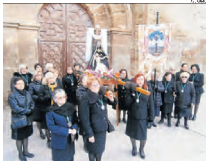
AV JAUME I