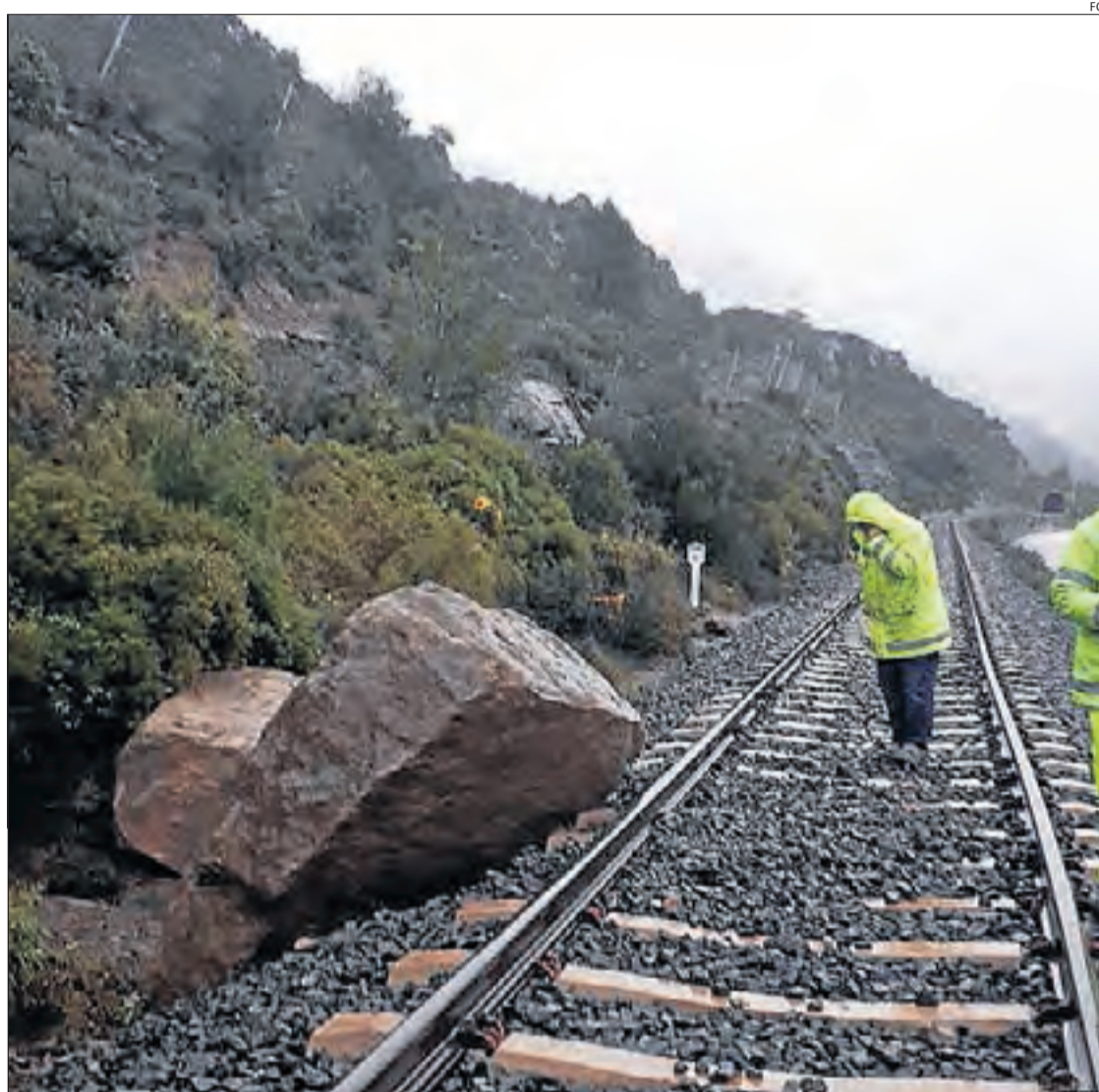
Operaris treballaven ahir per retirar les roques que van tallar la via del tren de la Pobla.

FGC inspeccionarà avui amb drons la via a la zona d'Àger per possibles noves allaus de roques