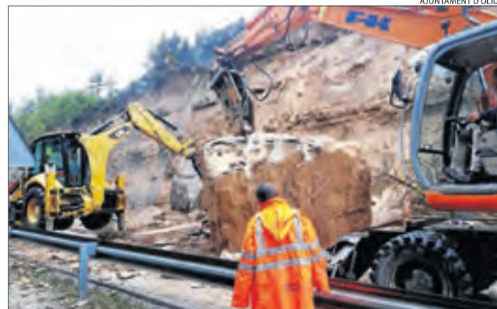
Maquinària esmicola la gran roca sobre la C-26 a Oliús.