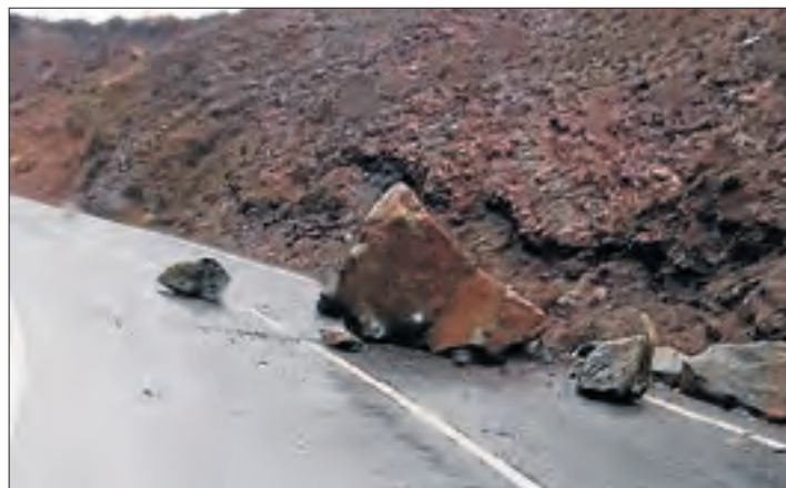
La roca sobre l'N-230 al seu pas pel pantà d'Escalles.