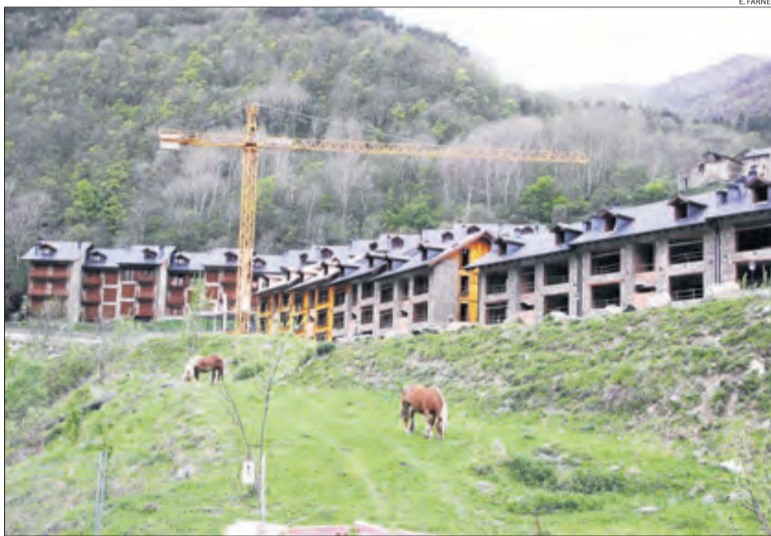
Imatge d'arxiu dels primers pisos construïts a Espui en el marc del projecte del resort.

D'aquesta manera, les fitxes informatives de cada lot assenyalen que el projecte del resort "comptava amb tres concessions administratives" per construir pistes i instal·lar remuntadors i canons de neu, atorgades per l'ajuntament de la Torre de Capdella, l'entitat municipal descentralitzada (EMD) d'Espui i Toms SA, que agrupa particulars del municipi. "Aquestes concessions resulten extingides pels efectes propis de la liquidació" puntualitza, si bé apunta que "no hi ha coneixement que l'administració hagi iniciat