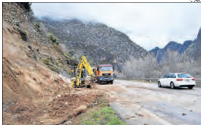
Treballs després del despreniment a la C-14 a Organyà.

En previsió de noves avingudes, Endesa i la Confederació Hidrogràfica de l'Ebre van continuar desembassant. Endesa va deixar anar vuitanta metres cúbics per segon a Camarasa i 190 en el partidor de Balaguer. A les 21.00 del vespre, el Segre transportava 148 metres cúbics per segon a Lleida, i a Balaguer un total de 175. Fonts d'Endesa van assegurar que les comportes de la Mitjana, a la capital, podrien arribar a deixar anar fins a dos-cents metres cúbics per segon. En un altre ordre de coses, la neu es va mantenir i va cobrar més força i les estacions meteorològiques van registrar fins a mig metre de neu nova a les cotes altes del Pirineu.