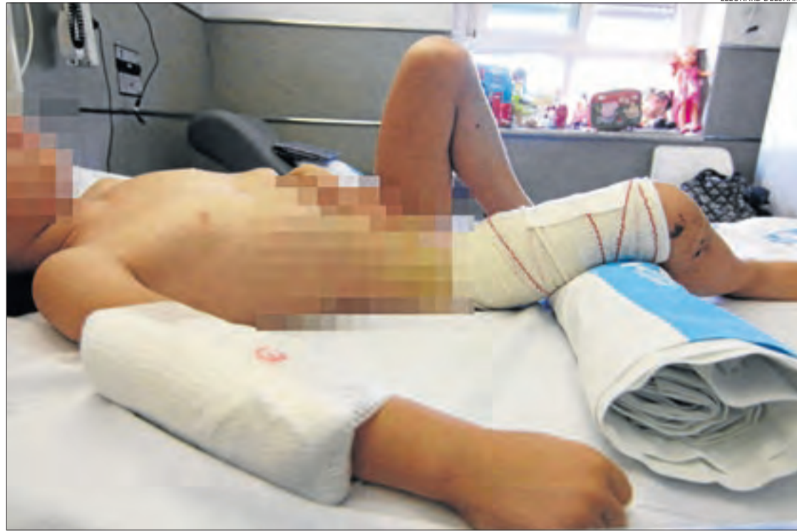
La petita va patir mossegades als dos braços, la cuixa, el costat i l'esquena.

Els pares de la petita, que també van participar en el ple, van mostrar ahir el seu males-