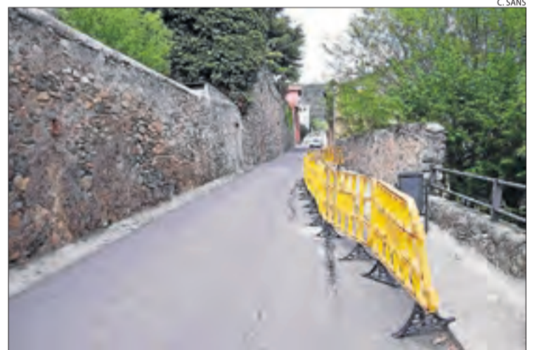
El camí Sota Palau de la Seu d'Urgell.

D'altra banda, l'ajuntament de la Seu d'Urgell ha tret a concurs les obres per reconstruir part dels murs de contenció del camí de Sota Palau, deteriorats a causa del pas dels anys i com a mesura de prevenció. El camí serveix per comunicar dos àrees del centre històric, donant