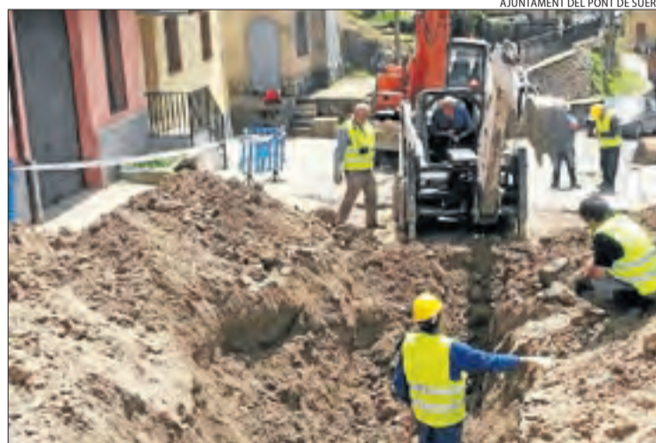
Els operaris van iniciar els treballs d'emergència.