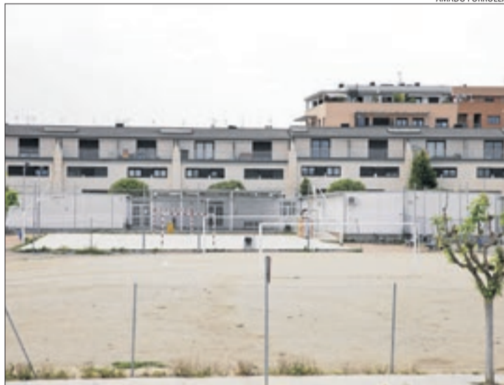
Els mòduls prefabricats de l'institut de Torrefarrera.

L'obra ja compta amb els permisos de l'ajuntament i els treballs s'han programat perquè siguin compatibles amb l'activitat habitual del centre i dels estudiants. Els barracons de Torrefarrera (amb el col·legi Pinyana de Lleida són les úniques instal·lacions que segueixen en mòduls prefabricats des que es van estrenar fa anys) s'ubiquen al costat del solar on es construirà el nou institut, de manera que "una part del nou edifici va al pati del centre actual", va assenyalar Latorre. En canvi, el terra que ocupen