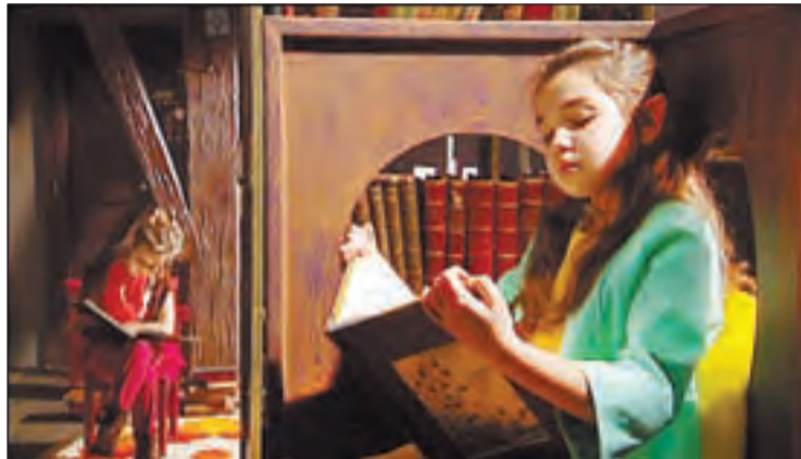
L'activitat s'enmarca en el Pla de Lectura 2020

La Supernit té per objectiu fer arribar als més petits la importància de la lectura i, per fer-ho, el Super3 ha ideat una aventura multitudinària, simultània i transmèdia per tot el territori en què els nens i nenes participants ajudaran la Nenúfar i la Matoll perquè puguin sortir de la biblioteca de la casa de la família del Super3 on han quedat tancades pel malvat Sr. Pla. Més de 150