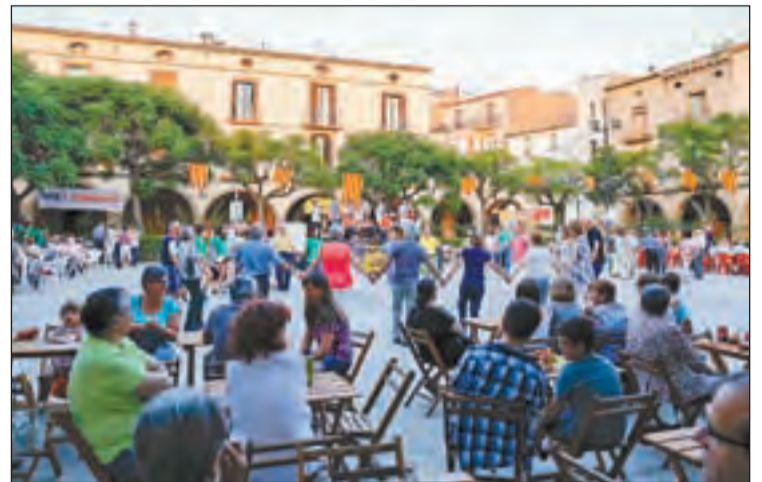
L'Aplec de la Sardana d'Agramunt en la Plaça Mercadal

La primera de les ballades que va organitzar l'Agrupació va ser