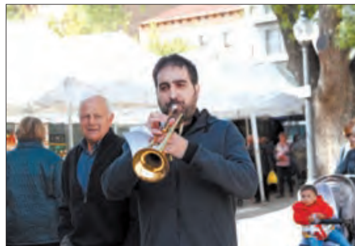
El pregoner anunciant l'inici de la campanya

El pregoner de Solsona va recórrer ahir al migdia els carrers del nucli antic del municipi per anunciar l'arrencada de la campanya El mes gastronòmic . Es tracta d'una campanya turística i gastronòmica que vol posicionar el Solsonès com a "destí favorit" del mes de maig, una època tradicionalment fluixa per als establiments de la comarca.