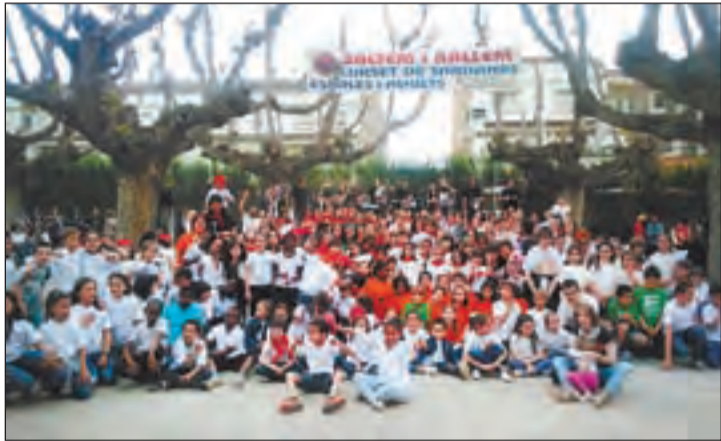
Imatge de la trobada el 2016 a Mollerussa

Agramunt acull una nova edició de la Trobada del Saltem i Ballem