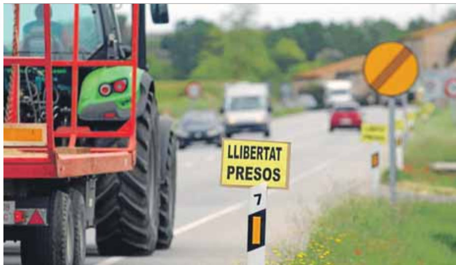
Una imatge de com va aparèixer ahir l'N-II entre la Jonquera i Tordera

pública”. Els cartells es van col·locar de matinada i ahir ja van ser vistos per milers i milers de conductors, molts dels quals havien anat a l'Empordà i al Vallespir pel pont de l'1 de maig i tornaven cap a casa. També hi havia cartells en contra de la monarquia i a favor de la llibertat d'expressió. ■