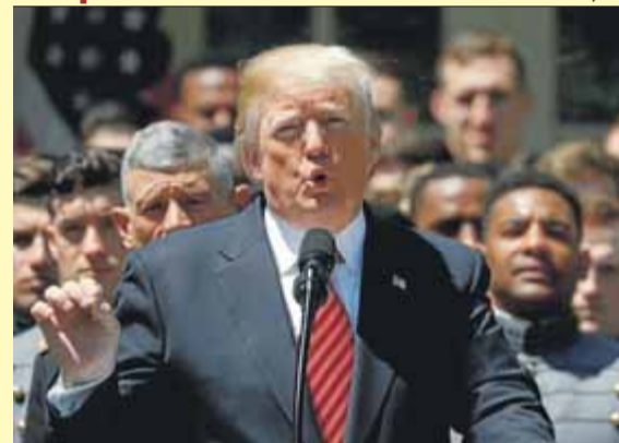
Donald Trump, en una acadèmia militar, ahir