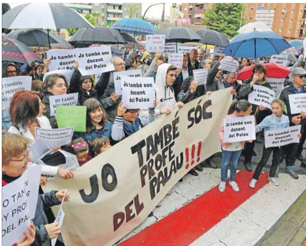
Centenars de persones es van concentrar ahir davant l'ajuntament ■ JUANMA RAMOS

Els mestres perseguits van deixar petjada. “Estupefacció total, jo havia tingut alguns d'aquests profes , la meua dona ha estat molts