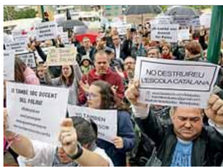
Concentració pels docents de l'IES ■ J. RAMOS

Concentració de veïns i mestres en solidaritat amb els docents de Sant Andreu de la Barca