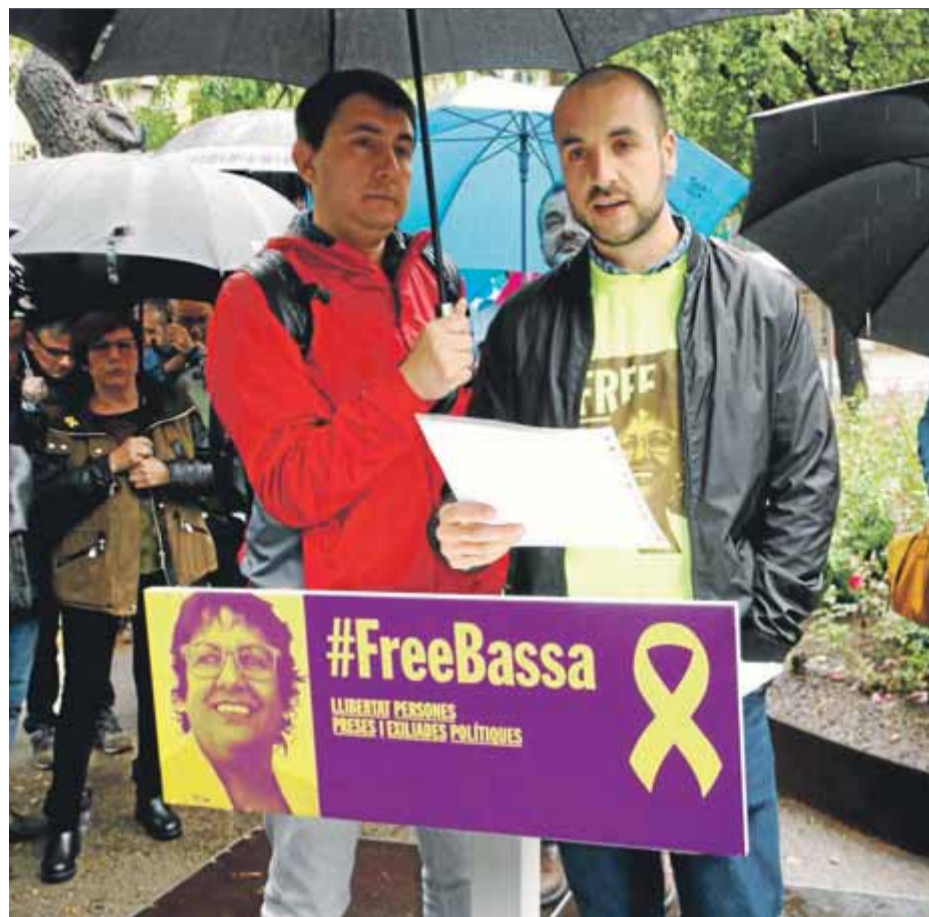
El fill de la consellera va llegir una carta enviada des de la presó

no se circumscriu al que va passar el dia del referèndum i als enfrontaments als col·legis electorals, sinó que es retrotrau a l'inici del procés sobiranista, “amb reiterades desobediències a les resolucions del Tribunal Constitucional”. Un segon informe del Suprem, més breu, es dedica íntegrament a justificar la suposada existència d'un delictes de malversació, amb la tesi que per imputar aquest delictes a Puigdemont “no és condició inexcusable que s'hagi produït el desemborsament, sinó que n'hi ha prou que s'hagi adquirit el compromís amb l'empresa o l'entitat prestatària del servei”. Així, considera que és perseguible si hi ha subministraments que no s'han pagat però van ser contractats. ■