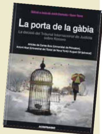
LA PORTA DE LA GÀBIA Autors: Diversos Editorial: A Contra Vent

El llibre recull les cartes que s'han conservat de la correspondència entre dos amics, entre Pau Casals i Josep Trueta. Es tracta d'un epistolari gairebé complet, on es poden anar resseguint esdeveniments com la reacció de Casals quan va conèixer la posició anglesa un cop acabada la Segona Guerra Mundial, l'obtenció de la càtedra d'Oxford per al doctor Trueta, l'inici dels Festivals de Prada, les peripècies de les campanyes del Nobel i l'estat de salut del mestre, sempre amb Catalunya com a marc de fons.