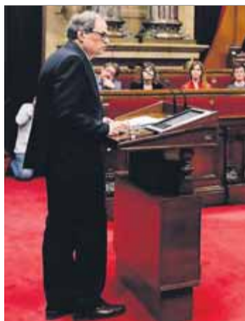
Quim Torra, durant el discurs d'investidura al Parlament

De fet, ara els catalans hem vist que és possible avançar econòmicament, fins i tot amb independència de les pressions i dels paranys polítics i econòmics per aturar aquest avenç, i això és fenomenal. Ho hem de mantenir i enfortir. Hem vist com unes grans empreses traslladaven la seu social fora de Catalunya com a interferència política, però alhora hem vist com grans empreses es mantenen al territori, malgrat les fortíssimes pressions, fins i tot de la corona. I també hem vist com, en aquest temps del 155, deu em-