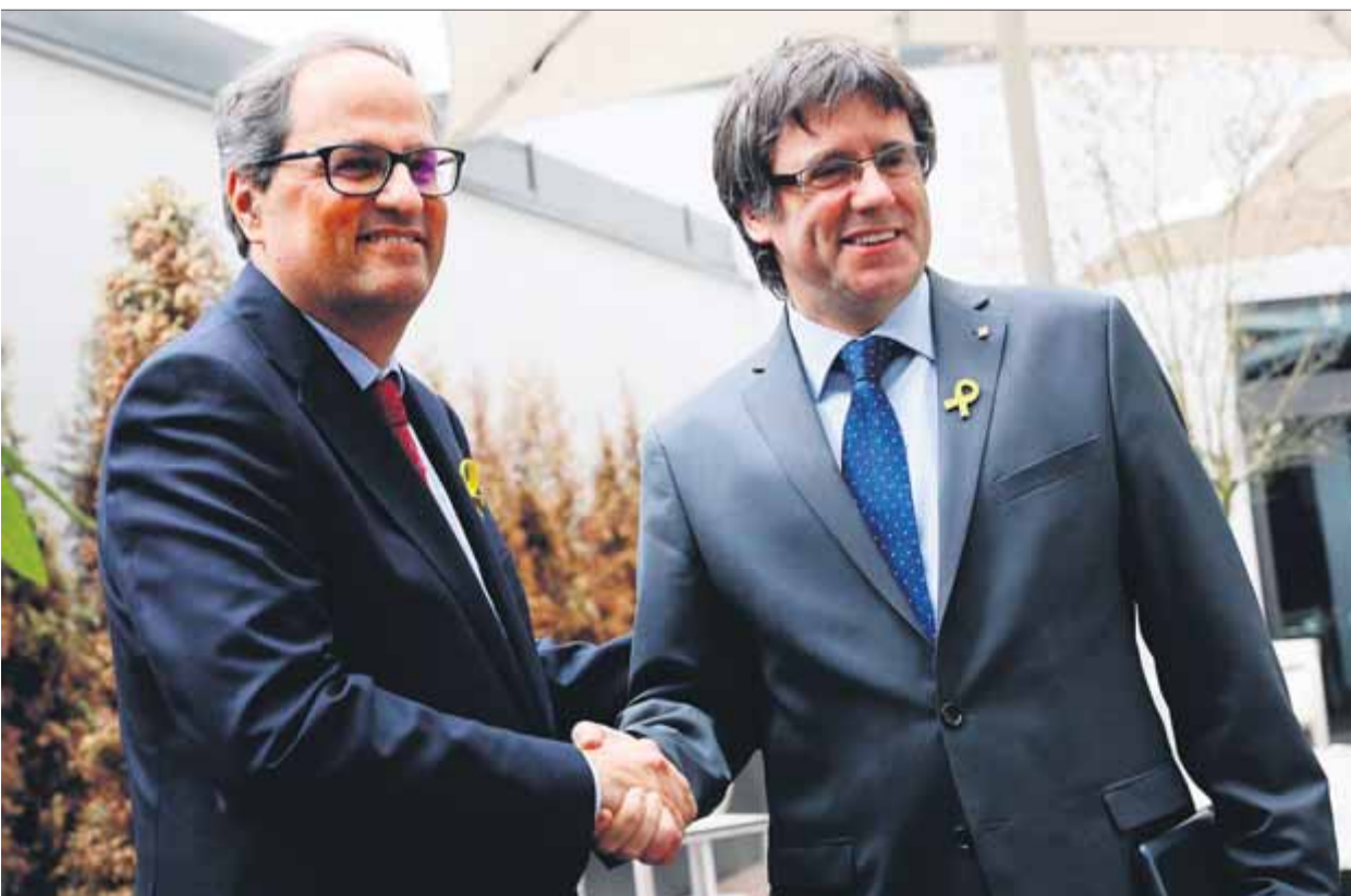
El presidents Torra i Puigdemont encaixant les mans ahir, durant la seva trobada a Berlín

RESPOSTA • El mandatari espanyol diu que rebrà Torra per "parlar dins la llei", sense concretar calendari de reunió