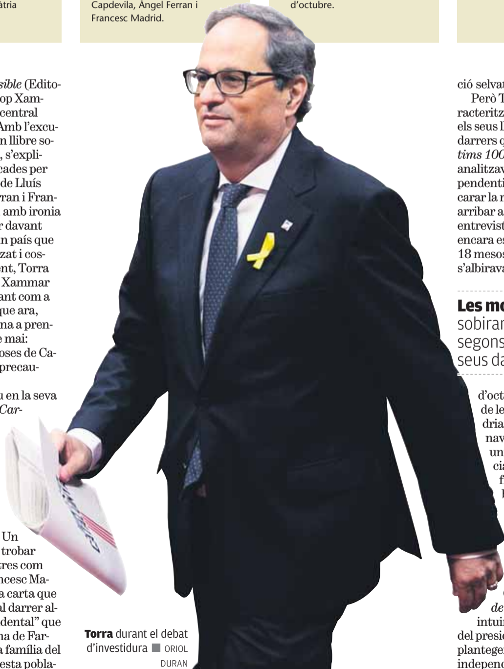
Torra durant el debat d'investidura

Un altre llibre clau en la seva vida és Honorables. Cartes a la pàtria perduda (A Contra Vent), en el qual Torra escriu a personatges polítics, d'empresa i de la societat civil que han destacat per la seva lluita per Catalunya. Un cop més hi tornem a trobar Eugeni Xammar i altres com Pompeu Fabra i Francesc Macià. També destaca la carta que dirigeix al seu avi i i al darrer alcalde republicà "accidental" que va tenir Santa Coloma de Farners –bona part de la família del president viu en aquesta pobla-