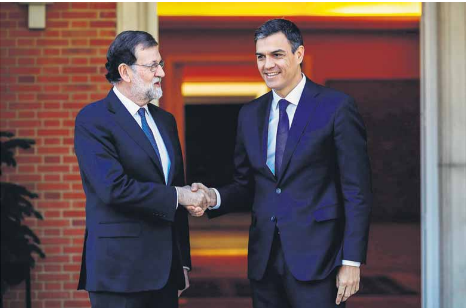
Rajoy i Sánchez es van reunir ahir al Palau de La Moncloa per abordar un futur 155 si Quim Torra passa de les paraules als fets