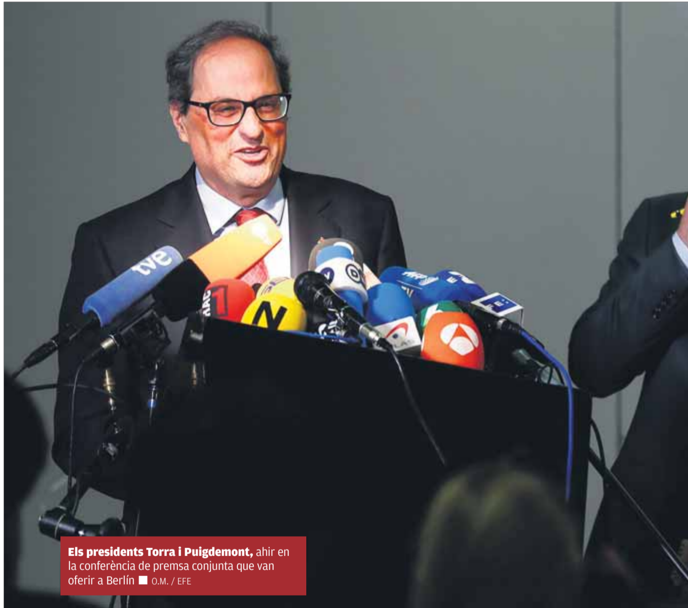
Els presidents Torra i Puigdemont , ahir en la conferència de premsa conjunta que van oferir a Berlín

Sobre la taula ara, en tot cas, les primeres prioritats del govern són la sortida dels presos polítics —"està constatat pel jutge, que diu que no els pot alliberar perquè són favorables a la independència", sostenia Torra a la tarda— i