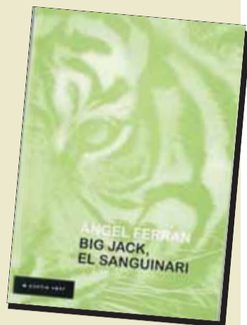
BIG JACK, EL SANGUINARI Autor: Àngel Ferran Editorial: A Contra Vent

És un dels dos primers llibres que edita l'editorial de Quim Torra, A Contra Vent, que va néixer l'any 2008 amb la voluntat de convertir-se en un referent del periodisme literari català. L'obra té com a eix central Just Cabot, que va ser un dels periodistes de referència de l'època de la República, i aplega cinquanta-quatre cartes que va escriure des de l'exili, entre el 1940 i el 1961.