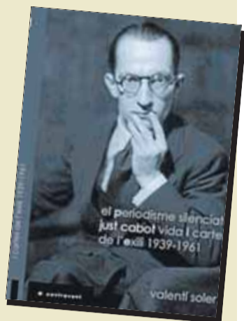
PERIODISME SILENCIAT. JUST CABOT. VIDA I CARTES DE L'EXILI. Autor: Valentí Soler Editorial: A Contra Vent

És un dels dos primers llibres que edita l'editorial de Quim Torra, A Contra Vent, que va néixer l'any 2008 amb la voluntat de convertir-se en un referent del periodisme literari català. L'obra té com a eix central Just Cabot, que va ser un dels periodistes de referència de l'època de la República, i aplega cinquanta-quatre cartes que va escriure des de l'exili, entre el 1940 i el 1961.