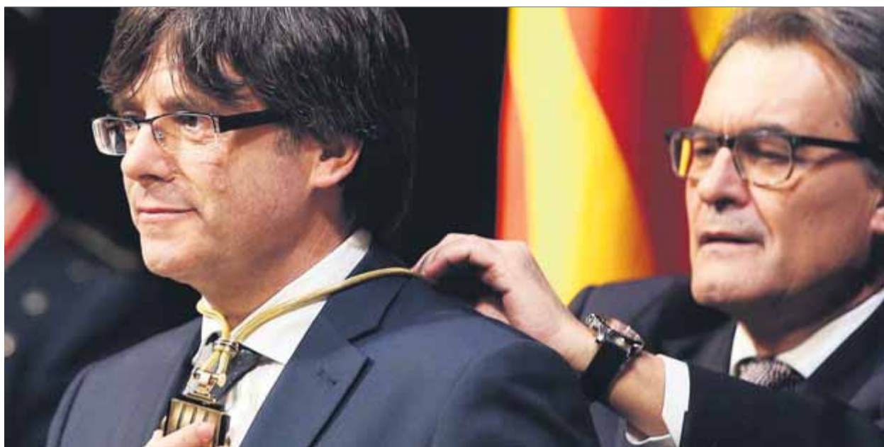
El president Puigdemont rep el medalló que va rescatar Tarradellas de mans del president Mas

Puigdemont també va aclarir les declaracions a un mitjà italià fa uns dies en què recordava que des del 27 d'octubre Torra tindrà la potestat de convocar noves eleccions "si les circumstàncies ho fan recomanable". "D'aquí no es pot deduir que n'hi haurà d'anticipades, i que no sigui una legislatura de quatre anys", subratllava. "Volem que duri fins al final, serà el millor senyal que les coses agafen la via de la democràcia", conclouia. ■