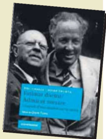
ESTIMAT DOCTOR/ADMIRAT MESTRE Autors: Pau Casals i Josep Trueta Editorial: A Contra Vent