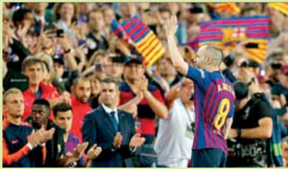
Iniesta saluda el Camp Nou en ser substituït

El Barça guanya la Real Sociedad (1-0) i acomiada Iniesta de la millor manera