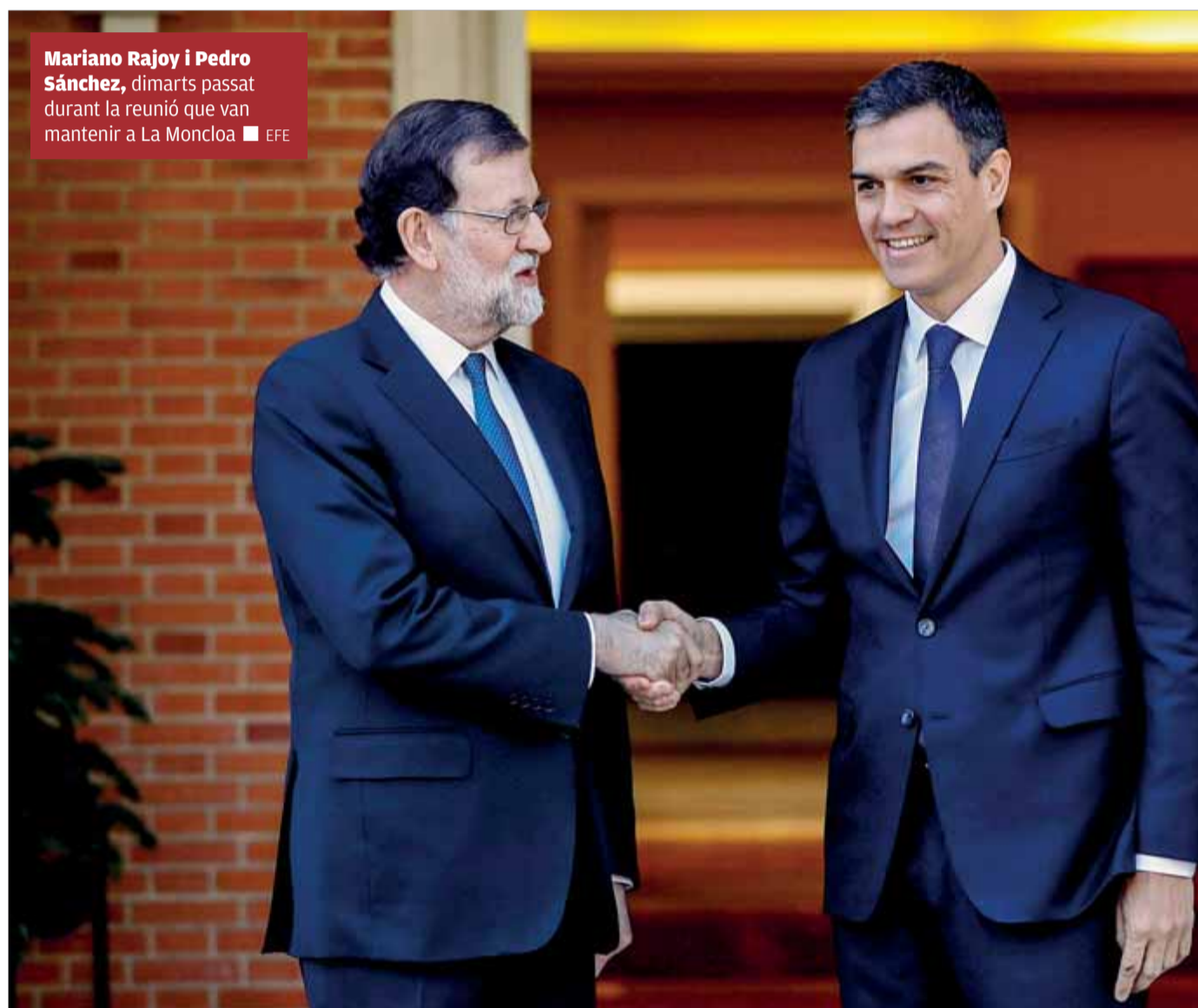
Mariano Rajoy i Pedro Sánchez, dimarts passat durant la reunió que van mantenir a La Moncloa

Malgrat que des d'alguns àmbits jurídics s'hagi indicat que la mesura pot implicar incórrer en responsabilitats disciplinàries i penals, fonts properes a La Moncloa expressaven la convicció que la congelació del decret és legal, alhora que insistien que es mantindrà el temps que es consideri necessari. A partir d'ara, esperen que Torra mogui fitxa rectificificant els nomenaments o bé portant l'Estat davant la justícia, un fet que aniria allargant el 155 perquè la intervenció no decau fins que no hi hagi un govern en plena efectivitat. Entremig, l'executiu espanyol va guanyant temps en espera que sigui el mateix Tribunal Suprem el que resolgui el litigi impulsant la inhabilitació dels