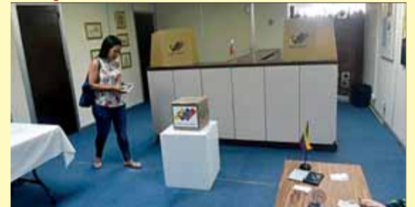
Un moment de les votacions d'ahir ■ AFP