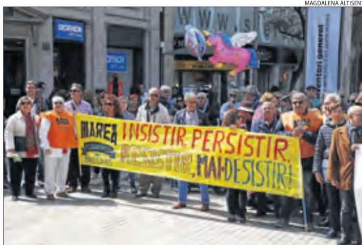
La Marea Pensionista del Pallars es va afegir també a la convocatòria.