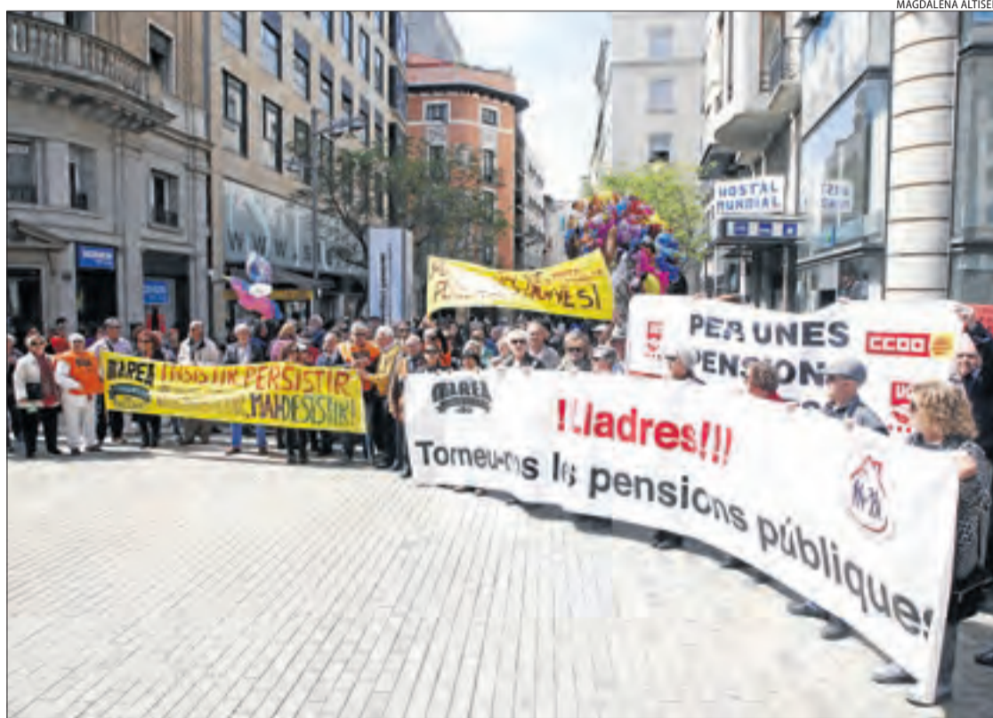
Concentració de la Marea Pensionista de Lleida, ahir, a la plaça Sant Joan.