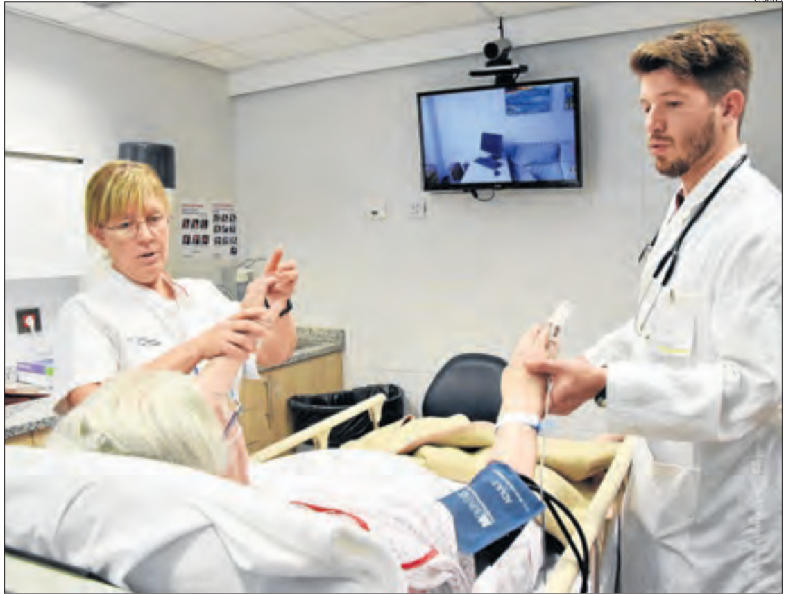
La Seu és centre de referència del Teleictus i pot valorar pacients de forma conjunta amb l'Arnau.

Segons López, des de l'inici de l'estudi hi han participat més de 500 pacients, tres dels quals traslladats des de la Seu d'Urgell a Barcelona. En els propers dies es publicarà una primera anàlisi de la investigació a la revista de medicina internacional Stroke .