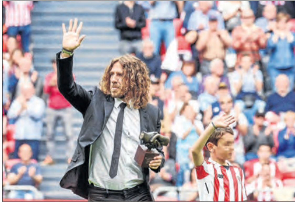
Carles Puyol, ahir a San Mamés amb el trofeu One Club Player que li va entregar l'Athletic.