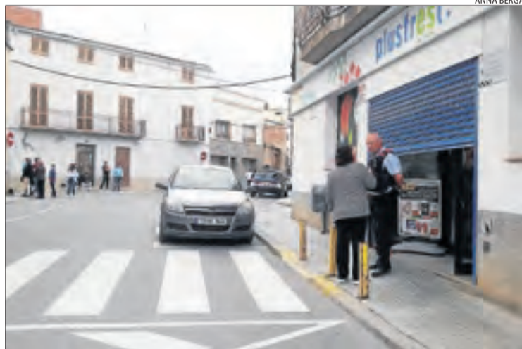
Els Mossos d'Esquadra es van presentar al lloc dels fets.

LINYOLA | Els Mossos d'Esquadra investiguen un intent de robatori que es va dur a terme ahir en un supermercat del municipi de Linyola. Els fets van succeir ahir a les cinc de la tarda, quan un desconegut va irrompre a l'esmentat establiment que es troba al carrer Pi i Margall i va anunciar que anava a atracar el local i va amenaçar un dels seus empleats. El supermercat comptava en aquell moment amb diversos clients que es van espantar i van xisclar. Tot apunta que l'home, que anava a cara descoberta, no va aconseguir robar res i va fugir. Els responsables van trucar els Mossos d'Esquadra immediatament, que es van presentar al lloc dels fets per prendre declaració a les persones implicades i també revisar els enregistraments de càmeres de seguretat d'aquest local. Di-