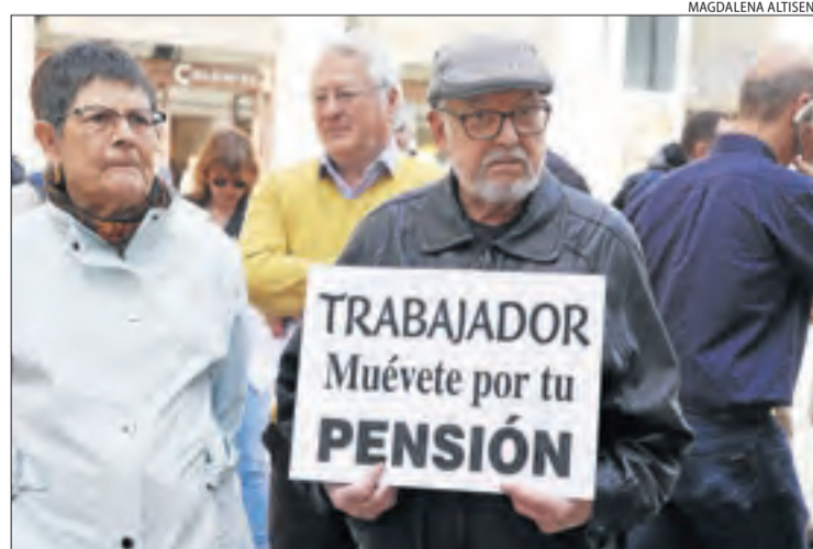
Els manifestants van portar cartells reivindicatius.