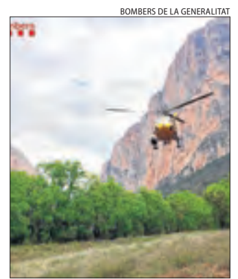
Moment del rescat.