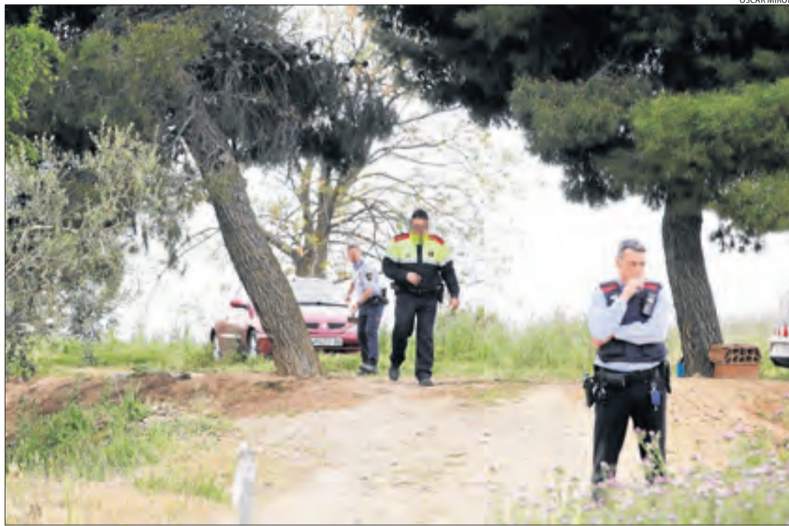
Agents d'investigació dels Mossos es van desplaçar al lloc de l'accident.

l'ocorregut, fins al lloc dels fets s'hi van desplaçar els Bombers de la Generalitat, patrulles dels Mossos d'Esquadra, agents municipals d'Alpicat i sanitaris del Sistema d'Emergències Mèdiques (SEM), que ja no van poder fer res per salvar la vida de l'ancià.