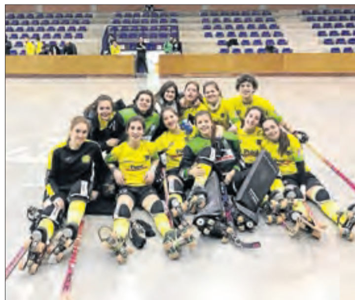
Les jugadores del Vila-sana, que també competeix a l'OK Lliga.