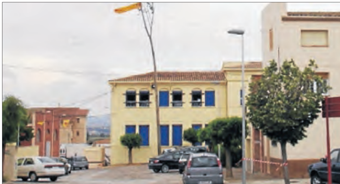
Imatge de la plantada del xop de l'any passat a Valfogona de Balaguer.

Tots els preparatius compten amb les mesures de seguretat necessàries i a la zona on es planta el pollancre s'estableix una zona acordonada per evitar accidents. Tanmateix, la mala