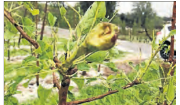
Un camp de peres conference al terme de Balaguer.