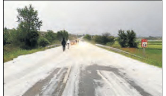
La carretera C-13 a Camarasa, tallada pel granís.