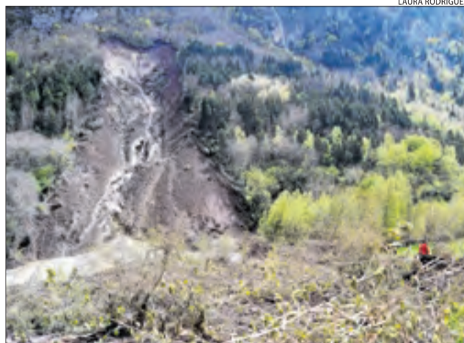
La ribera de Valarties, coberta per la terra i el fang.

La pedra també va danyar desenes d'hectàrees de fruiters la Noguera i de cereal, especialment a Balaguer, Gerb, Albesa, Os de Balaguer i Camarasa. D'altra banda, a partir de les tres de la tarda, les temperatures van descendir en picat fins als 17 graus en llocs com Vielha, que van passar dels 20 graus al migdia als 3 a les nou de la nit. Al pla també van descendir entre els 8 i els 10 graus. La cota de neu es va situar als 1.500 metres i va nevar a la Bonaigua i Bagergue.