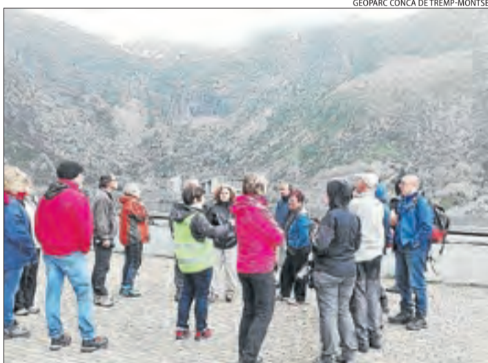
GEOPARC CONCA DE TREMP-MONTSEC

la revolució que van provocar les primeres hidroelèctriques de Catalunya a la vall Fosca, així com l'explotació de minerals com l'urani. Es van fer tres parades al congost d'Erinyà, a les mines de Castell i a la presa de Sallente. La pluja va obligar a finalitzar la ruta al museu hidroelèctric de la Torre de Capdella.