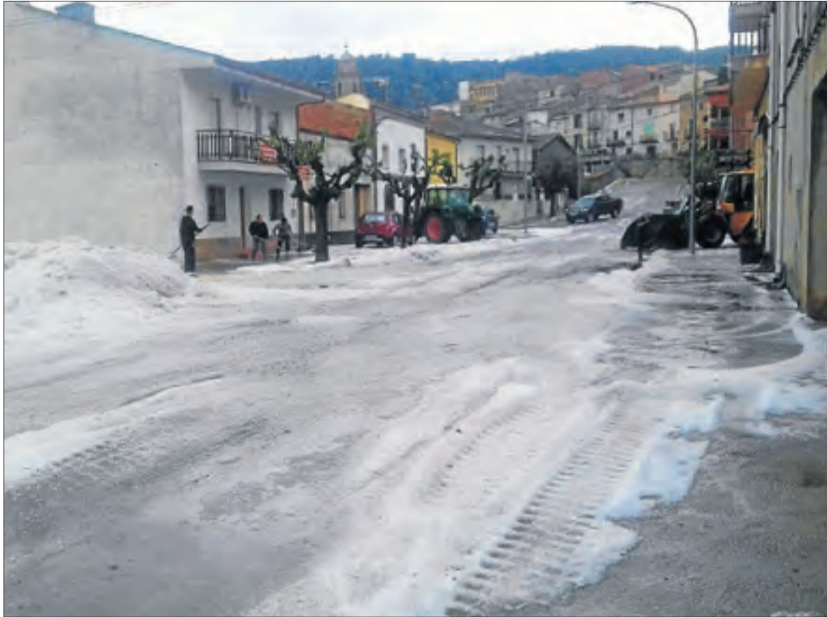
Els carrers d'Os de Balaguer van quedar coberts per la calamarsa, on es van acumular fins a 15 centímetres.