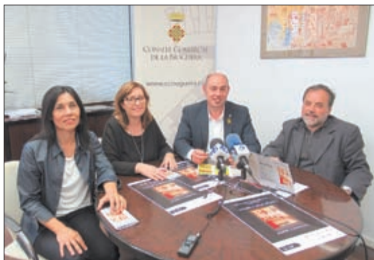
La presentació de les jornades d'estudis a Balaguer

A més de les ponències i els debats, s'ha incorporat al programa un concert de música amb tast de vins obert a tothom el dia 12 de juliol a les 19.30h, al claustre del Consell Comarcal de la Noguera; i una sortida de treball de camp el dia 13 de juliol a l'ermita de la Pertusa, la col·legiata