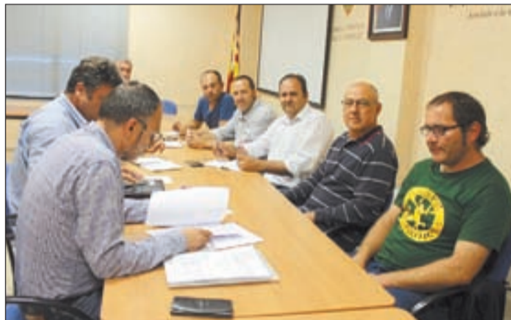
La reunió del Consell Comarcal amb els sindicats

Això comporta que els pagesos deixin de cobrar una subvenció de 25 a 60 euros per hectàrea, depenent del cultiu. I a més a més, els serà més difícil aconseguir ajudes, ja que el fet de ser considerat zona desafavorida suposa un increment de possibilitats de rebre-les, segons expli-