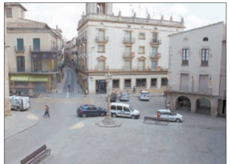
La plaça Major de la capital de l'Urgell a dia d'avui

fa més de dos dècades que organitzen el curs d'estiu de la Càtedra d'Estudis Medievals Comtat d'Urgell amb la voluntat d'estudiar i difondre la història medieval de la Noguera.