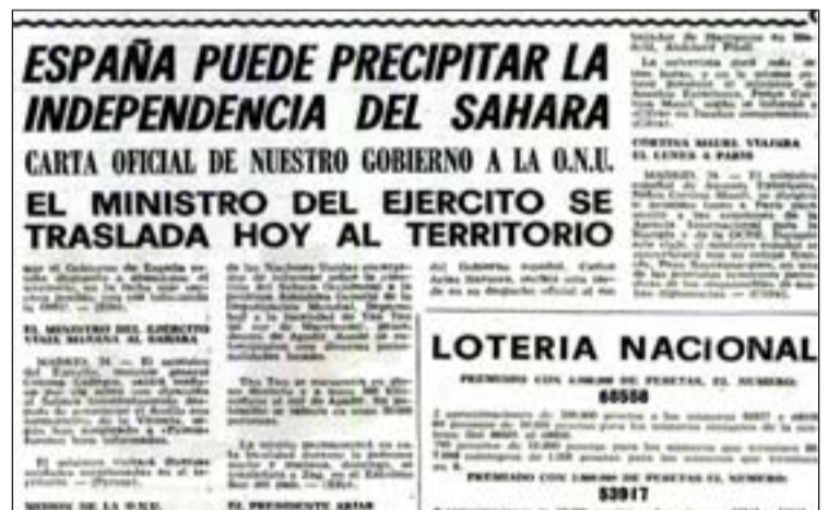
FOTO: / A Cortina li va tocar gestionar la crisi del Sàhara i la Marxa Verda