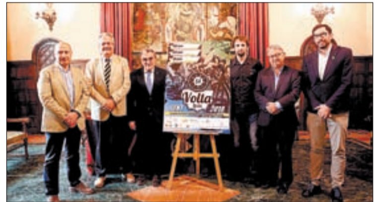
La presentación del acontecimiento