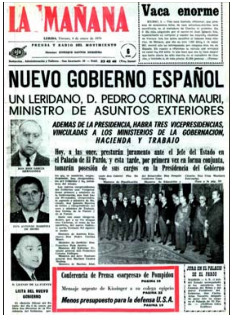
FOTO: / Portada de La Mañana del 4 de gener de 1974, amb aquell govern