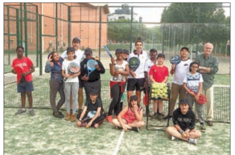
Los alumnos con sus monitores durante la actividad