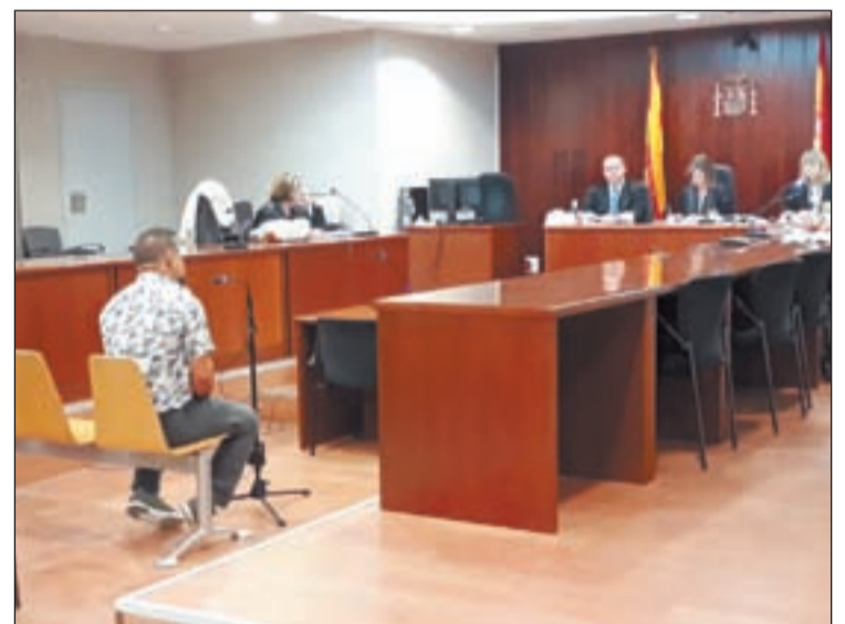
La vista oral es va celebrar ahir a l'Audiència de Lleida

Per la seva part, l'home, L. A. C., va negar els fets i va manifestar que potser el va denunciar "perquè podria estar gelosa, ja que sempre volia estar amb la seva àvia. De fet, el meu germà em va dir que volien diners meus". A més, l'àvia va indicar que "la nena és molt imaginativa. No em crec aquests episodis".