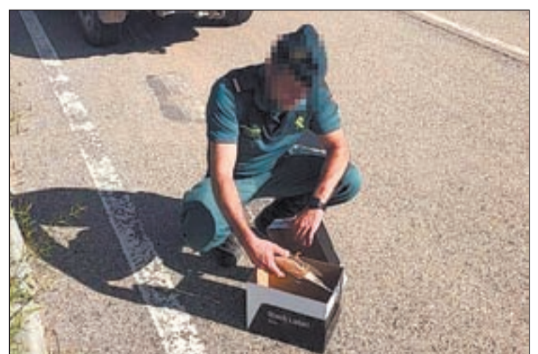
Moment en el que rescaten el xoriguer comú

ferides on hi pot haver afectació d'algun òrgan vital. Per aquest motiu, es va prendre la decisió de mobilitzar l'helicòpter medicalitzat. Això no obstant, cal esmentar que finalment els facultatius de Mollerussa van decidir traslladar el ferit de 30 anys en ambulància fins a l'Hospital Arnau de Vilanova de Lleida.