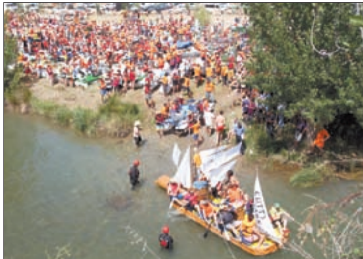
Imatge de l'edició passada de la Transsegre

Ara bé, l'organització de la Transsegre va advertir ahir, durant la presentació del cartell d'enguany, que si el nivell de l'aigua augmenta s'haurien de dur a terme alguns canvis. El concerts es traslladarien al pavelló Impacsa i se suspendria la segona etapa de la baixada, que s'ha de celebrar el diumenge 15 de juliol i va de Gerb a Balaguer. A banda de l'augment del cabal, aquesta segona etapa també es podria suspendre en cas que quan el cabal baixi no hi hagi prou temps o els recursos necessaris per assumir les tasques de neteja del riu.