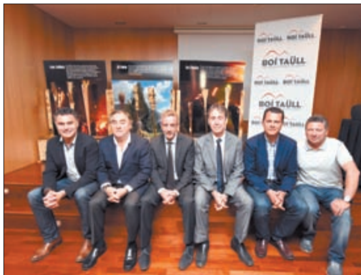
La presentació de la temporada d'estiu de Boí Taüll

Des de Boí Taüll advertien que el creixement del turisme dependrà del clima, sobretot els caps de setmana. Cal recordar que durant la temporada d'esquí d'aquest hivern el mal temps els dissabtes i diumenges va jugar una mala passada a les estacions, fent dis-