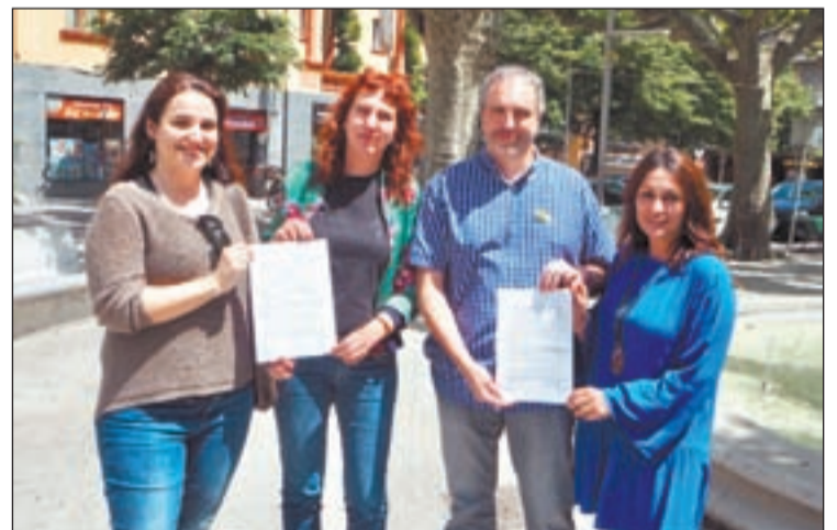
Després de saber l'arxivament de la causa

La comissió espera que l'arxivament de la causa espera que faci reflexionar, rectificar i exigir les disculpes públiques dels qui l'han motivat. En aquest sentit es refereixen especialment a "tots aquells polítics i mitjans de comunicació que no van tenir cap inconvenient en assenyalar públicament al professorat".