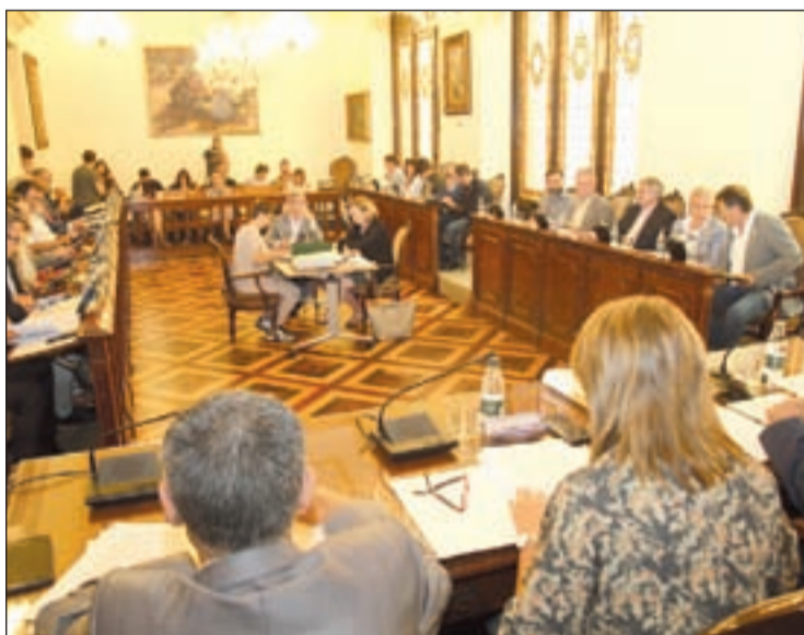
El PDeCat van ser els únics que hi van votar en contra