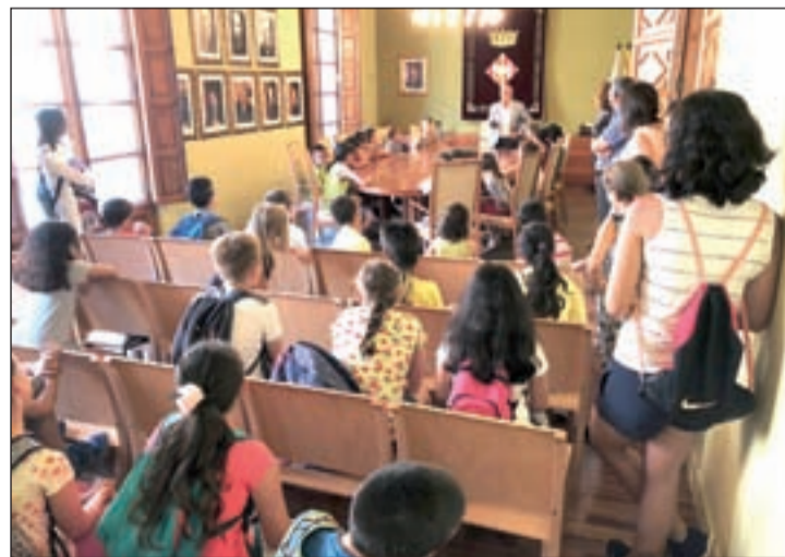
Els alumnes durant la seva visita al consistori

La visita dels alumnes, que van conèixer tots els departaments ubicats a l'edifici consistorial, també els va permetre pujar