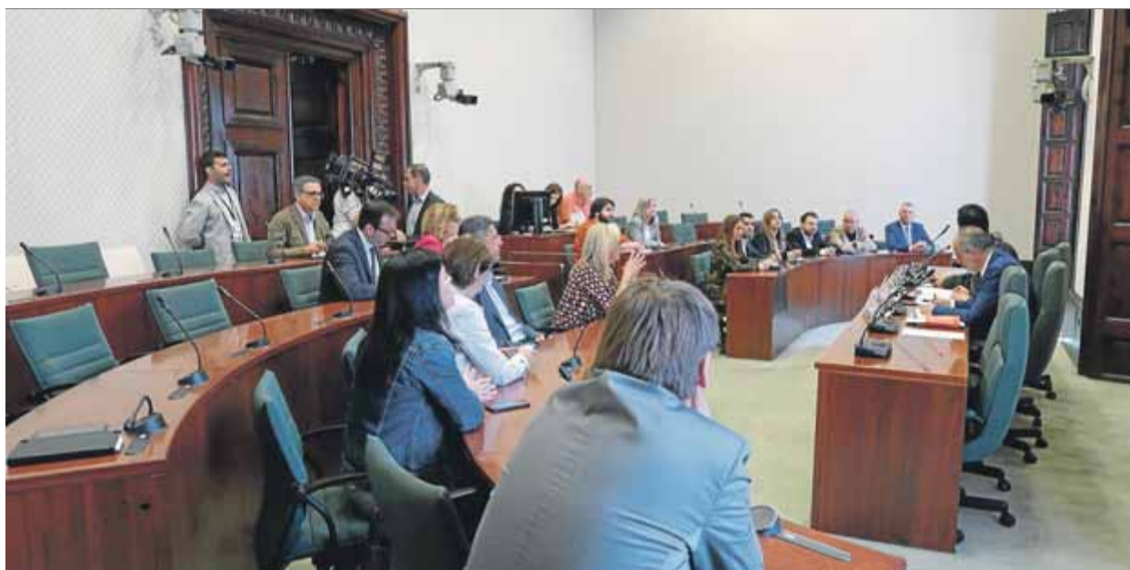
Constitució de la comissió d'Afers Institucionals, ahir, en una de les sales de la cambra catalana ■ PARLAMENT