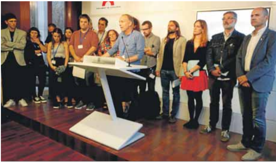
La representació de la comunitat educativa va atendre els mitjans al Parlament

“per desacreditar el sistema educatiu català, atribuint-li una funció adoctrinadora i promotora d’una divisió inexistent”.