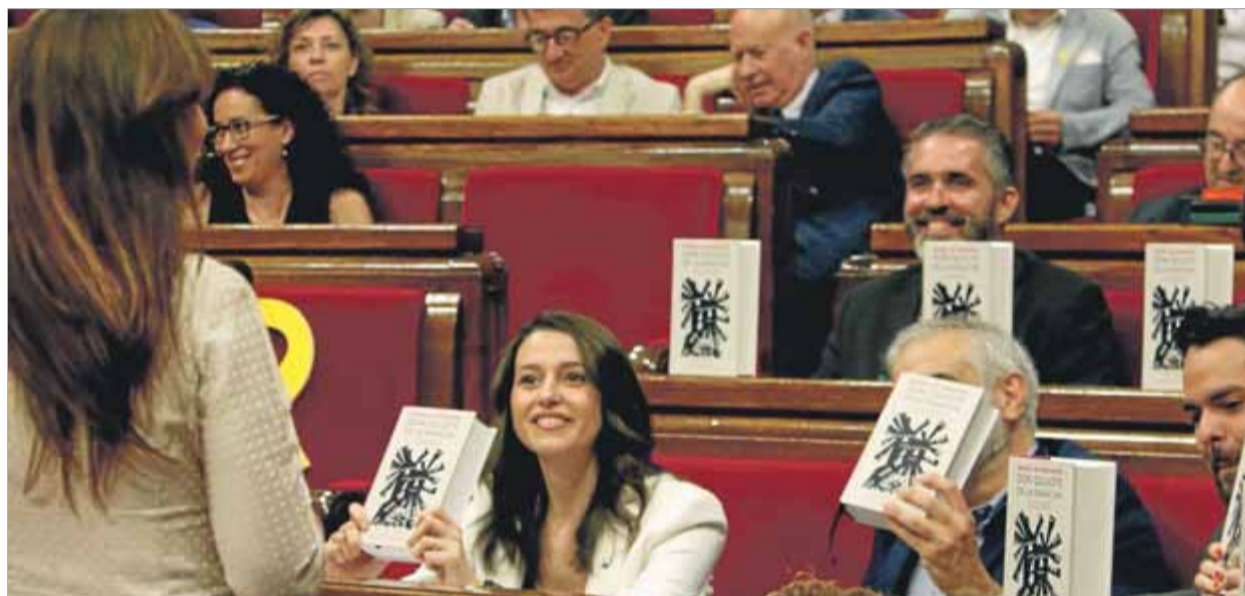
La consellera Laura Borràs, en contestar ahir a la riallera bancada de Ciutadans, que mostrava tot d'exemplars del 'Quixot'