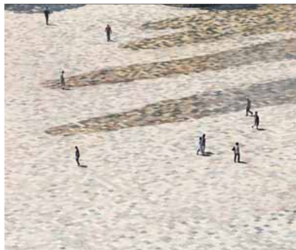
La plaça Skanderbeg de Tirana ha guanyat el Premi Europeu de l'Espai Públic Urbà promogut pel CCCB ■ BLERTA KAMBO

CCCB que, arran de la seva exposició La reconquesta d'Europa (1999), va decidir crear un observatori permanent de les ciutats europees. Hi col·laboren centres d'arquitectura de Londres, París, Viena i Ljubljana i té un comitè d'experts format per 36 especialistes de tot el con-