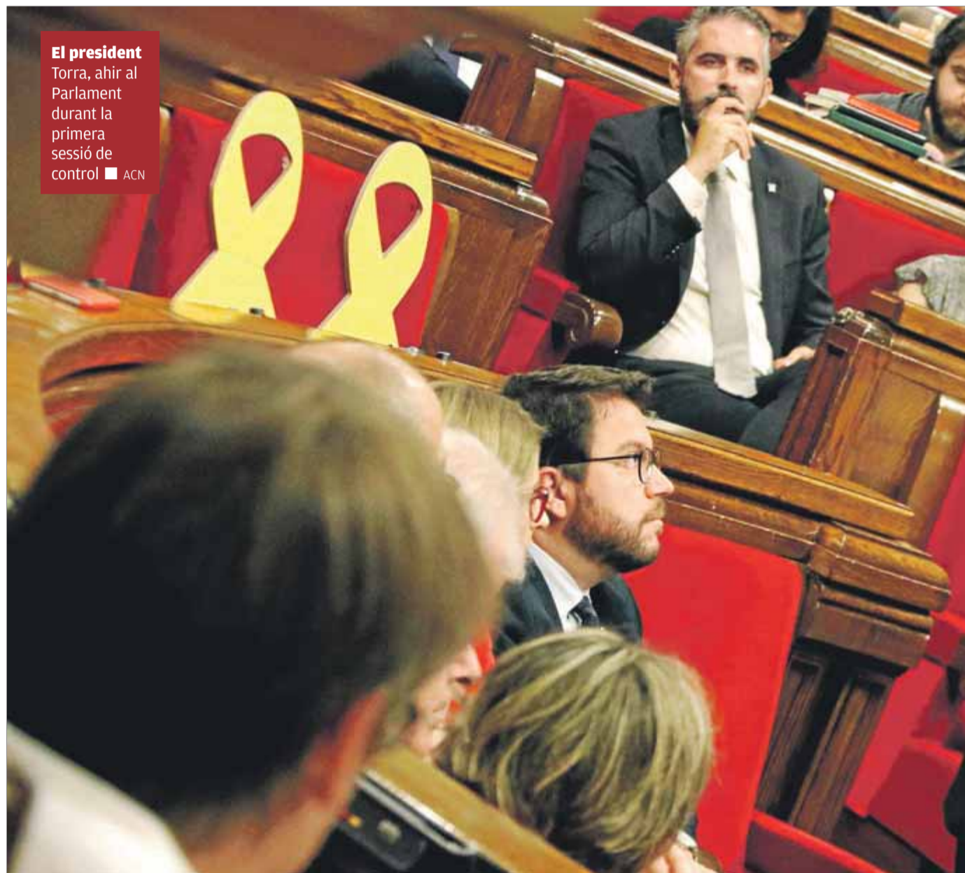
El president Torra, ahir al Parlament durant la primera sessió de control

La resposta a la carta, però, no es va fer esperar. A mitja tarda, La Zarzuela notificava que, d'acord amb l'article 64.1 de la Constitució, donava trasllat de l'ofertament al president del govern espanyol, Pedro Sánchez, que havia de referendar la proposta. Tanmateix no va ser així, i una hora més tard, des del gabinet de presidència de La Moncloa es descartava una reunió bilateral entre el monarca i el president. Segons l'entorn de Pedro Sánchez, tots tres coincidiran en l'acte institucional de la inauguració dels Jocs del Mediterrani, però “la reunió política serà entre Sánchez i Torra”. El 9