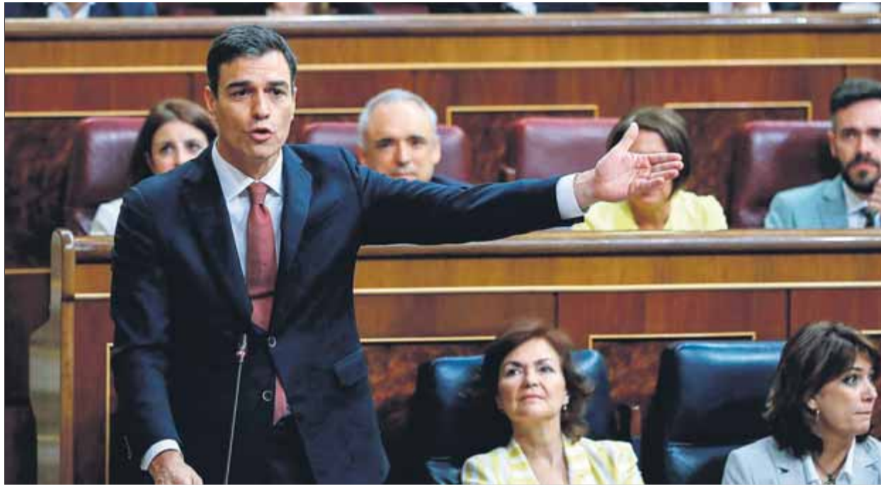
El president espanyol, Pedro Sánchez, ahir durant la seva primera sessió de control al Congrés

El portaveu del PP presentava com a proves la disposició mostrada pel PSOE a modificar la Constitució; a “tergiversar les sentències del TC” —en al·lusió a la de l'Estatut—; a fer “cessar el control” dels comptes de la Generalitat;