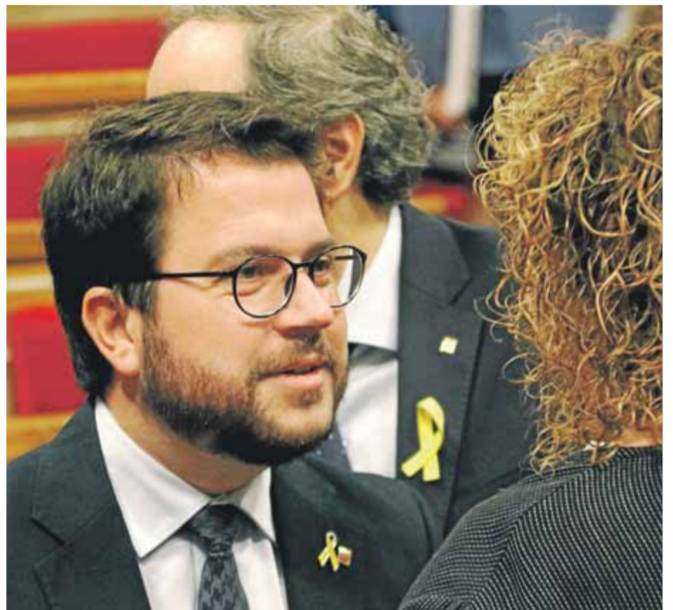
El vicepresident Aragonès en un recés durant el ple del Parlament, ahir

El vicepresident del govern, el republicà Pere Aragonès, va reafirmar que l'objectiu compartit pels dos socis d'executiu és “la República catalana” però va deixar clar que s'hi vol arribar com s'ha fet a Escòcia pel que fa al Regne Unit o al Quebec pel que fa al Canadà, tot adoptant “els canvis que s'hagin de fer en l'àmbit de la sobirania” i del marc jurídic i amb “un gran consens” i