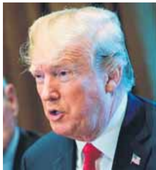
Donald Trump, ahir

Brussel·les convoca Alemanya, França, Àustria i els països del sud per debatre diumenge sobre la crisi migratòria