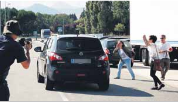
Sortida de tres dels joves de la presó de Pamplona