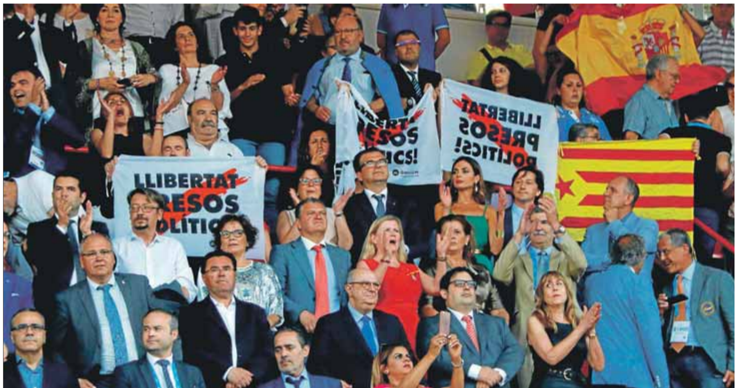
Durant la cerimònia, el públic va exhibir banderes espanyoles, estelades i també pancartes per la llibertat dels presos polítics

No va ser fins passat el migdia que Quim Torra va confirmar la seva presència en l'acte d'inauguració dels Jocs Mediterranis. Ho va fer a través d'una declaració institucional des del Palau de la Generalitat. "Aquests Jocs es fan a Tarragona, a Catalunya, i s'han pagat des del nostre país. Hi serem perquè és ca-