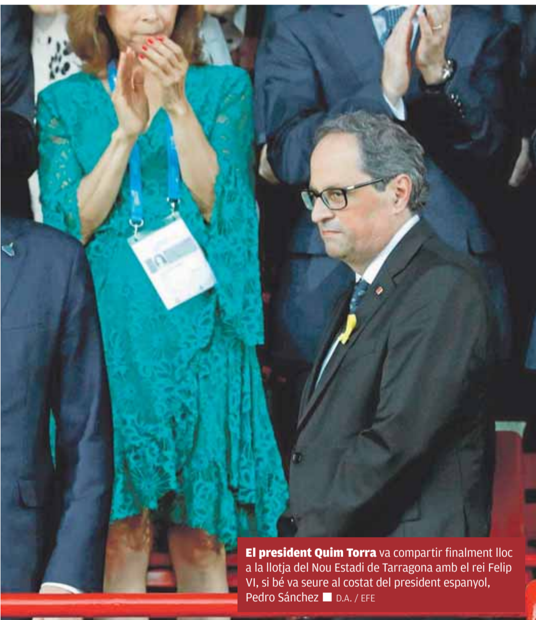
El president Quim Torra va compartir finalment lloc a la llotja del Nou Estadi de Tarragona amb el rei Felip VI, si bé va seure al costat del president espanyol, Pedro Sánchez