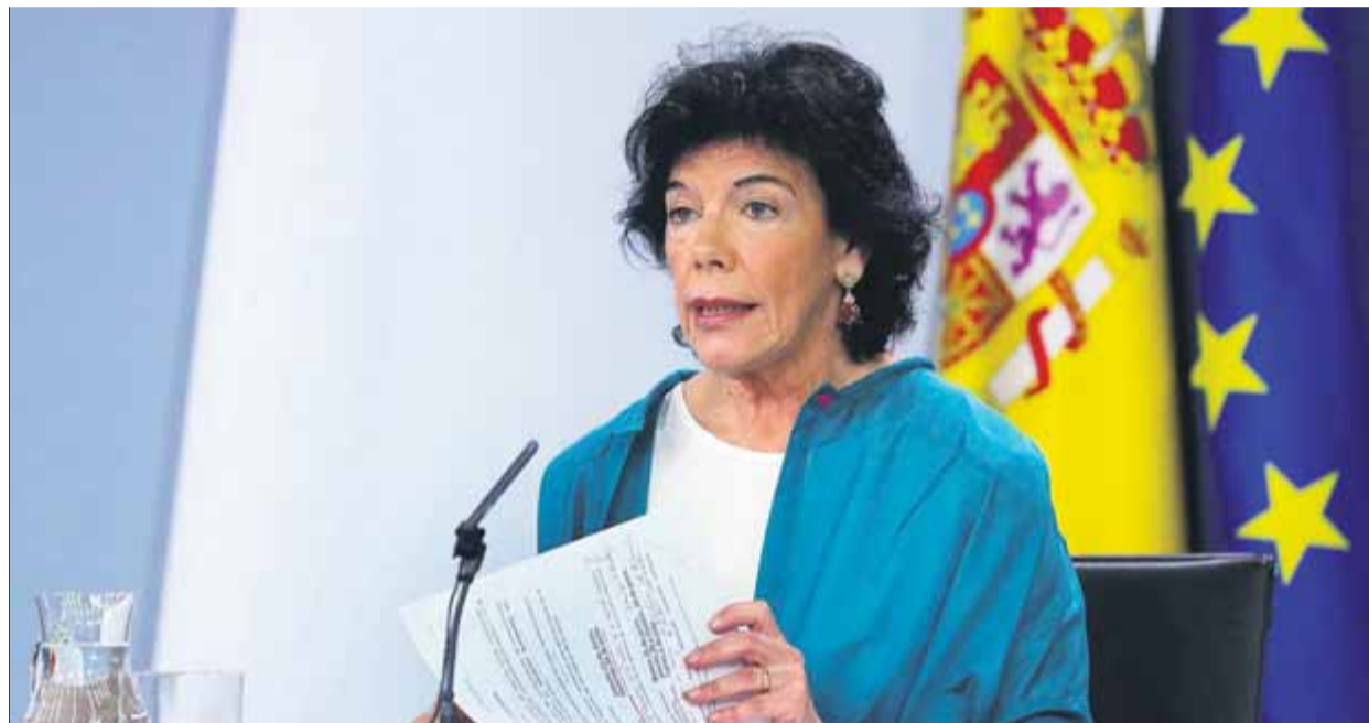
La portaveu del govern espanyol, Isabel Celaá, ahir en la roda de premsa posterior al Consell de Ministres

Tot i així, des del govern del PSOE s'evitava polemitzar sobre els dubtes que havia expressat Torra envers la idoneïtat de la seva presència anit a Tarragona pel fet que Felip VI no s'havia disculpat per aquell discurs i insistia en la tesi que La Moncloa a hores d'ara es manté en "el camí de la distensió". I, en aquest punt, afegia que confia que hi hagi "recipro-