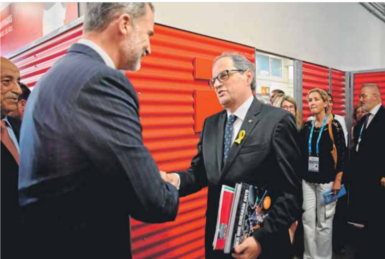
El president Torra lliurant al rei espanyol l'informe del Síndic i un llibre de fotografies de l'1-0

FET • Lliura l'informe del Síndic sobre la violència de l'1-0 a Felip VI mentre el govern del PSOE defensa el discurs del 3-0