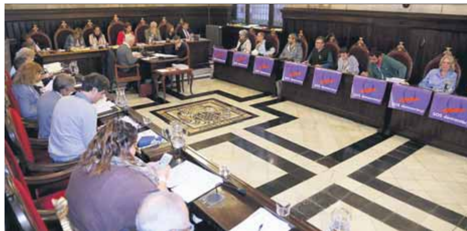
Vista del ple de Girona de l'octubre passat en què es va declarar el rei no grat