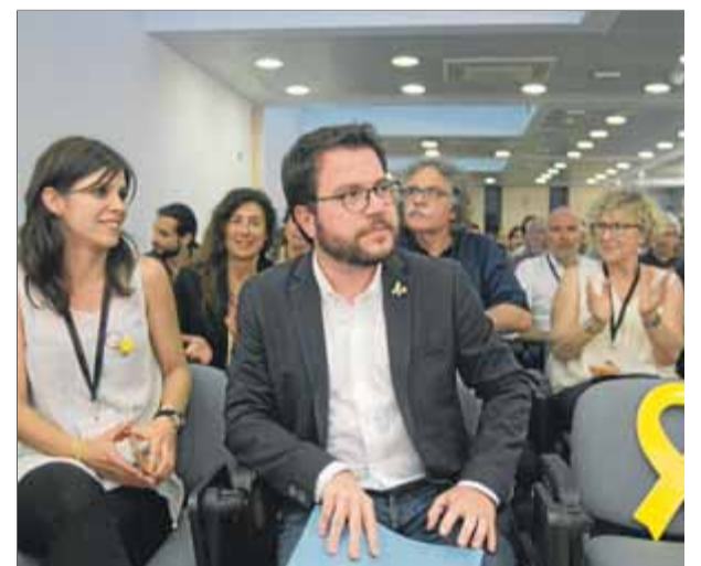
Pere Aragonès va obrir ahir el consell nacional d’ERC, que va aprovar els comptes anuals del partit del 2017

diàleg ara, però va avisar que, “si no té com a objecte central l’exercici de l’autodeterminació, algú s’estarà equivocant molt”. El vicepresident ja va dir que ho posaran sempre sobre la taula, i va exigir a l’Estat que respecti el principi que “cal poder fer política a Catalunya sense por de la repressió”. ■