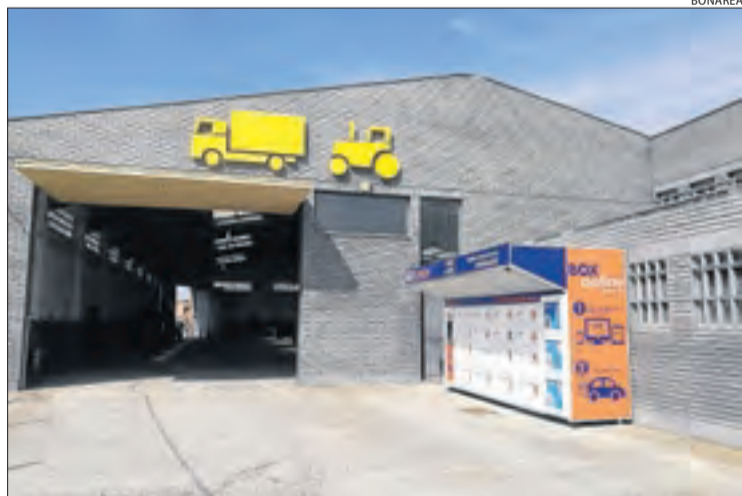
El punt de recollida de BonÀrea que s'ha instal·lat a Balaguer.