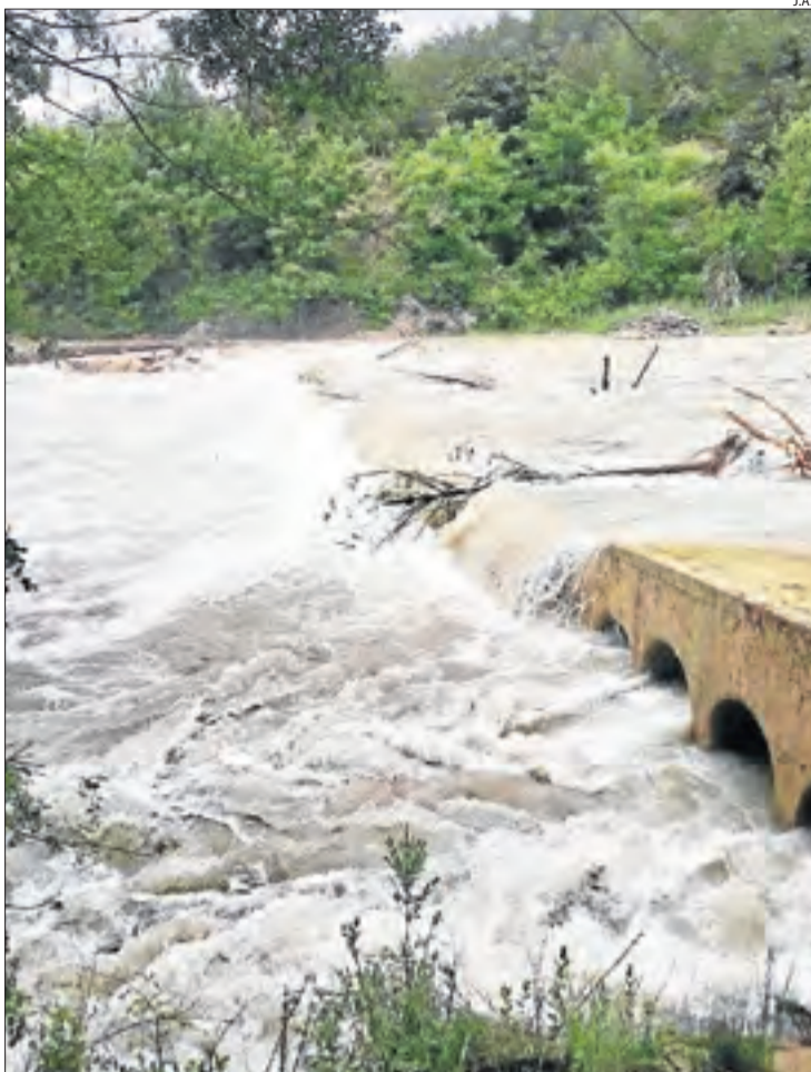
Un dels accessos a Tercui, a Tremp, que van tornar a inundar-se.

■ L'Agència Estatal de Meteorologia va informar ahir que les intenses pluges del mes de maig passat van ser de rècord a Lleida ciutat. En aquest sentit, el dia 28 es van registrar fins a 42 litres per metre quadrat, amb la qual cosa va superar el valor més alt des del 1983 (que va ser de 32 litres per metre quadrat el 1999).