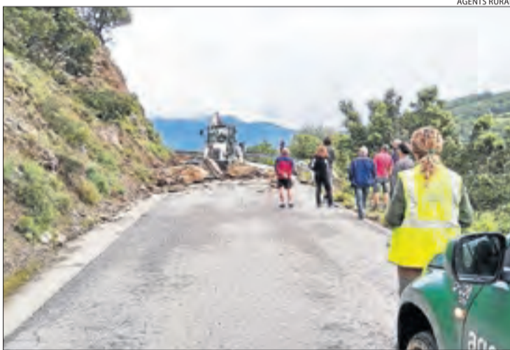
El desprendiment a la carretera de Castellbò.