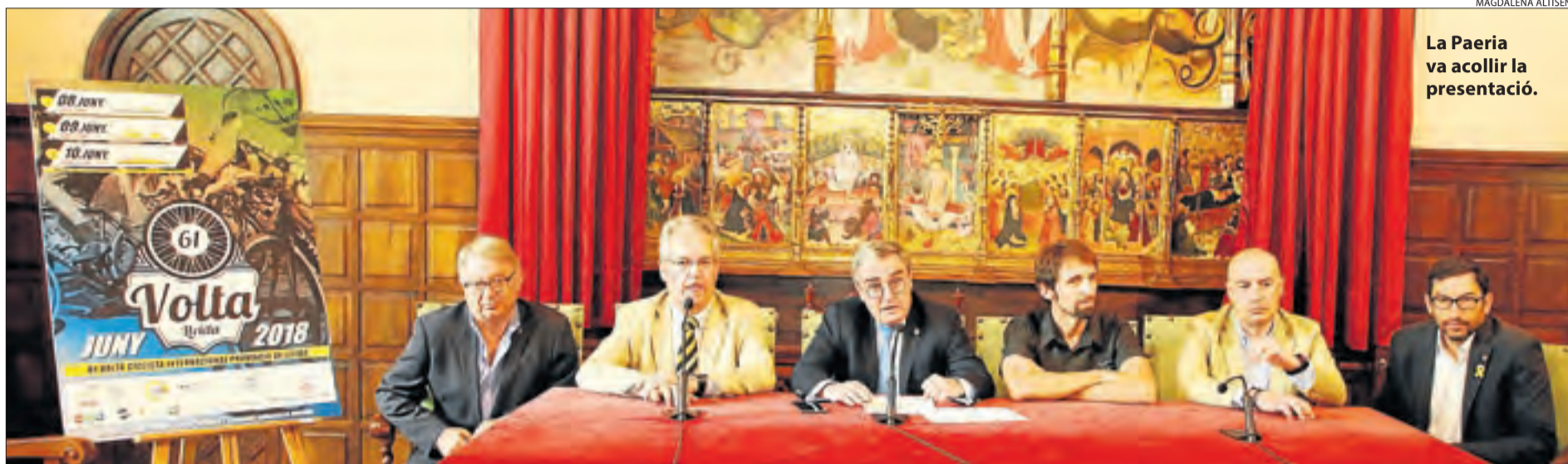
La Paeria va acollir la presentació.