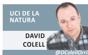
UCI DE LA NATURA

amics de La Manada malgrat va ser enxampat per la Policia Nacional intentant renovar el seu passaport tot i tenir-lo retirat. Mentre els jutges mediten si volia escapar-se o no podrà, si ho volgués, acudir demà als Sanfermins, on fa dos anys van deixar malmesa una noia abusant d'ella en grup. Dues llibertats, però ben diferents, que tornen a posar en tela de judici –mai millor ben dit– l'homologació de la justícia espanyola en el marc europeu. Mentre qui ha fet un mal físic demostrat gaudeix de tots els beneficis possibles, qui exerceix la seva llibertat d'expressió –independentment de si agrada o no el que diu– és considerat com un terrorista.