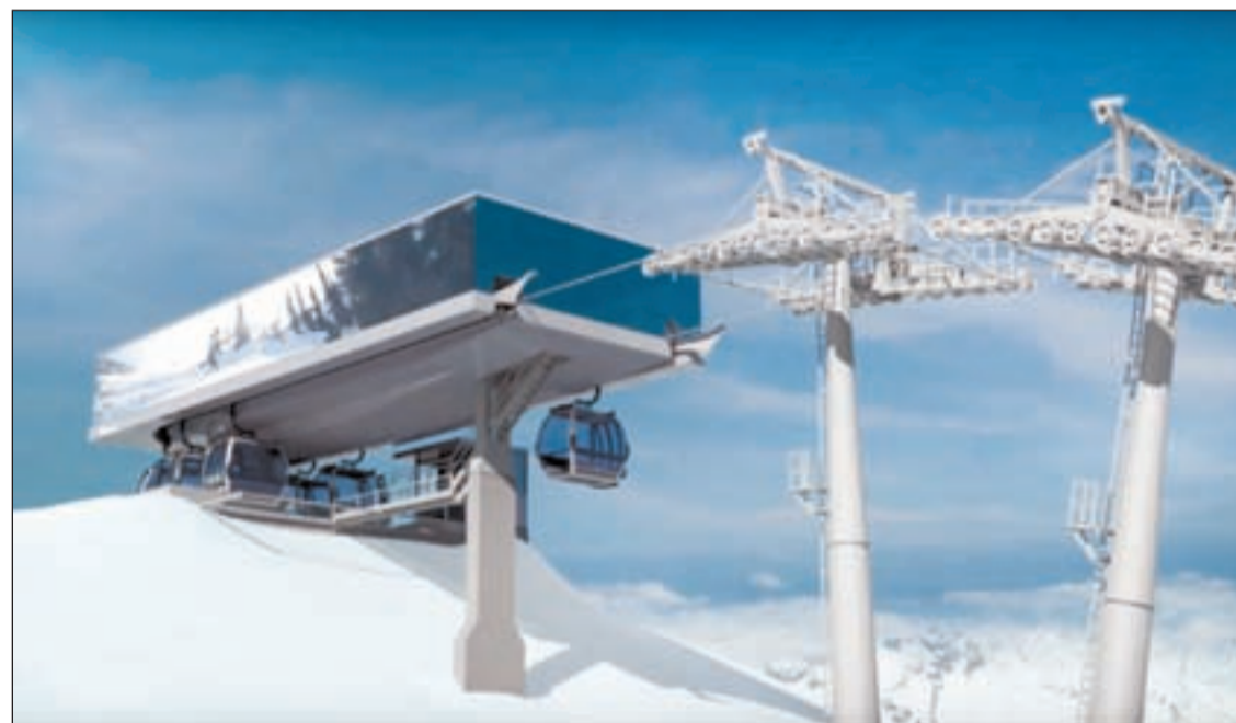
FOTO: / Fabricat a Àustria, així serà el nou telecabina de l'estació d'esquí d'Ordino-Arcalís

L'arribada dels Viladomat a Ordino-Arcalís s'ha traduït en la propera instal·lació d'un telecabina