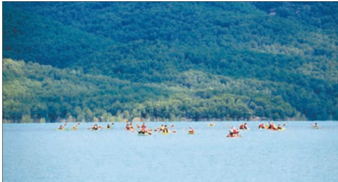
FOTO: Laura Alcalde (ACN) / Diversos caiacs navegant pel pantà de Canelles direcció al Congost de Mont-Rebei

Una de les empreses és Montsec Activa, situada a l'embassament de Canelles, a la Noguera Ribagorçana, que va poder treure les embarcacions ahir. Enric Mestre, guia de l'empresa, va explicar que l'obertura els va salvar de "tenir pèrdues importants". A més, va afegit que, "tot i que han tingut algunes anul·lacions, les reserves s'han pogut mantenir". Mestre va dir que tot i que l'accés a peu està tancat "l'esllavissada ja està solucionada a l'espera que es facin la neteja".