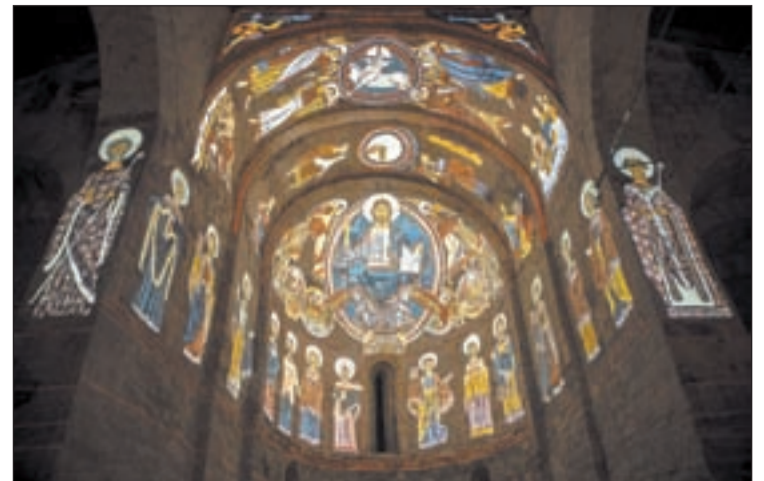
Fins ara calia fer reserva per gaudir del mapping