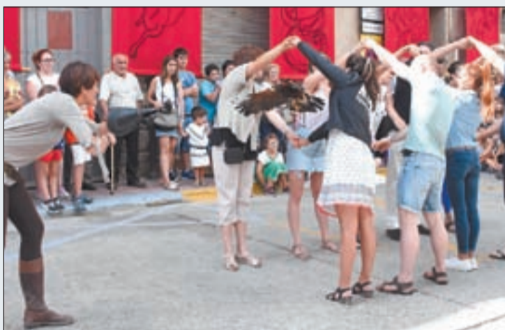
En les imatges, una parada del mercat Romà, una representació històrica d'un combat entre lluitadors i un moment de l'espectacle al Portal de l'Àngel amb aus rapinyaires ensinistrades