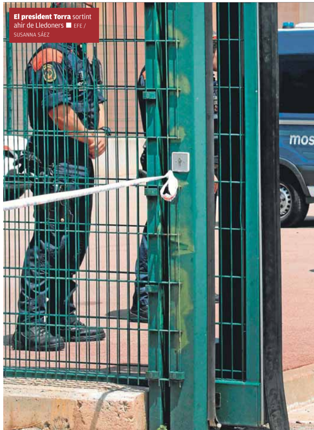
El president Torra sortint ahir de Lledoners

D'altra banda, l'extradició tampoc no seria immediata. La defensa del president la pot recórrer en