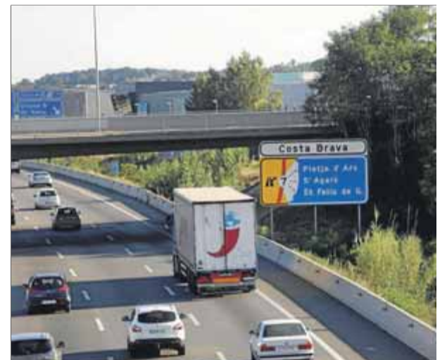
Les accions està previst fer-les en els ponts que travessen l'AP-7 dins les comarques gironines ■ Q.PUIG

travessa les comarques gironines, durant el mes d'agost de l'any passat, i més concretament de Montmeló a la Jonquera, hi va haver una intensitat mitjana diària de 67.000 vehicles. Al mes de juliol, aquesta xifra va ser una mica més baixa, de poc més de 64.000 vehicles. ■