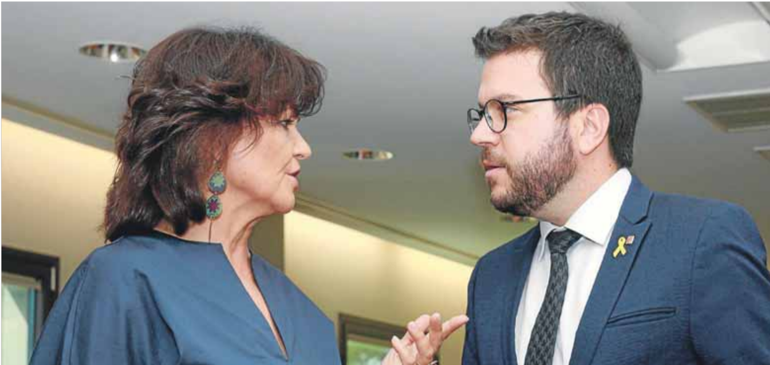
La vicepresidenta de l'executiu espanyol, Carmen Calvo, i el vicepresident del govern català, Pere Aragonès, ahir a Madrid

Després de reunir-se amb Calvo i Montero, el vicepresident admet una mínima dosi d'optimisme pel que fa al diàleg entre governs ■ Estat i Generalitat es trobaran en la bilateral abans de vacances