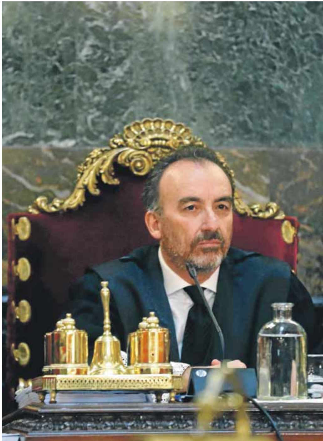
Manuel Marchena, president de la sala penal del Tribunal Suprem, jutjarà els independentistes

L'única esperança oberta realment per als presos polítics és que, davant dels contundents arguments de la justícia alemanya en no veure una violència suficient per un alça-