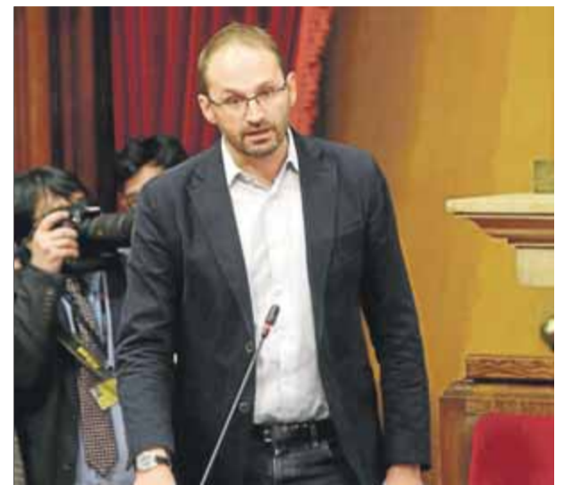
Joan Herrera en un ple del Parlament el 2014 com a diputat i president del grup d'ICV-EUIA

Han estat dos anys intensos i durs, sí. Però hem assolit els nostres compromisos en matèria de transparència i de reconfiguració de la nostra oferta electoral. Estem oberts, com sempre, a sumar i explorar totes les fórmules possibles que ens ajudin a representar la majoria de catalans i catalanes. És temps de fer balanç i de prendre impuls. Tenim el millor equip i aspirem a sumar el màxim i a comptar amb tot-hom. És moment d'anar junts, pel Partit Demòcrata i per Catalunya.