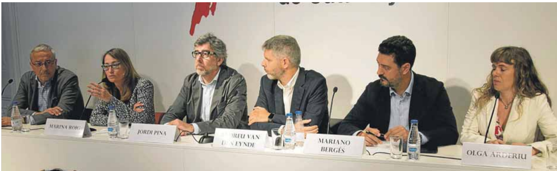
Els advocats dels nou presos polítics van presentar ahir la propera iniciativa per reclamar-ne la llibertat, un cop Alemanya ha descartat la rebel·lió ■ ORIOL DURAN

AVUI • Una gran manifestació tornarà a reclamar la seva llibertat i el retorn dels exiliats