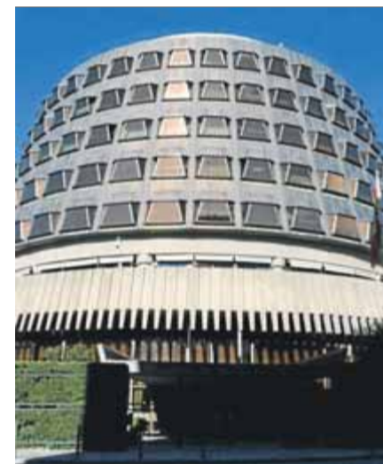
El TC ja va definir la rebel·lió el 1987 ■ ACN

En base a això, és clar, el TC va donar parcialment la raó als demandants i va deixar clar que el concepte de "bandes armades" s'ha d'interpretar "restrictivament i en connexió, en la seva transcendència i abast, amb el d'elements terroristes". De fet, la sentència es fa seva la jurisprudència penal, que ja s'havia pronunciat acotant els possibles suspesos no tan sols a la "permanència i estabilitat del grup, i al seu caràcter armat (amb armes de defensa o de guerra, i també amb substàncies o