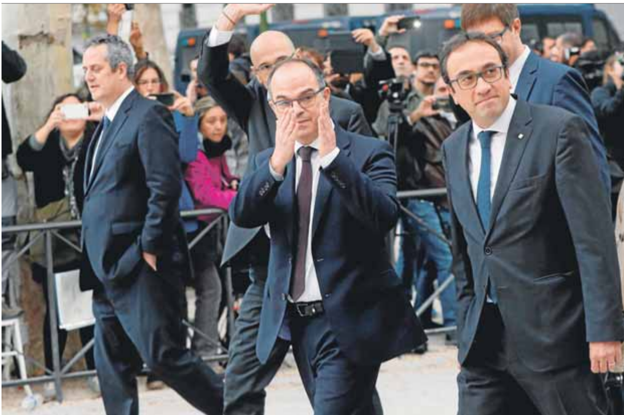
Forn, Turull i Rull, i al darrere Romeva i Mundó, el 2 de novembre de l'any passat anant cap a l'Audiència Nacional

Joaquim Forn, Lluís Puig, Josep Rull i Jordi Turull