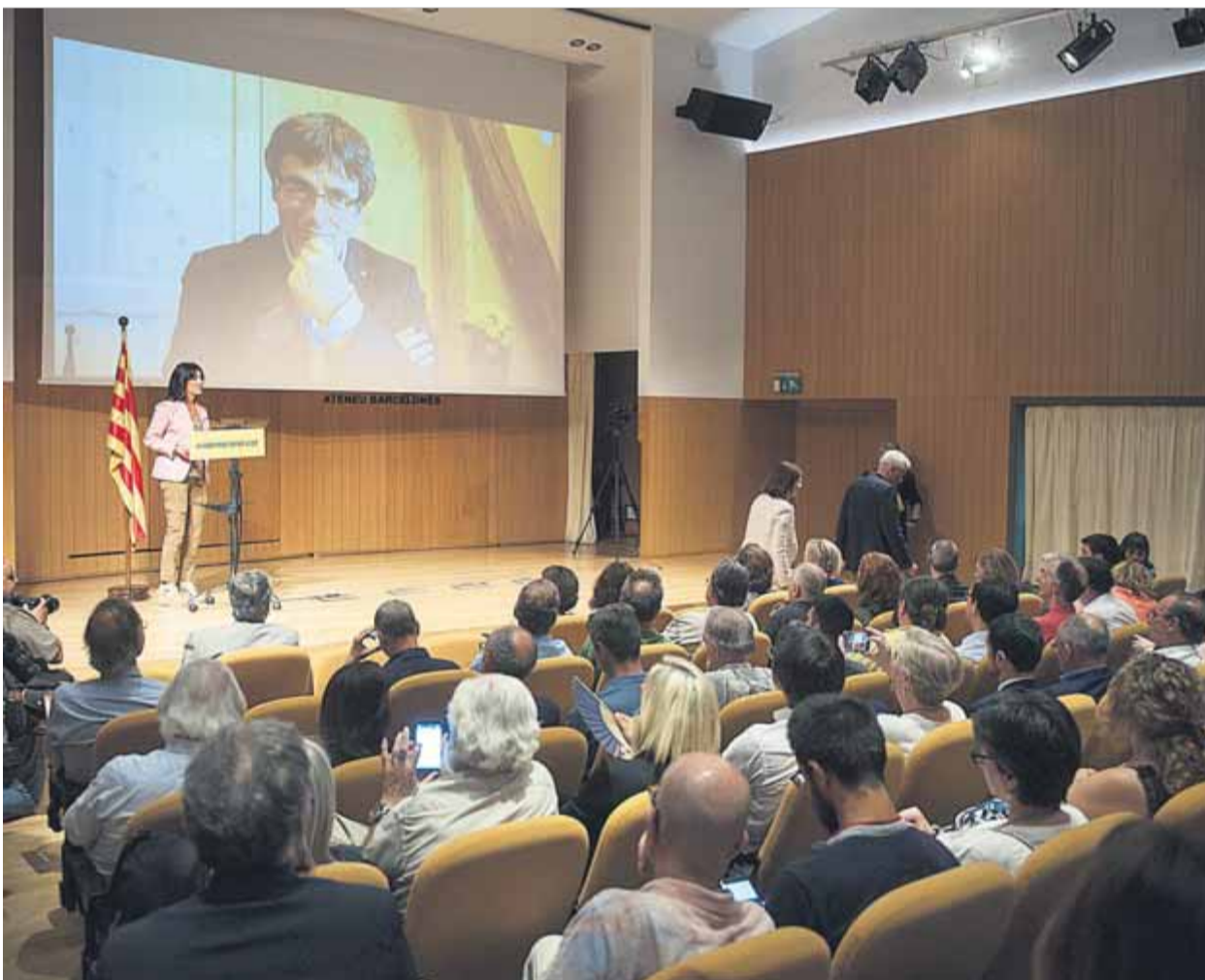
La Crida Nacional per la República va ser presentada ahir en un acte a l'Ateneu Barcelonès ■ JOSEP LOSADA

ESCEPTICISME • ERC no s'apunta "a un moviment de centredreta" i el PDeCAT diu que encara ha d'estudiar si li encaixa