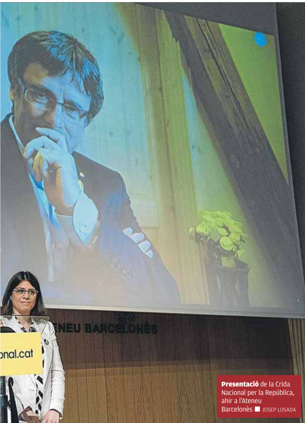
Presentació de la Crida Nacional per la República, ahir a l'Ateneu Barcelonès