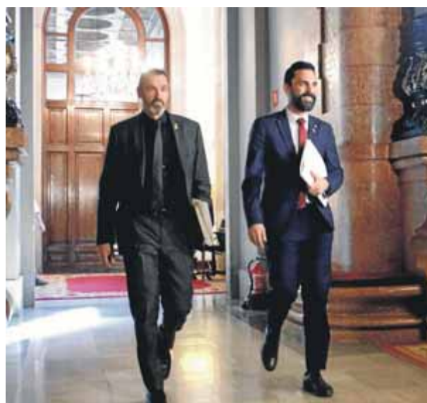
Torrent i el vocal Campdepadrós anant a l'última mesa

L'informe, de fet, s'agafa al precedent que va establir el mateix jutge quan va permetre delegat el vot