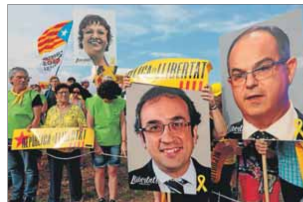
Pancartes de suport als presos en una concentració a l'exterior de la presó de Lledoners

És en aquesta aposta que tots quatre oferim la nostra total implicació. La nostra manera de ser PDeCAT és acabar formant part de Junts per Catalunya. És fer possible, amb molts d'altres, Junts per Catalunya. No ens podem imaginar cap servei més important que el nostre partit pugui fer ara al projecte de llibertat nacional, al projecte de la República Catalana. És un repte apassionant i, com va passar el 21-D, al costat de dones i homes de procedències molt diverses, estem disposats a liderar-lo. I per això cal que hi siguem tots, junts. Amb noves forces, junts. Per Catalunya.