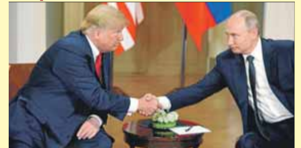
Trump dona la mà a Putin, ahir a Hèlsinki